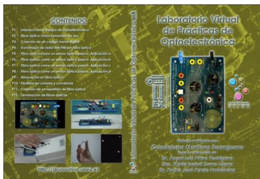
Fig. 2. Carátula del DVD Laboratorio Virtual de Prácticas de Optoelectrónica.

Todos estos materiales son utilizados habitualmente por nuestros estudiantes y por los de otras universidades que nos los han solicitado.