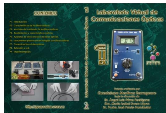
Fig. 3. Carátula del DVD Laboratorio Virtual de Comunicaciones Ópticas.