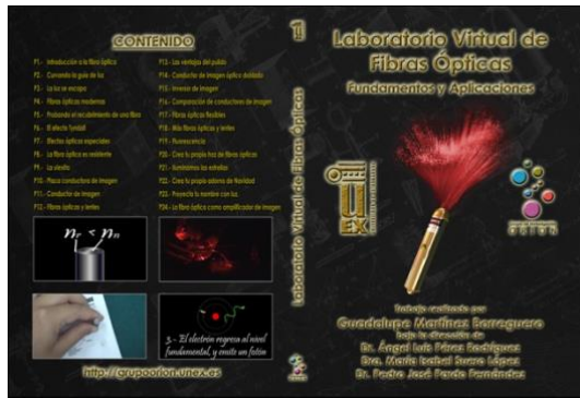
Fig. 4. Carátula del DVD Laboratorio Virtual de Fibras Ópticas: Fundamentos y Aplicaciones.