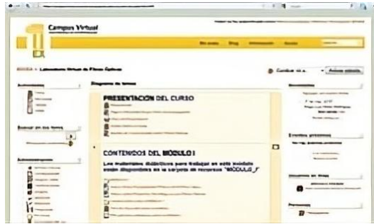
Fig. 1. Captura de la interfaz del curso virtual de “Fibras ópticas” implementado en Moodle.

Entre los materiales que utilizamos habitualmente con nuestros estudiantes en las asignaturas de enseñanza reglada, destacamos dos colecciones de vídeos didácticos, con sus fichas y guiones, cuestionarios y test de evaluación, implementados en la actualidad como cursos Moodle. Son las prácticas de laboratorio de “Fibras ópticas” y de “Paneles solares fotovoltaicos”. En la figura 1 se muestra una captura de la plataforma del primero.