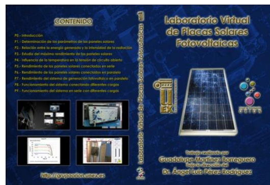
Fig. 6. Carátula del DVD Laboratorio Virtual de Placas Solares Fotovoltaicas.