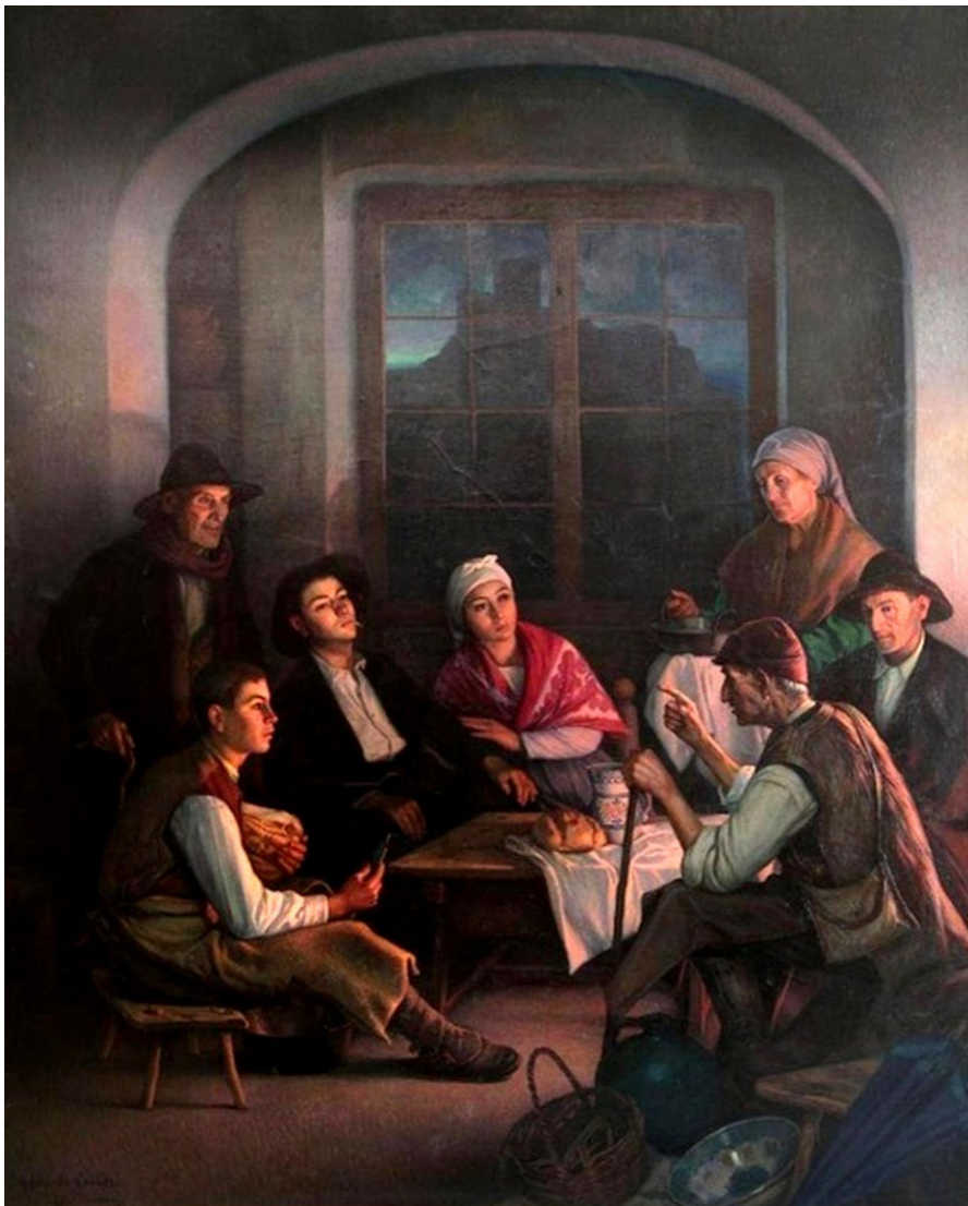
Figura 6: "La leyenda del Castillo". Propiedad: Museo de Bellas Artes de Badajoz (MUBA). 33 .