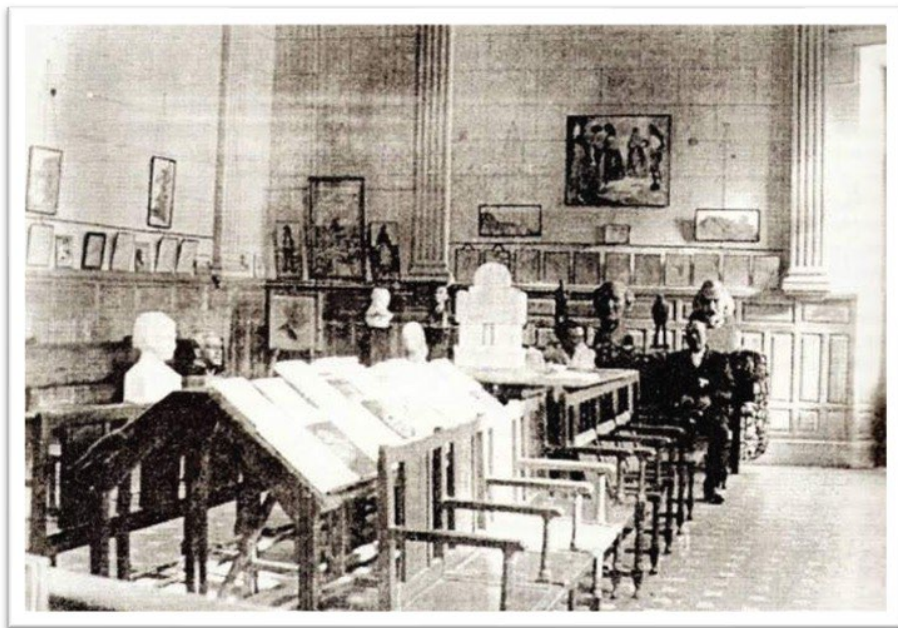
Figura 8: Salón de Sesiones del Ayuntamiento de Albuquerque. Década de 1930. Exposición realizada por el escultor Aurelio Cabrera en dicho lugar mostrando objetos relacionados con el patrimonio histórico-artístico de la localidad. Propiedad: Secretaría del Ayuntamiento de Albuquerque.

Por desgracia, el proyecto original se ha visto alterado por distintas circunstancias. En primer lugar, y como ya se ha comentado, el Ayuntamiento mantuvo un pleito con la mayoría de los contratados externos y entendemos que, por este motivo, nunca llega a entregarse al Consistorio las obras Albuquerque devoto de la Virgen de Carrión y La Leyenda del Castillo . En su lugar, fueron vendidas a coleccionistas privados. En segundo lugar, el escudo que finalmente se estampó en el techo fue destruido al vencer esta estructura en los años 40 del siglo XX 53 . Este no fue el único elemento afectado, pues los papeles pintados y decorativos fueron sustituidos por pintura rasa. Del mismo modo, las maderas también fueron pintadas y barnizadas. Finalmente, el testero