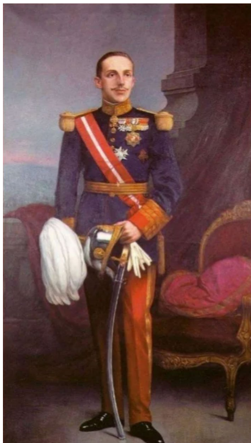
Figura 7: “Retrato del Rey Alfonso XIII”. Propiedad: Ayuntamiento de Alburquerque.

El autor divide la composición en tres partes -esta vez de manera vertical-, centrando el foco en la figura del rey, vestido con galas militares, con semblante solemne y noble, acompañado de un sillón de terciopelo rojo y un elemento arquitectónico, acaso un elemento arquitectónico con una pilastra lateral y una balaustrada configurando una escenografía de balconada que da acceso a un paisaje desdibujado que muestre, casi de manera impresionista, el atardecer extremeño 49 .