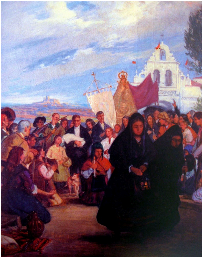
Figura 5: Albuquerque devoto de la Virgen de Carrión". Propiedad privada.

La escena planteada por Covarsí, pues supone un personal conocimiento del desarrollo de la romería que cada 7 de septiembre se hace en Albuquerque 30 .