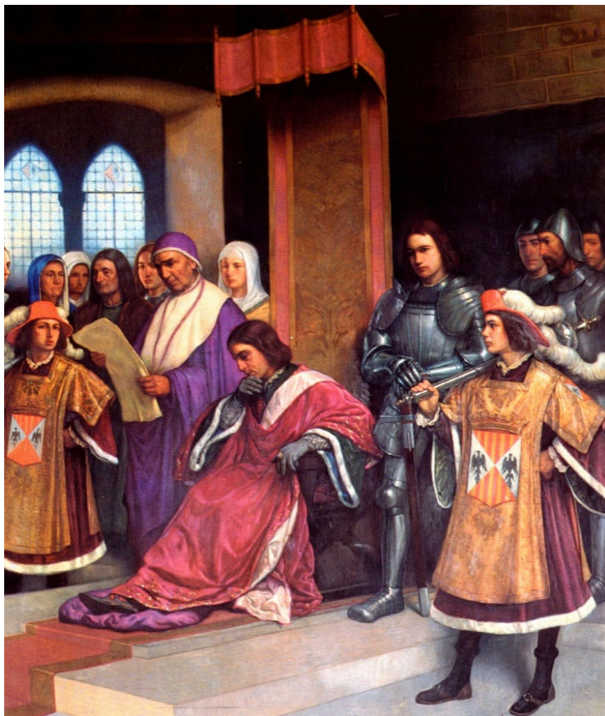
Figura 2: “Concesión de los Baldíos de Alburquerque por el Infante Don Enrique de Aragón”. Propiedad: Ayuntamiento del Alburquerque.