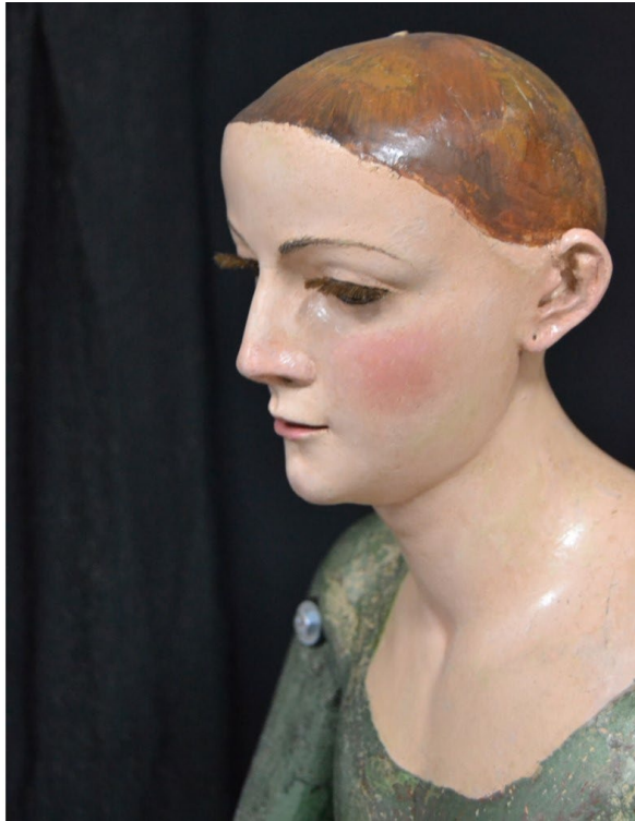
Figura 3. Manuel García de Santiago, Nuestra Señora del Rosario , 1756. Parroquia de San Bartolomé, Mairena del Alcor (Sevilla).

Por testimonios orales y gráficos, al menos desde la primera mitad del siglo XX, sabemos que la imagen de la Virgen con el Niño fue ejecutada sedente sobre una nube que a modo de peana ejercía de sustento para el conjunto (fig. 2). Sin embargo, en la década de los años noventa del siglo pasado, la peana fue destruida, sin que tengamos más datos al respecto, por lo que en la actualidad no podemos disfrutar del conjunto realizado al completo. Destacan los rasgos suaves, las cabezas redondeadas y el estudio del pelo, tan característico en la obra de García de Santiago, rasgos aprendidos sin lugar a dudas en el taller paterno. Asimismo, destacamos la característica disposición de los ojos almendrados con pequeñas pupilas en sus centros, elemento formal propio atribuible al autor, sobretodo, en la escultura femenina. Del mismo modo sobresalen las cejas pequeñas, curvas y muy perfiladas, la nariz puntiaguda y recta, estando en eje con la boca pequeña y enjuta (fig. 3). Estos rasgos nos hicieron pensar desde un principio que se correspondían con la obra de Manuel García de Santiago, aunque no se tuviera constancia documental de ello.