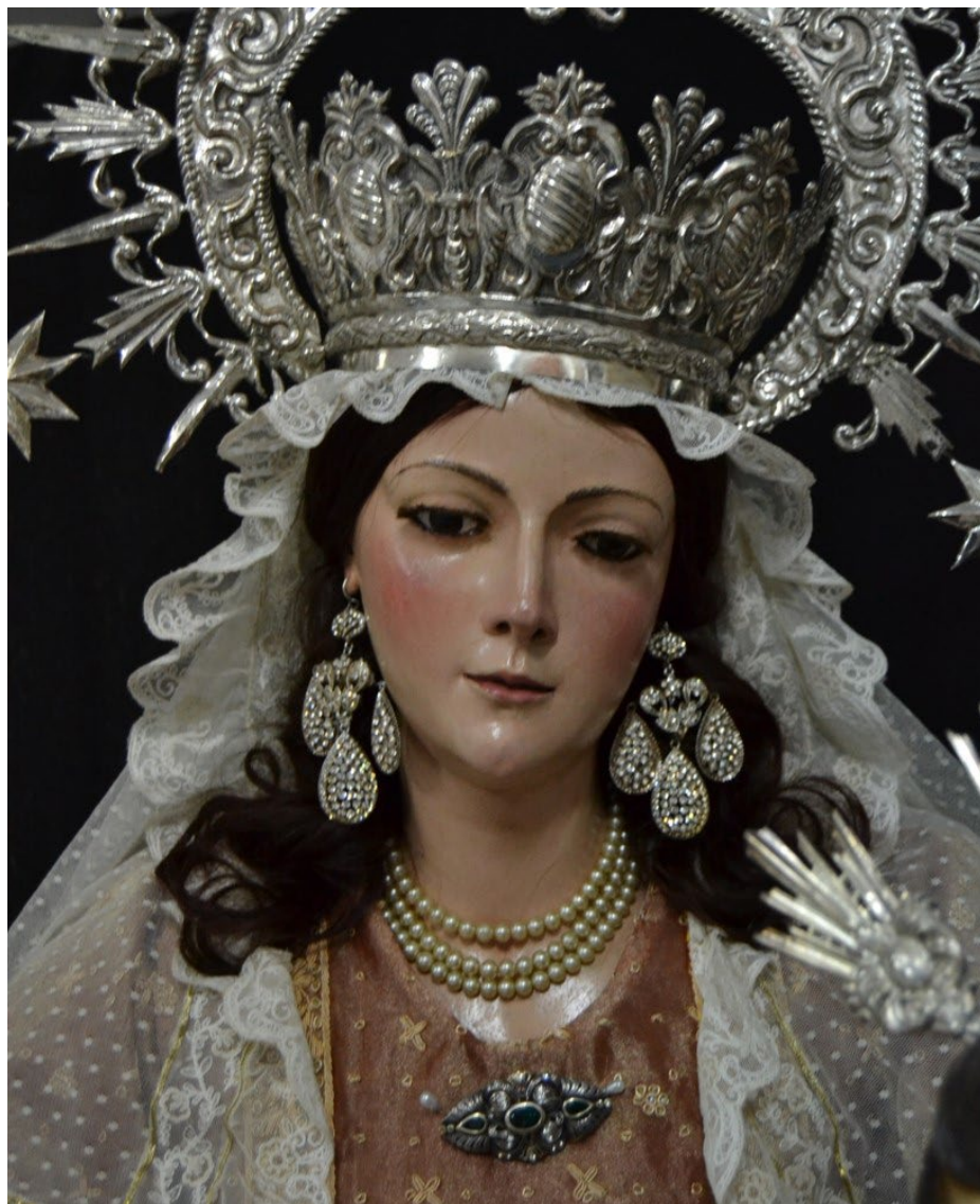
Figura 7. Manuel García de Santiago, Nuestra Señora del Rosario , 1756. Parroquia de San Bartolomé, Mairena del Alcor (Sevilla).