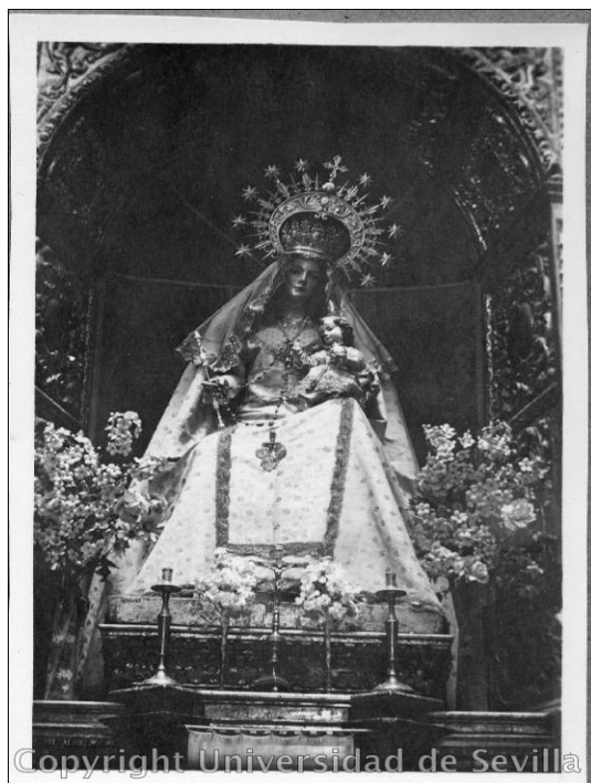
Figura 2. Manuel García de Santiago, Nuestra Señora del Rosario , 1756. Parroquia de San Bartolomé, Mairena del Alcor (Sevilla).

La talla de Nuestra Señora del Rosario comparte las características principales de un género de escultura devocional concreto, típico de la piedad posterior al Concilio de Trento. Esta preside el retablo que se alza en la embocadura del testero de la capilla sacramental de la parroquia de Mairena del Alcor, en la nave de la epístola.