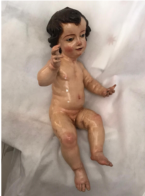
Figura 4. Manuel García de Santiago, Niño Jesús de Nuestra Señora del Rosario , 1756. Parroquia de San Bartolomé, Mairena del Alcor (Sevilla).

La imagen del pequeño infante (fig. 4) hace gala de una grácil y dinámica postura que compagina con el gesto de bendecir con la diestra y sostener la bola fajada del mundo en la contraria. El rostro redondeado y con rasgos muy barrocos, donde resalta la tierna expresividad de sus grandes ojos entornados y sus labios sonrientes. Dichas facciones prácticamente son la repetición de la imagen principal, pero a escala infantil, en la figura del pequeño Jesús, aunque este luce una cabellera de talla, en vez de la melena postiza de pelo natural de su Madre.