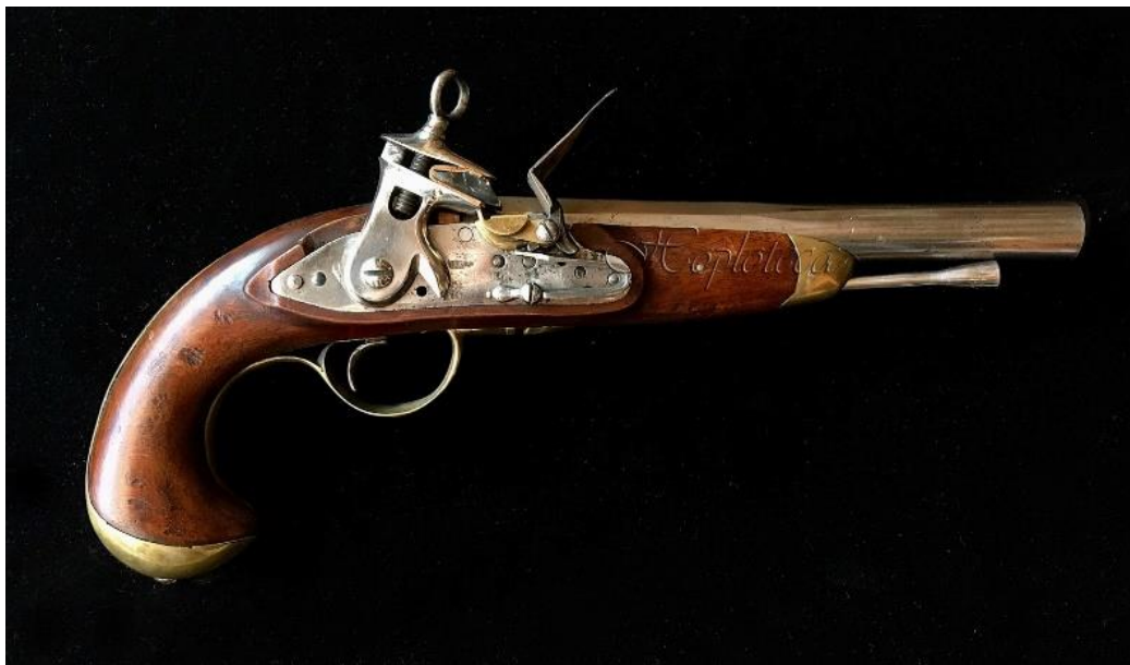
IMAGEN 9: Pistola española de caballería mod. 1801.

Cuesta había señalado Llerena como punto de reunión para los fugitivos. La infantería llegó poco a poco, pero cuando él llegó vio que la caballería se había juntado allí con poca merma. En sus órdenes generales agradeció al ejército su buen comportamiento en Medellín, exceptuando por su nombre a los regimientos de caballería que tan deshonorosamente habían huido, y con ello habían provocado la derrota, que, si hubieran cumplido con su deber como la infantería, habría resultado ser la victoria más importante y gloriosa. Por esta ofensa degradó a tres coroneles. No parece que se impusieran