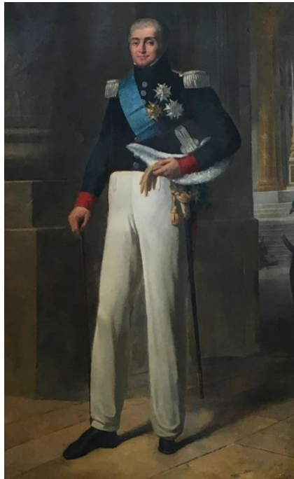
IMAGEN 6: Latour-Maubourg, cuando era ministro de Guerra.

hasta que parte de su reserva logró conseguir que su infantería aguantara. En la izquierda los españoles habían tomado la primera batería cuando una fuerte tropa de caballería, protegida por una columna de infantería, avanzó para recobrarla, y en ese momento toda la caballería española de la izquierda entró en pánico y, sin enfrentarse al enemigo, sin intentar resistir en lo más mínimo, huyó del campo en el mayor desorden, la mayoría de ellos a una distancia de muchas leguas. Ejemplos de un pánico tan bochornoso no fueron sino demasiado frecuentes en los ejércitos españoles durante la guerra, pero en ningún caso fue más funesto o más inexplicable que en este en cuanto que el día corría bien, la infantería estaba de buen ánimo, la ventaja estaba de su lado, y los regimientos que en este punto crítico se deshonraron y traicionaron a su país habían mostrado pericia y valor durante la retirada del Tajo, y se habían distinguido en el combate de cerca de Miajadas.