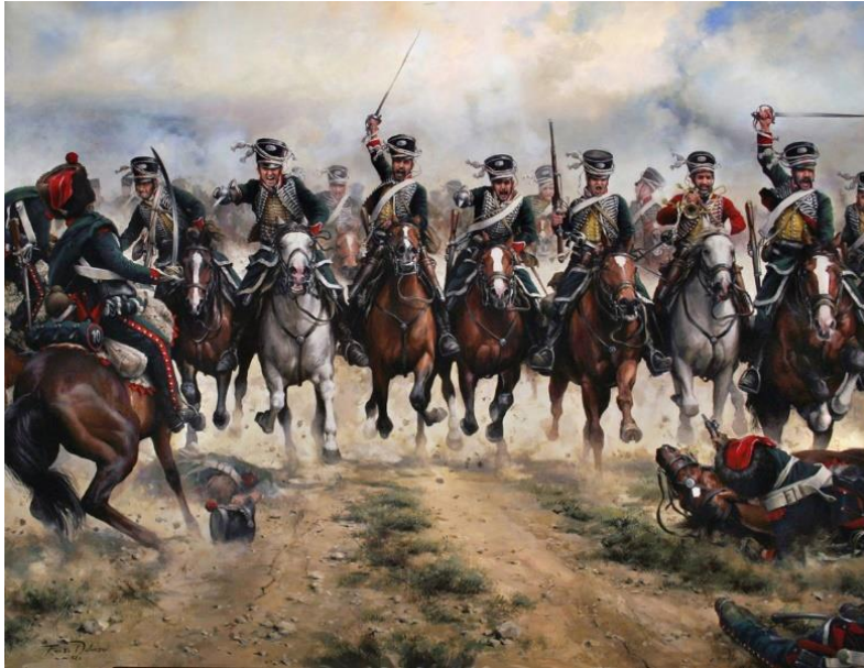
IMAGEN 4: "La Degollá" de Miajadas, óleo de Augusto Ferrer Dalmau.

En estos momentos Cuesta recibió la información de que desde Madrid se había enviado un tren de artillería pesada hacia Extremadura, lo que le hizo comprender que el objetivo principal del enemigo era poner sitio a Badajoz. La posesión de esa fortaleza era tan importante para el éxito de las operaciones contra Portugal, que se había percibido este propósito tan pronto como los franceses se hicieron dueños del campo, y se había encargado al gobernador en repetidas ocasiones que no escatimara medios para poner sus defensas en buen estado. En consecuencia, Cuesta hizo un plan nuevo e informó a la Junta Central de que acosaría a los sitiadores y cortarían su comunicación con Madrid. Pero nada más producirse la unión con Alburquerque decidió buscar al enemigo y presentar batalla en la primera ocasión favorable. No fue el hecho de sumar fuerzas lo que le indujo a tomar esta medida puesto que había esperado recibir 6.000 hombres, mientras que se encontró con algo más de la mitad de ese número, pero... una indecisión larga suele terminar en una determinación imprudente.