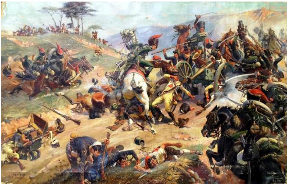
IMAGEN 7: Medellín, ilustración del alemán Adolf Wald.

de su intención de presentar batalla ni una hora antes de comenzar el combate. Las cosas se iban poniendo cada vez peor y, al dejar Eguía la derecha de la línea, el duque dio las órdenes necesarias, pero se habían retrasado demasiado tiempo: toda la fuerza de la artillería francesa se había concentrado contra estas columnas, que ahora eran las únicas tropas que permanecían indemnes. Se produjo la dispersión total, y el enemigo formó una cadena de caballería todo alrededor del ejército derrotado y ejecutó sus órdenes, que eran no dar cuartel. Habían sufrido lo suficiente en el combate como para obedecer esta orden atroz de buena gana. Tenían 4.000 hombres entre muertos y heridos, cerca de un quinto de toda su fuerza. Oficialmente declararon que los españoles habían tenido una pérdida que ascendía a 7.000 muertos. Según otras cuentas la elevaban a 12.000. Cuesta sólo pudo afirmar que era enorme y confirmar que ciento setenta oficiales de infantería y diez de caballería resultaron muertos, heridos o desaparecidos.