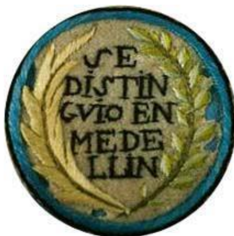
IMAGEN 10: Insignia de distinción.