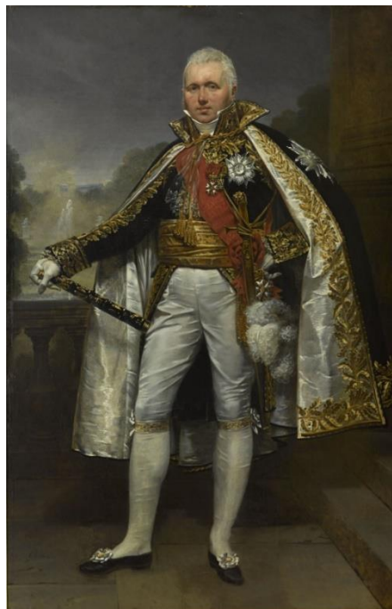
IMAGEN 5: Mariscal Victor, óleo de Antoine-Jean Gros, 1812.