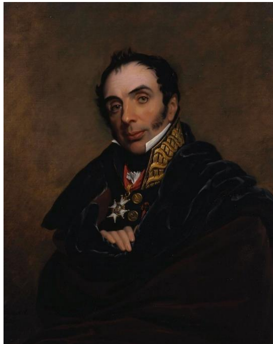
IMAGEN 8: General Álava, óleo de George Dawe.