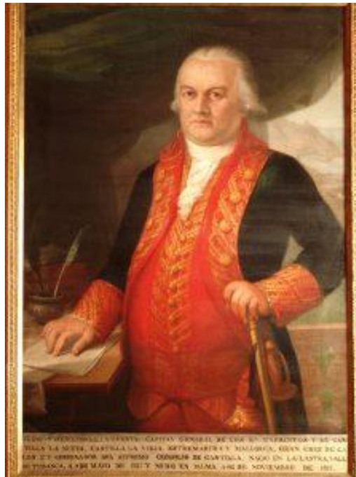
IMAGEN 2: General Cuesta, retrato en su casa natal de Tudanca.

Como Cuesta había previsto, el destacamento francés pasó por Puente del Arzobispo, 2 así llamado por su fundador, D. Pedro Tenorio. En su época existía un puente de madera que una riada se había llevado, y como era por allí por donde los peregrinos del lado oeste del río pasaban para cumplir con su devoción a la famosa imagen de Nuestra Señora de Guadalupe, construyó la actual edificación de piedra y fundó un hospital para su alojamiento, y un pueblo, al que llamó Villa Franca, pero que convenientemente pronto tomó su nombre por el puente, que ha llegado a ser un punto de importancia considerable en las campañas de este año. El enemigo lo cruzó con poca o ninguna oposición, y las partidas avanzadas se retiraron a Mesas de Ibor, donde estaba estacionada su división, y de allí, después de una resistencia fallida, al pueblecito de Campillo [de Deleitosa], pero en buen orden. Este comportamiento satisfizo completamente al comandante en jefe, que estaba ocupando una posición fuerte y esperaba poder rechazar a aquella división enemiga, mientras que el mariscal de campo Henestrosa, con la vanguardia, impediría que el grueso de la tropa se estableciera en el puente de Almaraz.