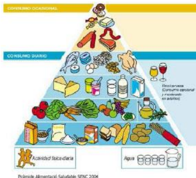
Figura 2. Pirámide de la Alimentación Saludable de la Sociedad Española de Nutrición Comunitaria (SENC). http://www.nutricioncomunitaria.org/index.jsp [15].