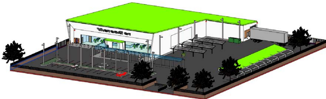
Fig. 3: Supermercado, almac3n refrigerado y administraci3n.

En la Fig. 5 se muestra el supermercado proyectado, que cuenta con zona de exposici3n y venta, as3 como de almacenamiento y acopio de productos.