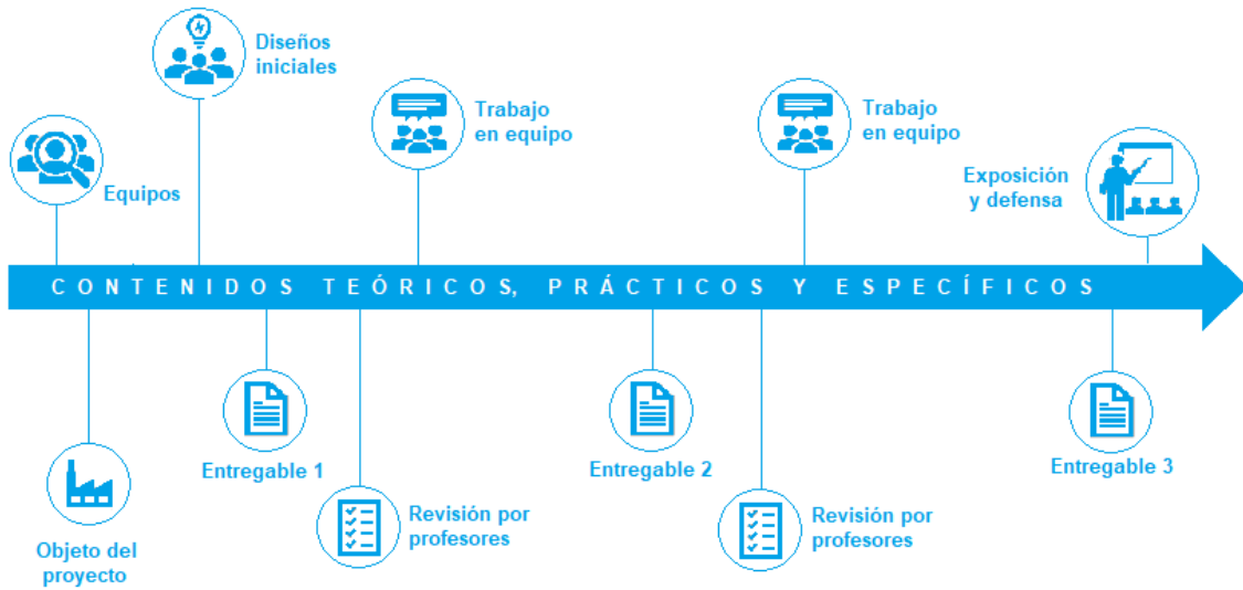
Fig. 1: Programación temporal de actividades del curso.