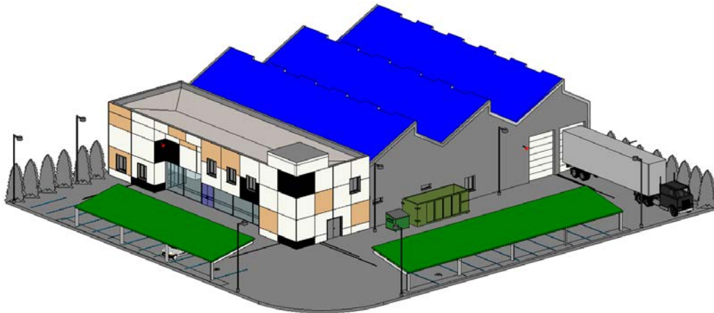
Fig. 2: Carpinter3a, venta de muebles de madera y administraci3n.

En la Fig. 4 se muestra otro ejemplo de establecimiento compuesto por carpinter3a y zona de exposici3n y venta de muebles.