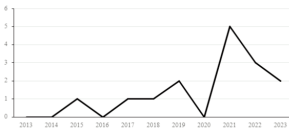
Figura 2. Registro de publicaciones por año desde 2013 hasta 2023.

Desde el inicio del período de análisis (2013), parece ser que no había un gran interés acerca de los tratamientos en adolescentes. Sin embargo, en los últimos años han aumentado las publicaciones ya que en la figura 2 podemos encontrar que gran parte de los estudios incluidos en nuestra muestra se han publicado desde el año 2021.