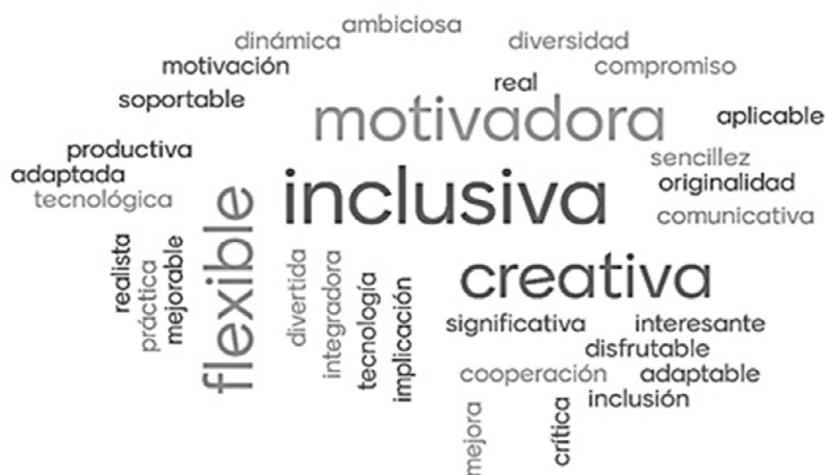
FIGURA 1. Pregunta 1 (nube de palabras): ¿Qué tiene que tener la docencia para que sea innovadora?