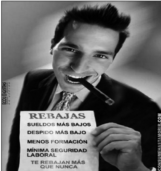
Imagen nº 6