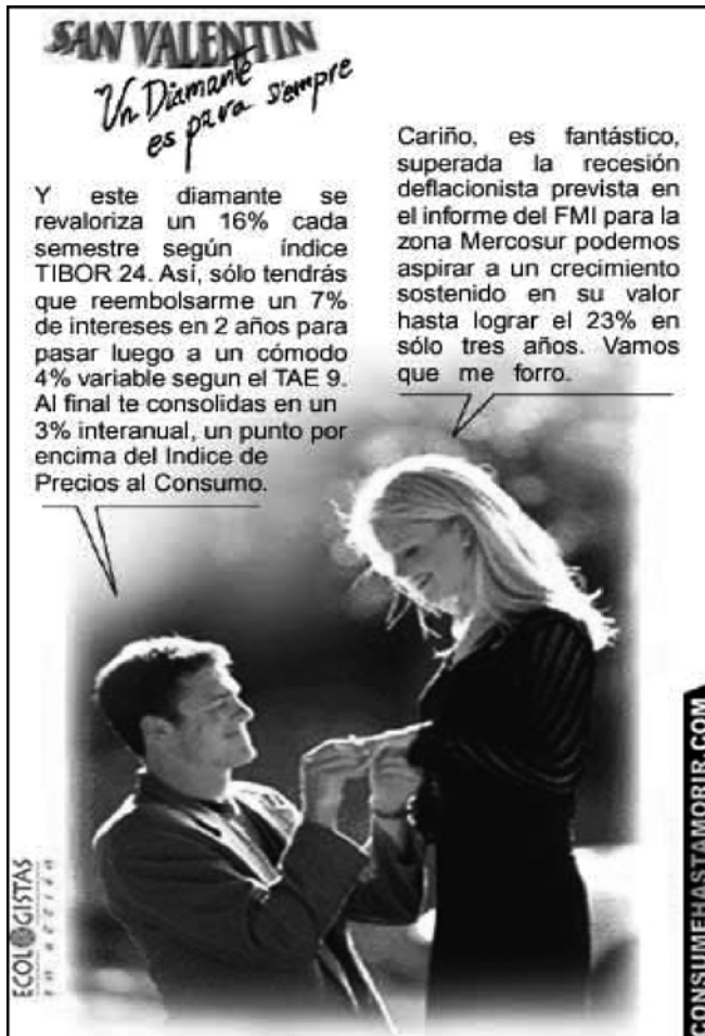
Imagen nº 3