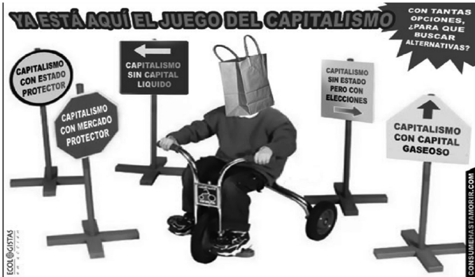
Imagen n° 2