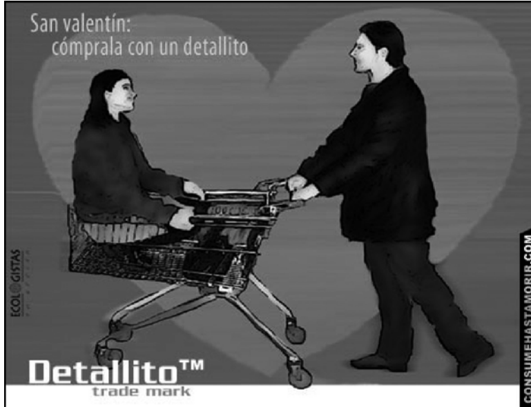
Imagen nº 4