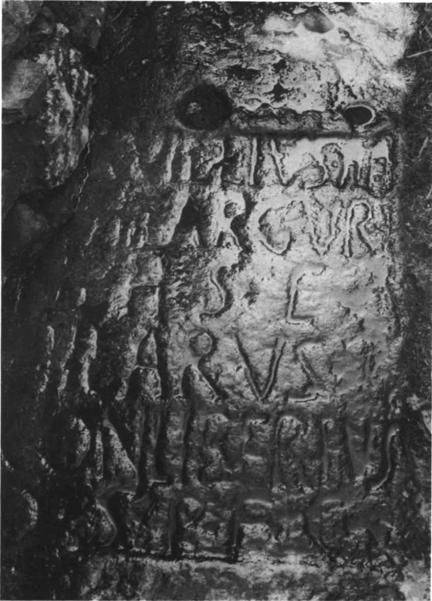
Lámina I. ALDEA DE TRUJILLO