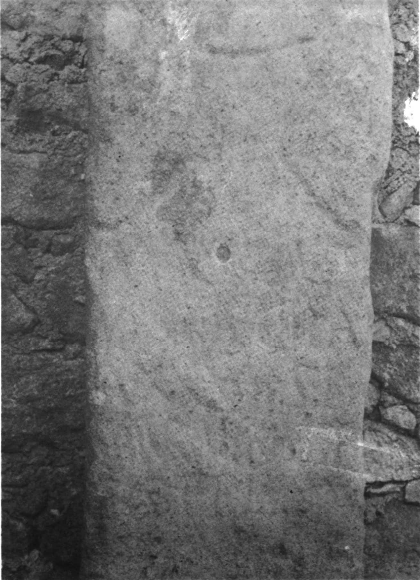
Lámina V. TRUJILLO (detalle de la inscripción)