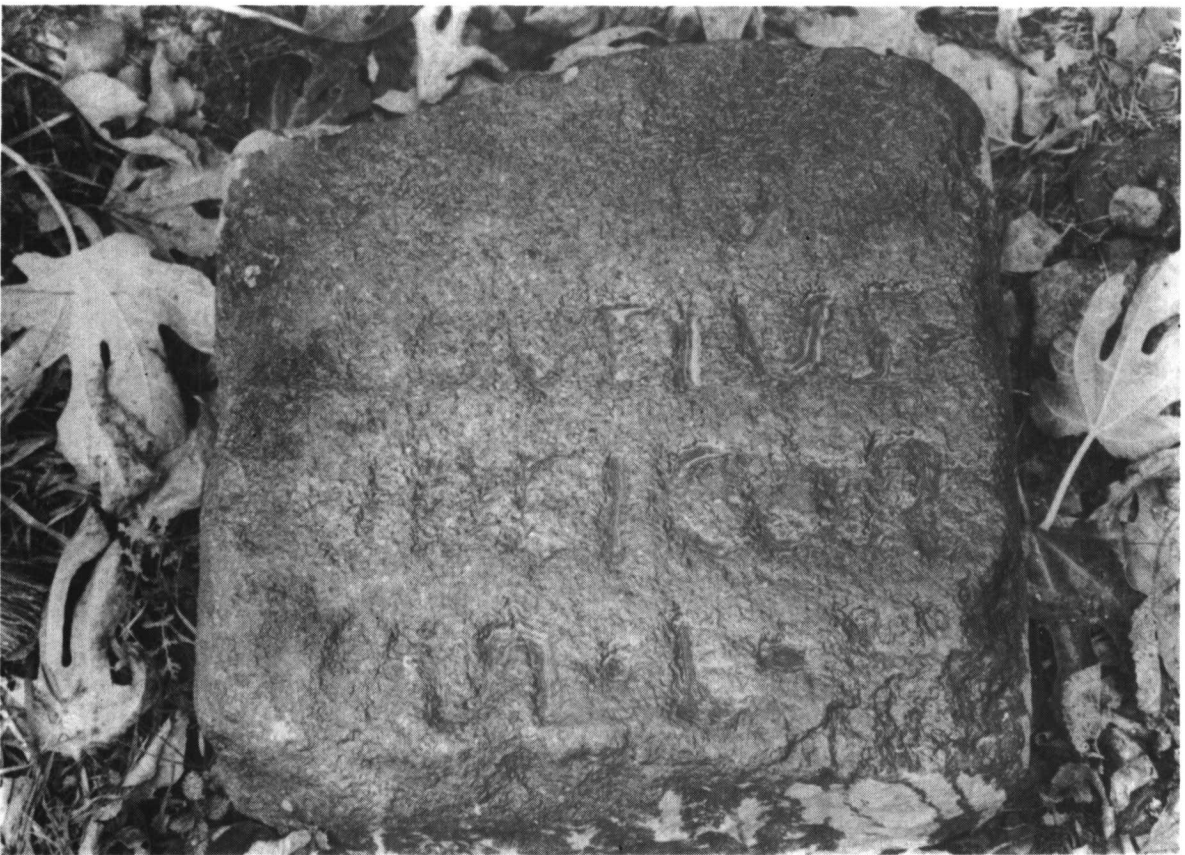
Lamina II. IBAHERNANDO