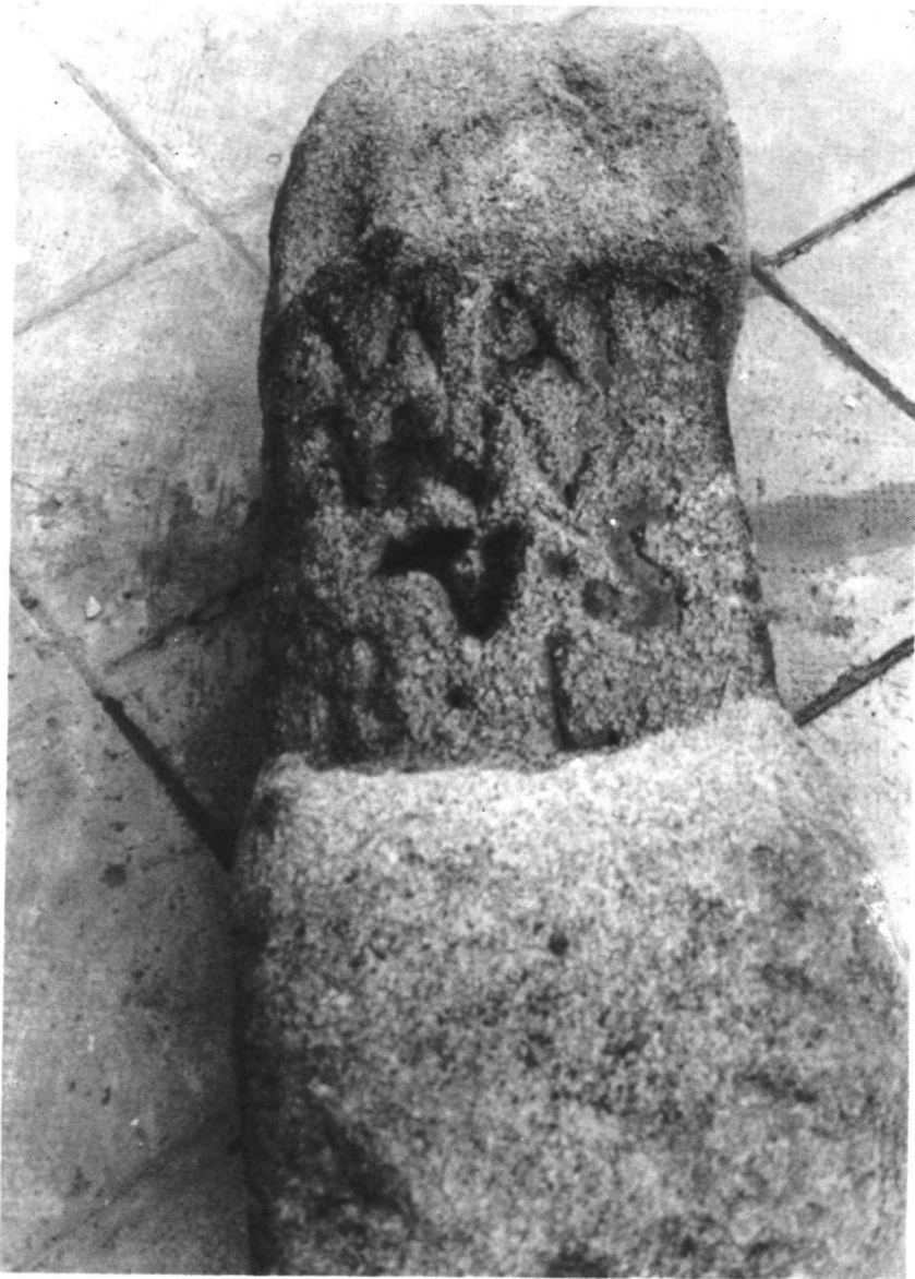
Lámina IIIb. TRUJILLO