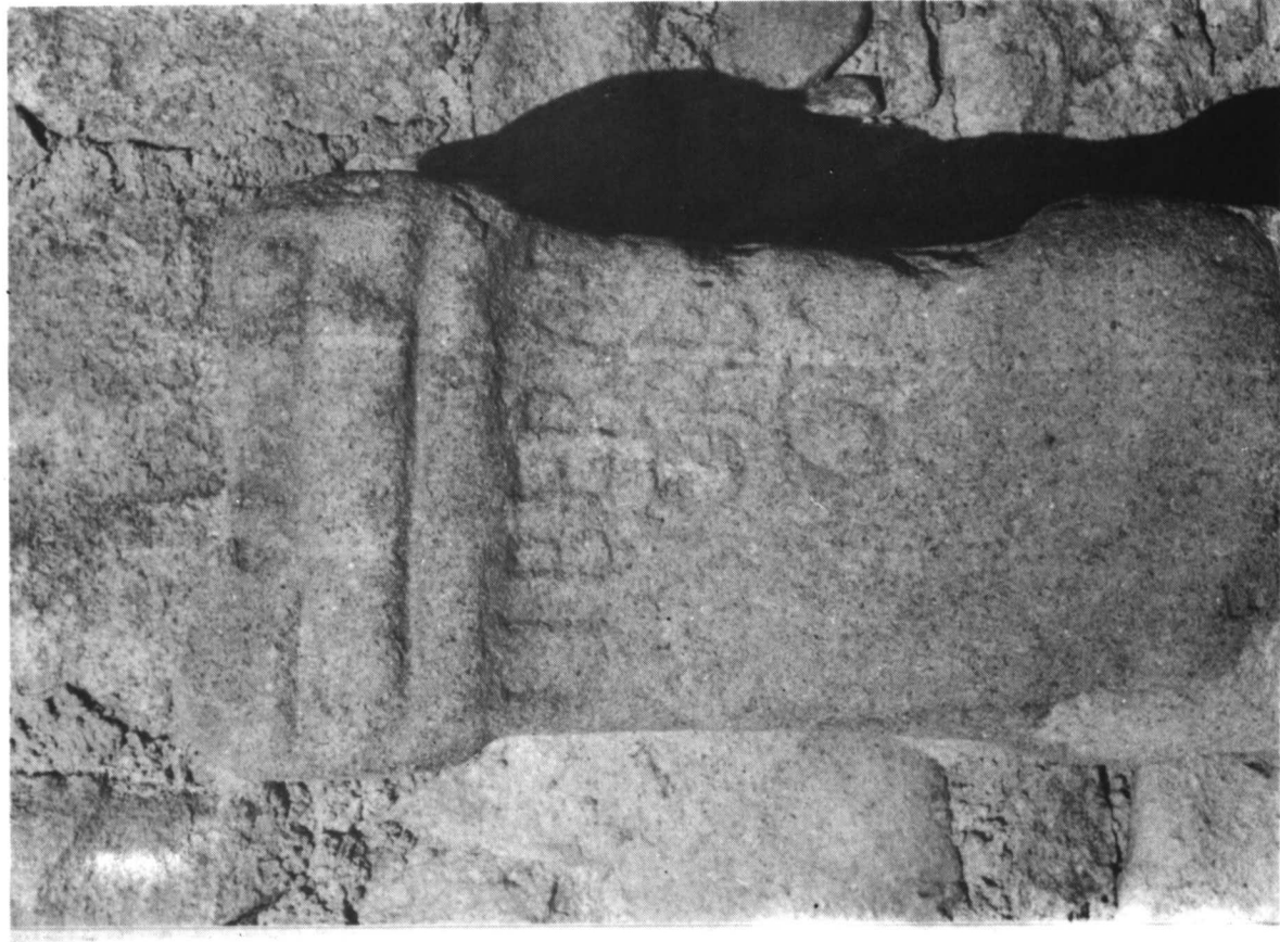
Lámina IIIa. HERGÜJUJUELA