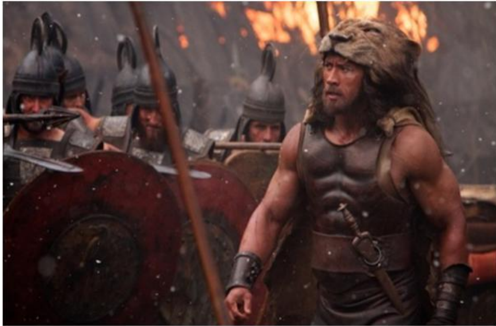
Figura 15: Hércules (2014).

para batallar, la protagonista opta por un top y una falda corta con flecos de cuero; en cambio, las mujeres adineradas visten color pastel, como el rosa salmón que aparece en la película con detalles de encaje, pues ese año hubo muchos vestidos de gala o para bodas, donde las invitadas iban con tonos rosa palo y mucho encaje, incluso llevar un vestido griego estaba a muy demandado, y si no todas, casi todas tenemos en nuestros armario un vestido con matices de la Grecia Clásica.