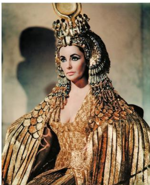
Figura 8: Cleopatra (1963).

Como hemos nombrado anteriormente, es la película ‘péplum’ que ha respetado más la vestimenta sin ceñirse tanto a las modas.