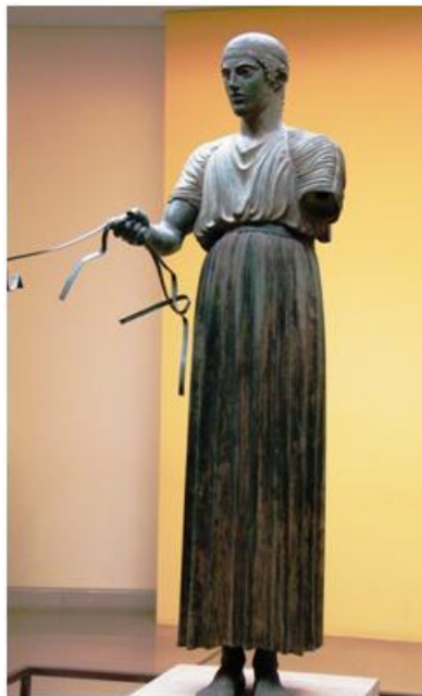
Figura 2: El auriga de Delfos .

A varios miles de kilómetros de los egipcios se encontraban los griegos. En Grecia desde el 1200 a.C. se desarrolló una nueva cultura muy estable en cuanto a indumentaria. De hecho, hasta la época de Alejandro Magno no hubo grandes cambios en los trajes de mujeres y hombres. El traje griego se caracterizó por carecer de forma propia, pues consistían en rectángulos de tela de tamaño variable que se enrollaban o colgaban del cuerpo sin cortar la tela para ello.