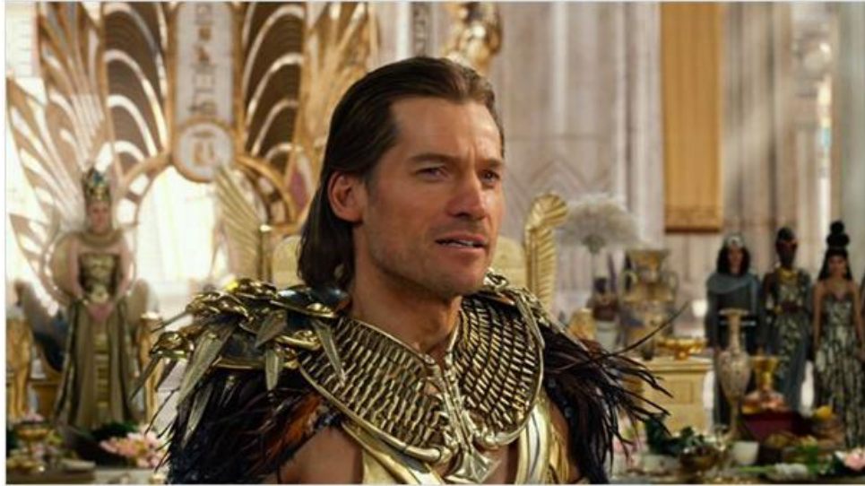
Figura 22: Dioses de Egipto (2016).

Asimismo, digamos que los figurinistas comenten muchos errores en la vestimenta, bien por poca información histórica, por seguir la moda o bien por órdenes de producción, aún así podemos disfrutar de una buena película basada en la Edad Antigua sin preocuparnos de la moda histórica, pues a pesar de que no son exactas las tendencias vividas en otros siglos, si que hacen que el espectador se sienta lo más sumergido posible en la trama cinematográfica.