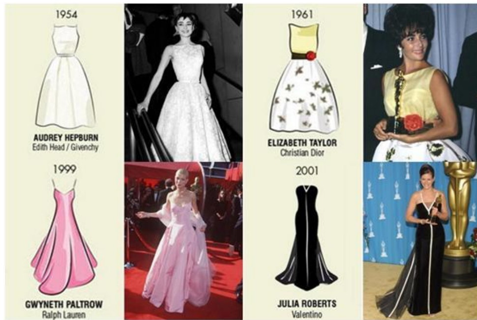
Figura 5: Vestidos históricos de los Óscar.

Asimismo, se puede afirmar que la moda y el cine ha sido, es y será un matrimonio por conveniencia donde ambas partes están obligadas a coexistir hasta el fin de sus días.