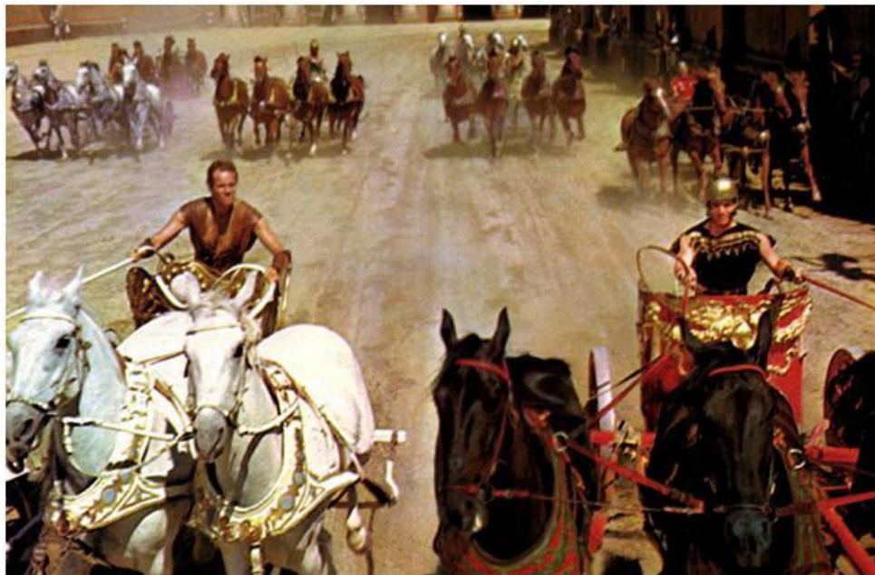
Figura 20: Ben-Hur (1959).