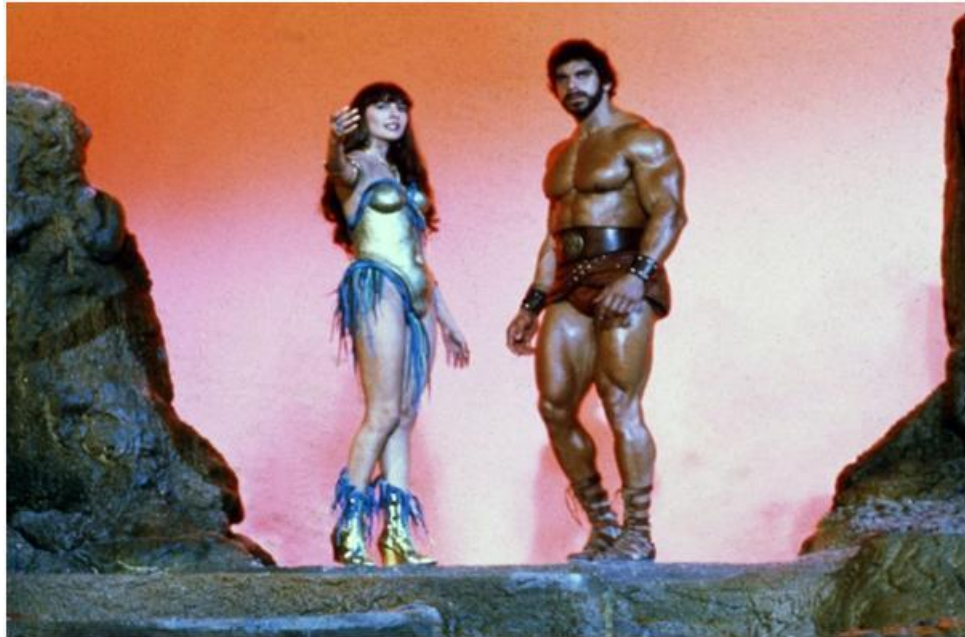
Figura 14: Hércules (1983).

El ' Hércules ' de 2014, interpretada por Dwayne Johnson muestra a un semidiós, hijo de Zeus, más actual y mejor conseguido en el cine; pues al mostrar la moda más cercana 2016, se intuye nos sentimos como espectadores muy identificados con las imágenes y con los detalles de prendas que puedan aparecer. En 2014 el cuero vuelve a ponerse de moda, ya sea en hombres, mujeres, faldas, chaquetas o pantalones, todos volvimos a tener en nuestro armario alguna prenda de esta tela, ya se da imitación o de animal, era algo que no podía faltar en nuestro armario. En dicho año, se mezclaba lo rockero con lo clásico, además los flecos de los 80 podían verse en ponchos, bolsos, y botas. La moda de hace dos años era una mezcla entre los años 50 y los 80, donde ambas tendencias hicieron 'buenas migas'.