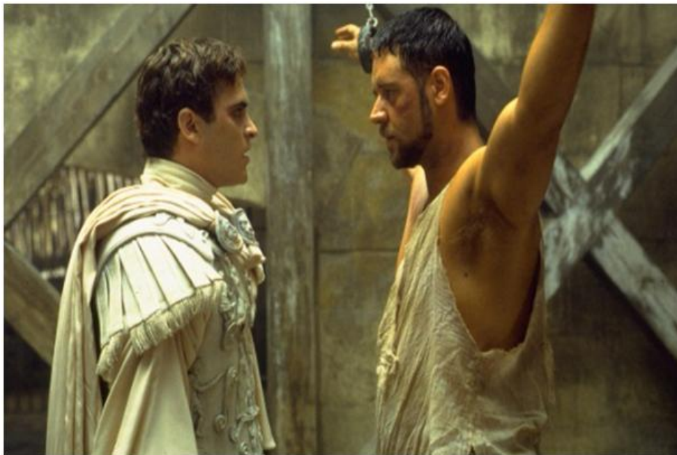
Figura 11: Gladiator (2000).

‘Gladiator’ fue, es y seguirá siendo una película espectacular, pero si es verdad que cuenta con muchos fallos, detalles en los que si uno no se fija puede disfrutar dos horas de entretenimiento sin preocupación alguna.