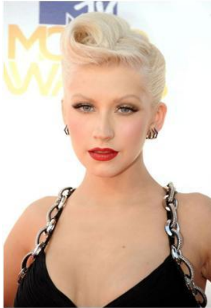
Figura 12: Cristina Aguilera . Fuente: http://bit.ly/2d9mBK2