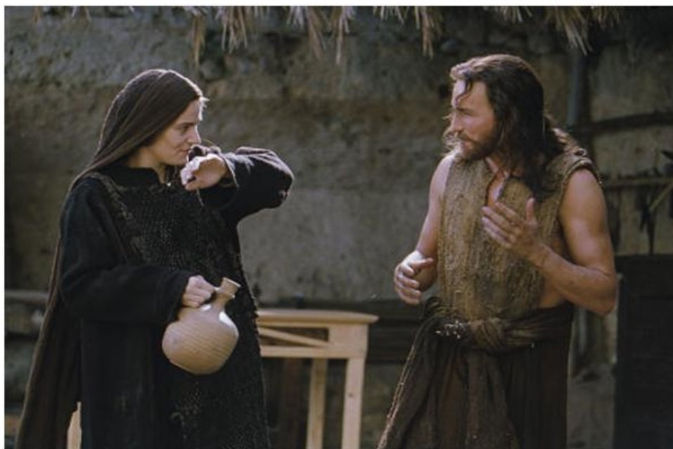
Figura 18: La pasión de Cristo (2004).

Y para finalizar con la vida de Jesús lo hacemos con una historia diferente, una que trata sobre un centurión romano que debe investigar la desaparición del cuerpo de Jesús, después de ser enterrado. ‘Resucitado’ (2016) es una película interpretada por Joseph Fiennes en el papel del centurión y Cliff Curtis en el papel del hijo de Dios.