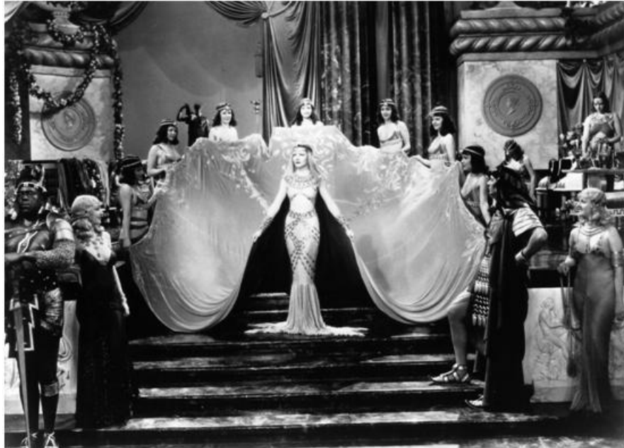
Figura 7: Cleopatra (1934).

bien sirvientes y soldados, se caracterizan por llevar el pecho descubierto y un pequeño calzón a modo de ‘taparrabos’.