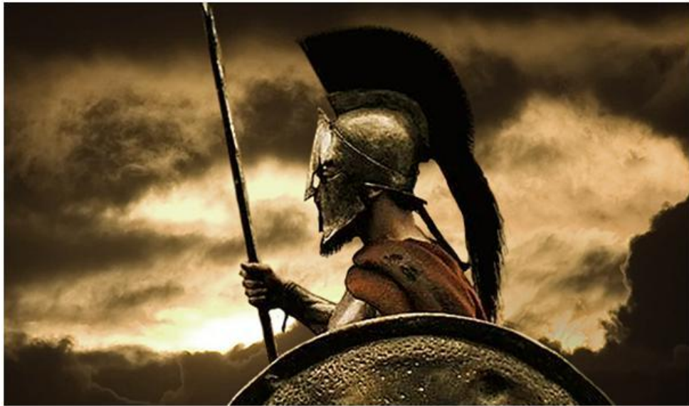
Figura 16: 300 (2006).

Pasemos ahora al último ejemplo del cine mitológico: en el 2011 se estrenó la película 'Immortals' , protagonizada por Henry Cavill y basada en el semidios Teseo, en una Grecia del 1228 a. C.; por aquellos entonces (2011) los pantalones pitillos y los leggins eran un 'boom', y los palabra de honor 9 , los cuellos de camisas en 'v', los vestidos ajustados a la cintura y con vuelo (muy parecida a la moda de los 60), y el pelo ondulado en las puntas en las mujeres, estaba en auge y en esta mitológica película se aprecia bastante bien.