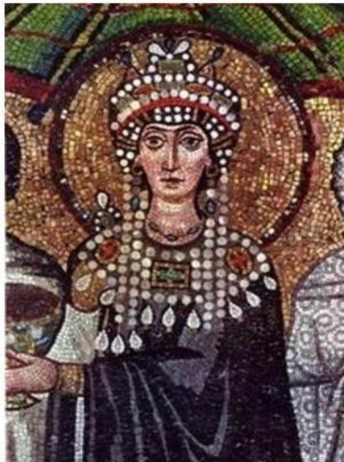
Figura 4: Mosaico de la Emperatriz Teodora.

La túnica que era de mangas estrechas se sustituía a veces por la dalmática de mangas anchas, ambas con incrustaciones de piedras preciosas, al igual que el ‘rablion’, un fragmento de tela cosida en la parte delantera del traje. Alrededor de la cabeza se ponía una cinta de tela anudada en la nuca, que los emperadores posteriores sustituyeron por un tipo de corona, adornada con joyas.