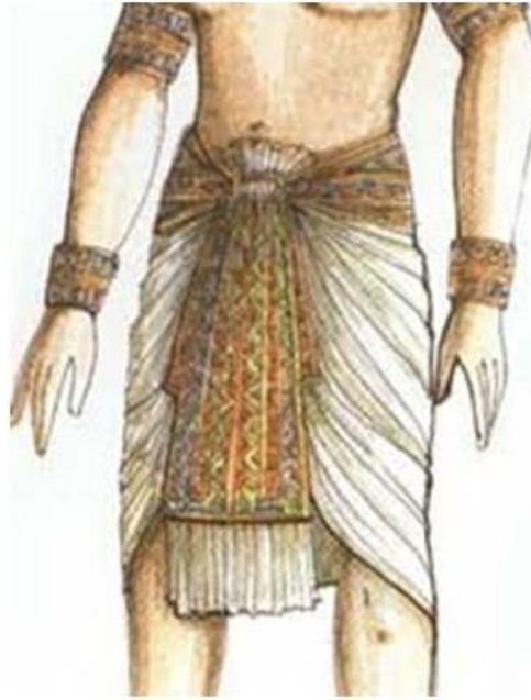
Figura 1: 'Schenti'

Los egipcios a penas utilizaban a la lana, a diferencia de otros pueblos de la Antigüedad, pues consideraban impuras las fibras animales. Después de la conquista de Alejandro Magno, empezó a utilizarse para la fabricación de prendas de uso cotidiano, pero siguió estando prohibida en las prendas de los sacerdotes para amortajar a los muertos, para ellos solo podía usarse lino.