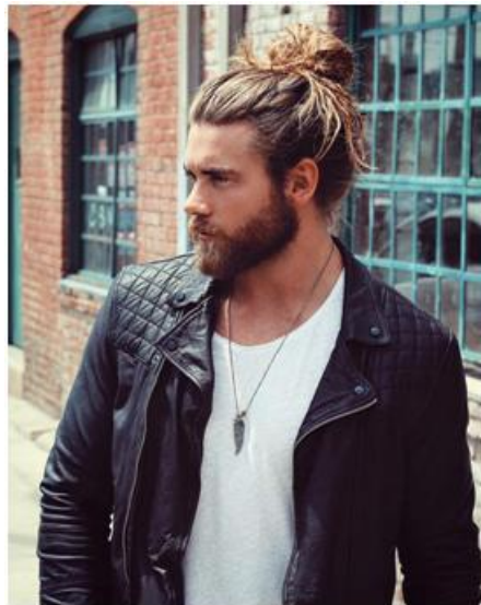
Figura 19: Brock O'Hurn ( Hombre actual ).

permanente para llevarlo perfectamente rizado, el pelo natural ondulado, suelto y largo son moda; por otra parte ellos llevan el pelo rapado por abajo y mucho más largo por arriba, a modo de tupe, aunque hay quien se deja el pelo largo y se lo recoge con un moño, además de la barba, pues la barba en esta época es el maquillaje de los hombres, todo aquel que tiene barba es considerado atractivo, ya que como hemos mencionado antes, el 2016 cuenta con una mezcla de todas las tendencias pasadas. Y por supuesto no pueden faltar en nuestro look algún piercing, pero sobre todo tatuajes, los cuales están en pleno auge.