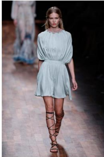
Figura 6: Moda griega actual.

Grecia o la ‘túnica’ del Imperio Romano que a simple vista en el cine, parece que los actores llevaran una sábana o una tela enrollada, y la realidad era esa, pero cada uno se lo colocaba de tal manera que para ellos era moda, y ésta ha llegado hasta nuestros días pues el look de la Edad Antigua sigue en auge en la actualidad, ¿quién no ha oído hablar de un vestido griego, unas sandalias romanas o un collar egipcio?