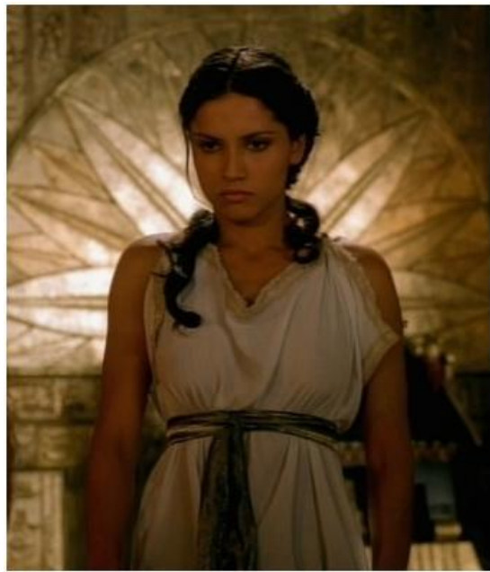
Figura 9: Cleopatra (1999.)

misma no llevan vestidos muy provocativos, como hemos podido ver antes, pues a veces los diseñadores pretenden captar la atención de los espectadores a través de la historia y no solo con el disfrute de piernas, canalillos y abdominales; a finales de los 90 y principios de los 2000 destacaba el minimalismo, la sencillez y se rechaza la ostentación vivida en los años 80. Los hombres romanos van con trajes blancos cortos de tela y encima de ellos una armadura de cuero pero no relucientes ni doradas.