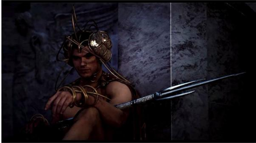
Figura 17: Immortals (2011).