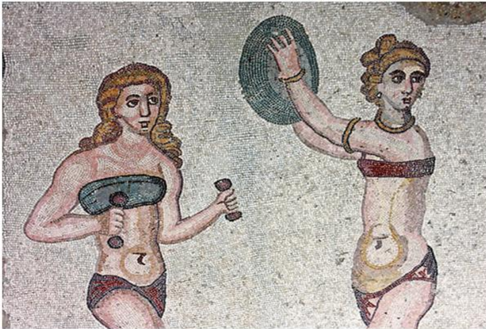
Figura 3: Romanas en el gymnasium .

época del emperador Adriano, quien de nuevo la impuso. Llevaban el pelo corto y el que quería o podía permitírselo, se rizaba la cabellera.