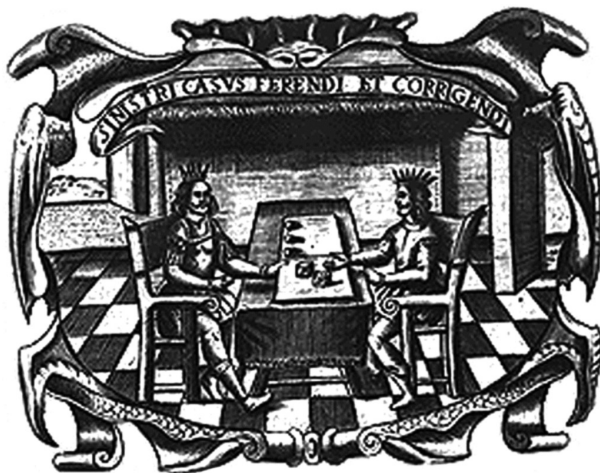
FIG. 9. MENDO, A., Príncipe perfecto y ministerios ajustados, documentos políticos y morales, Lyon, H. Boissat y G. Remeus, 1662, documento LIII.

emblema elegido toma el juego de las tablas 23 para significar el tema del texto. La pictura representa a dos reyes jugando a las tablas y el lema dicta «las circunstancias adversas han de ser soportadas y enmendadas». La glosa del mote bajo la pictura apuntala «sobrepóngase con constancia a la Fortuna, que se vence con arte, no con fuerza». El mote recoge, pues, la enseñanza que se explica ampliamente en la declaración. La elección del juego de las tablas para la pictura se corresponde con lo visto en el Libro de los juegos de Alfonso X. Las tablas simbolizan la prudencia, ya que en ellas el jugador está sometido a la suerte de los dados, pero tiene que hacer uso de la inteligencia para avanzar en la partida.