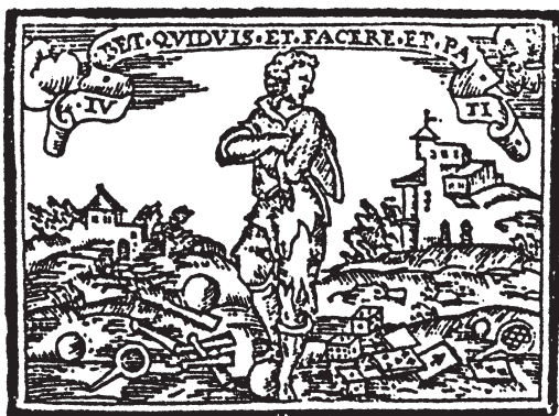
FIG. 1. COVARRUBIAS, S., Emblemas morales , Madrid, Luis Sánchez, 1610, II Centuria, emblema 27 (detalle) 4 .

El presente artículo es un análisis de un aspecto central del ocio en el Siglo de Oro: los juegos; me centraré en por qué y cómo se reflejan en un género en el que la palabra y la imagen se unen para transmitir mensajes morales 2 . Como es sabido, el emblema se compone de mote, pictura , epigrama y declaración en prosa. Me fijaré en el funcionamiento del juego en cada uno de estos elementos en un breve repertorio de los emblemas 3 .