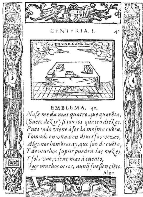
FIG. 6. COVARRUBIAS, S., Emblemas morales, Madrid, Luis Sánchez, 1610, I Centuria, emblema 42.

En la centuria primera hay otro emblema más que parte de un juego, es el cuarenta y dos. En él el mote en español «tanto en uno como en todos», tomado del juego de los dados, se refiere tanto a los instrumentos de juego en cuestión como a los hombres. La pictura nos presenta cuatro dados sobre una mesa. Cada uno de ellos presenta en su cara superior un número de puntos distinto (uno, dos, tres y seis). Hasta aquí nada nos hace pensar en el mensaje preparado por el humanista, es el epigrama el que nos aclara que mientras que en las caras de los dados nos encontramos a veces con uno o con seis puntos, en el caso de los hombres en raras ocasiones nos topamos con uno que reúna todas las virtudes o capacidades. La glosa, por su parte, nos remite a la figura de Gerión y su triple formación distanciándose de la metáfora inicial. La declaración en prosa incide en la enorme valía de estos hombres tan capaces, pero difíciles de encontrar. En este emblema podemos atisbar cierto desprecio hacia la distracción de los dados, pero no cabe decir que haya una finalidad disuasoria explícita; Covarrubias se sirve de esta metáfora porque los dados son un juego común que facilita la ilustración de la verdad que en este caso nos presenta.