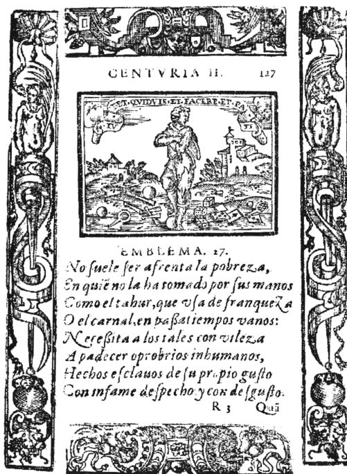
FIG. 7. COVARRUBIAS, S., Emblemas morales , Madrid, Luis Sánchez, 1610, II Centuria, emblema 27.

hacer soportar cualquier cosa» sólo le falta el sujeto, sintácticamente hablando, que es el juego, representado en la pictura por todos los instrumentos dispersos en el suelo (pelotas, raquetas, bolos, naipes y dados). Las fatales consecuencias anunciadas en el lema se concretan en la figura central de la imagen, un hombre desarrapado, y se desglosan en el epigrama: «pobreza», «oprobios inhumanos» y esclavitud. El conjunto mote- pictura -epigrama ofrece y explica a un tiempo la enseñanza, dándonos a conocer lo más penoso de estos casos: que el vicioso jugador se somete a los tales agravios con gusto. A continuación, la glosa, mucho más extensa que las dos anteriores, nos habla en términos muy concretos de las fatales consecuencias de este vicio, refiriéndose tanto al vulgo como a los nobles. Covarrubias no tiene reparo en explicitar tristes casos acaecidos a consecuencia del juego, como, por ejemplo, niños criados en hospitales. Las consecuencias finales nos llevan a los robos y a la horca. Así de negra nos pinta la situación con un claro fin disuasorio. Dice, sin embargo, que todo lo explicado es «lugar común», a pesar de lo cual dedica un espacio considerable a sus argumentaciones. Este emblema consigue conmovernos más que el de Juan de Horozco porque nos lleva a un terreno real. Lo triste y vil de los actos o hechos comentados en la declaración resulta mucho más efectivo que la alusión a Júpiter despojador.