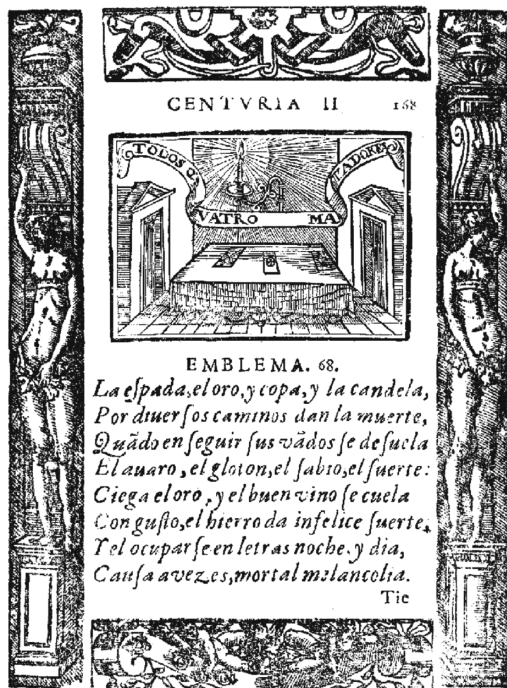
FIG. 8. COVARRUBIAS, S., Emblemas morales , Madrid, Luis Sánchez, 1610, II Centuria, emblema 68.

(en una ocasión se trata de una fórmula empleada en un juego), que serían entonces harto conocidos, lo cual va en consonancia con el contexto del que se toman las metáforas, la vida cotidiana. No se trata de una simple coincidencia, si tenemos en cuenta además que los lemas en español son los menos en la obra (lo mismo ocurre con el francés). La referencia culta, a Horacio (lib. 3, carminum, ode 24), se da sólo en el emblema con carácter disuasorio más claro, el veintisiete de la segunda centuria. Éste recoge la crítica contemporánea al autor hacia este tipo de entretenimientos.