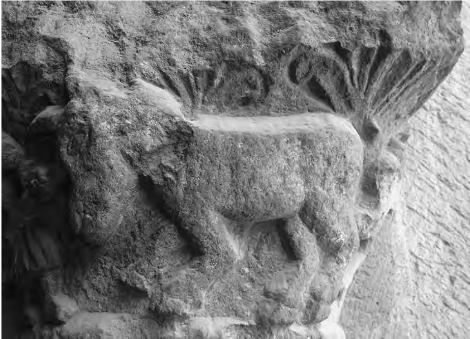
FIG. 7. Unicornio o rinoceronte (?) . León, San Isidoro, pórtico.

También aquí resulta difícil realizar una identificación segura como un unicornio 47 , pues son muchos los puntos que lo separan con el ejemplar del panteón, y para ello baste señalar el tipo de asta, muy reducida, de frente y muy curvada. Aunque planean las dudas sobre las concomitancias con los cuernos de los rinocerontes 48 , la composición recuerda al capitel del claustro de Santa Sofía de Benevento, donde un guerrero se enfrenta a dos seres que los estudiosos no han dudado en leer como unicornios 49 .