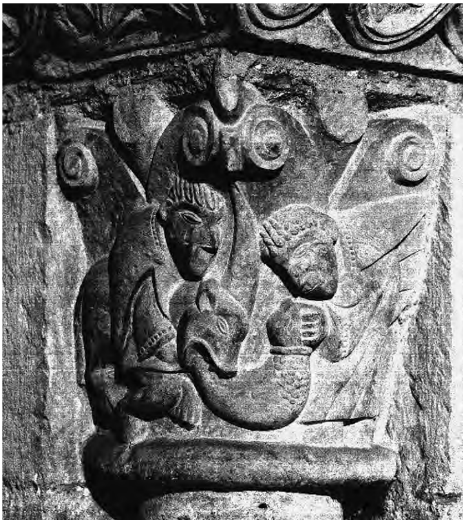
FIG. 1. Capitel del unicornio. León, panteón de San Isidoro.

Bajo una lectura de extrañamiento – étrange/inexpliquée – se acercó M. Durliat al referido capitel: