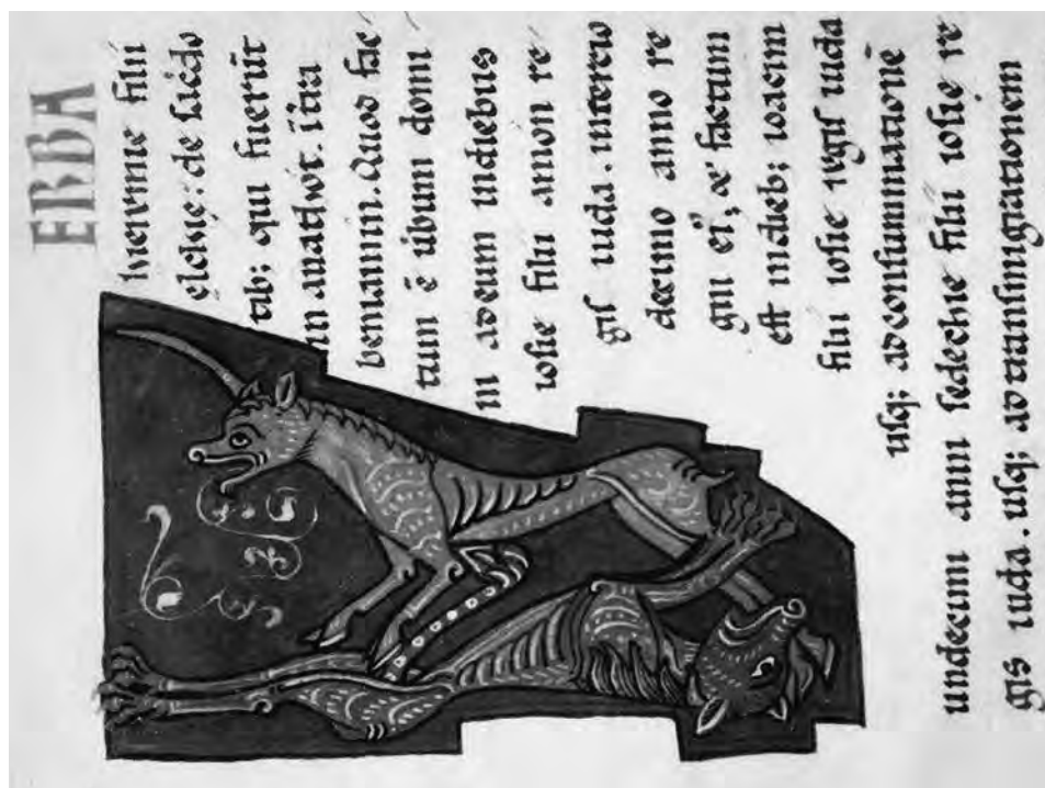
FIG. 8. Unicornio. León, Archivo de la Real Colegiata de San Isidoro, Biblia B, II, f. 95.

galería de formae bestiarum habría de entenderse absolutamente pertinente para este espacio, tan pertinente como su comprensión a partir de su participación activa en la creación de Dios 60 . Así, presente junto al ciervo, se muestra el unicornio del bordado de la catedral de Gerona, en el momento en el que Adán pone nombre a los animales recién creados 61 (Fig. 9).