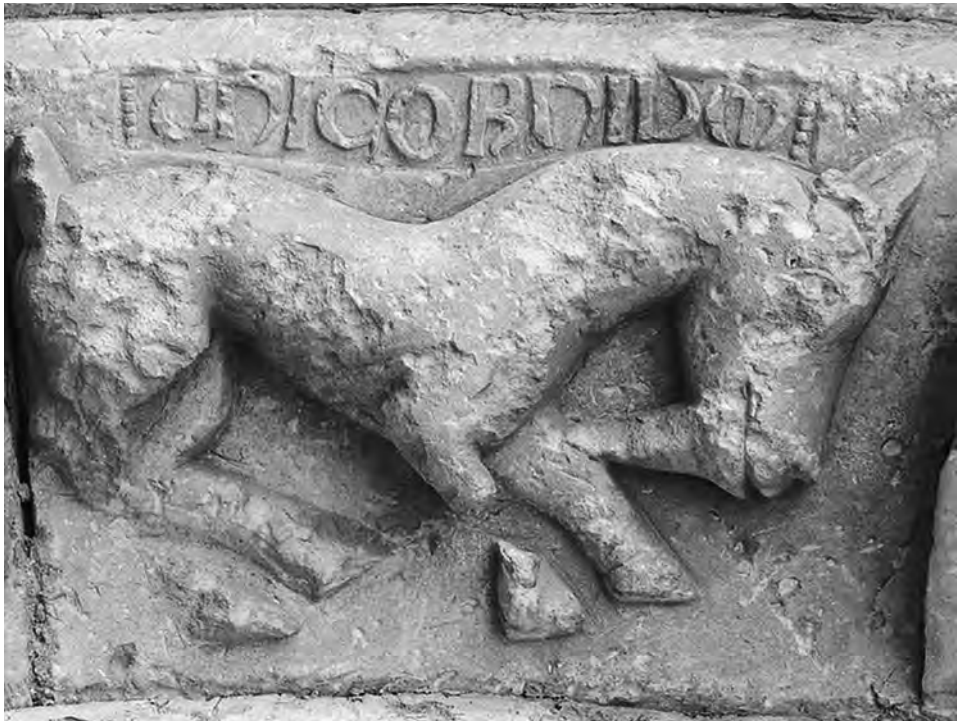
FIG. 4. Unicornio. Burgos, San Andrés de Soto de la Bureba.

El polimorfismo de la representatividad zoomórfica románica delata sus claros orígenes antiguos. Tanto para el caso burgalés como para el de León es fácil acudir a los textos de Plinio ( Historia Natural , VIII, 76: 31 y 21), como si su sola cita acreditase que la interpretación de la imagen que realizamos es verídica e indudable.