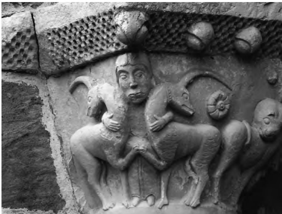
FIG. 5. Supuestos unicornios. Burgos, capilla del cementerio de Bárcena de Pienza.

Uno de los capiteles de la iglesia francesa de Saint-Pierre de Mozat (Puy-de-Dôme, Auvergne) (Fig. 6) aumenta aún más los interrogantes con respecto al tema. En una composición dominada por la simetría, una pareja de cuadrúpedos es sometida por dos personajes que los cabalgan, recordando la solución del panteón hispano, tanto en las consecuencias de ese sometimiento como en la forma del asta, muy estilizada y proyectada hacia la parte trasera del cráneo y que, por ejemplo, ya el mismo Solino había descrito bajo el término repandum para particularizar su marcada curvatura 44 .