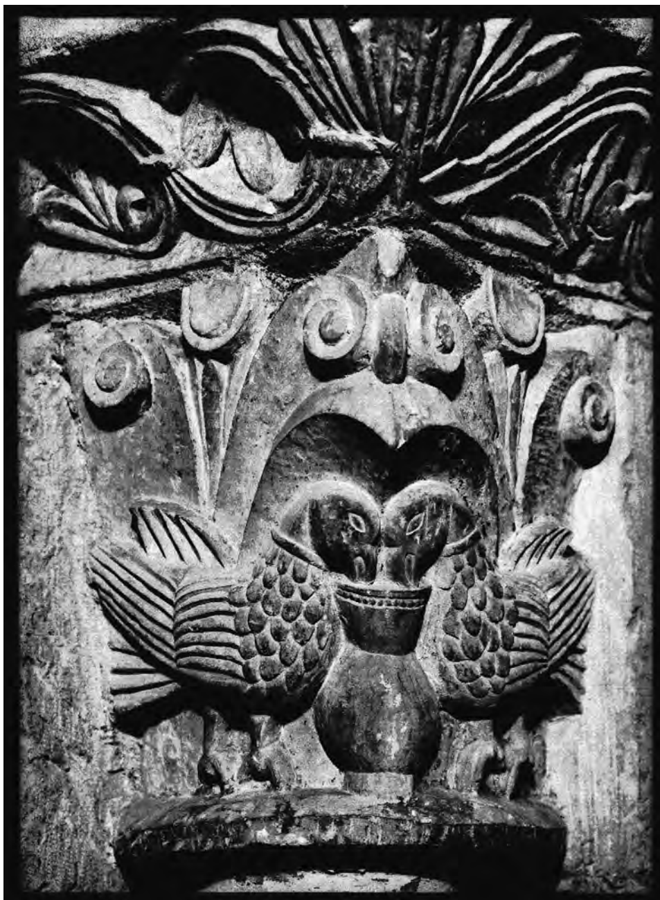
FIG. 3. Aves bebiendo de la cratera. León, panteón de San Isidoro.