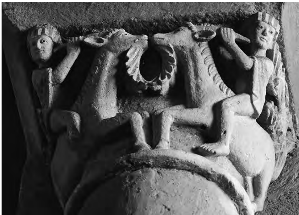
FIG. 6. Cabras sometidas . Puy-de-Dôme, Auvergne, Saint-Pierre de Mozat .

La nota destacada la ofrece la ornamentada chiva que cuelga del mentón de los animales franceses y que hace indudable su caracterización biológica 45 . En todo caso se trata de un elemento que pronto lleva a preguntarse por la naturaleza del apéndice que el cuadrúpedo de La Bureba mostraba en el mismo lugar.