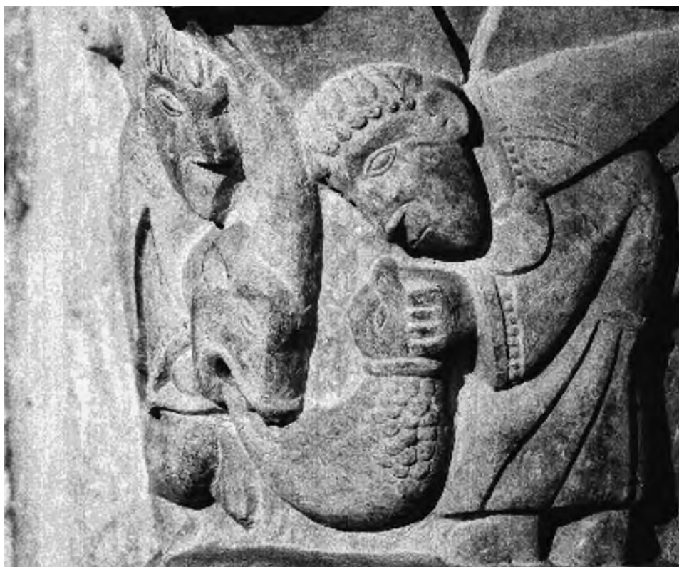
FIG. 2. Capitel del unicornio. León, panteón de San Isidoro.

Anne de Egrý, quién también se detuvo en la imagen, vio en su momento la comunión de esta representación del unicornio y la narración del Libro de Tobías , varón que enterraba a los difuntos. Dice la autora: