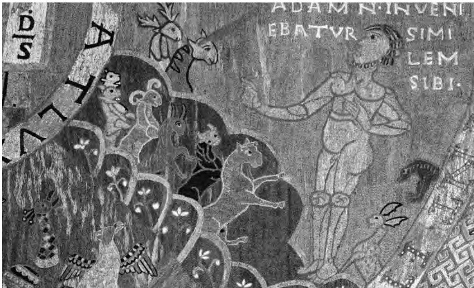
FIG. 9. Adán da nombre a los animales. Bordado de la Creación, Girona, catedral.

señaló el profesor Díaz y Díaz en su minuciosa revisión de la poesía medieval, ambos animales fueron considerados, unívocamente, como eficaces remedios contra los ofidios 62 .