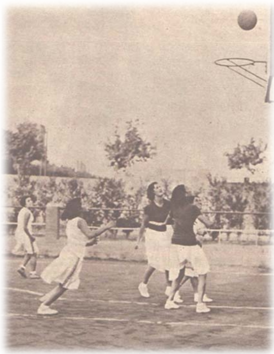
Ilustración 8: Un momento del partido jugado por los equipos del Layeta FC y el Barcelona FC.