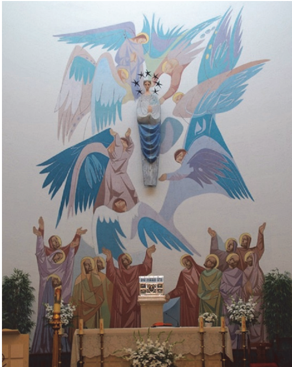
Fig. 10. Iglesia de Alberche del Caudillo (Toledo).