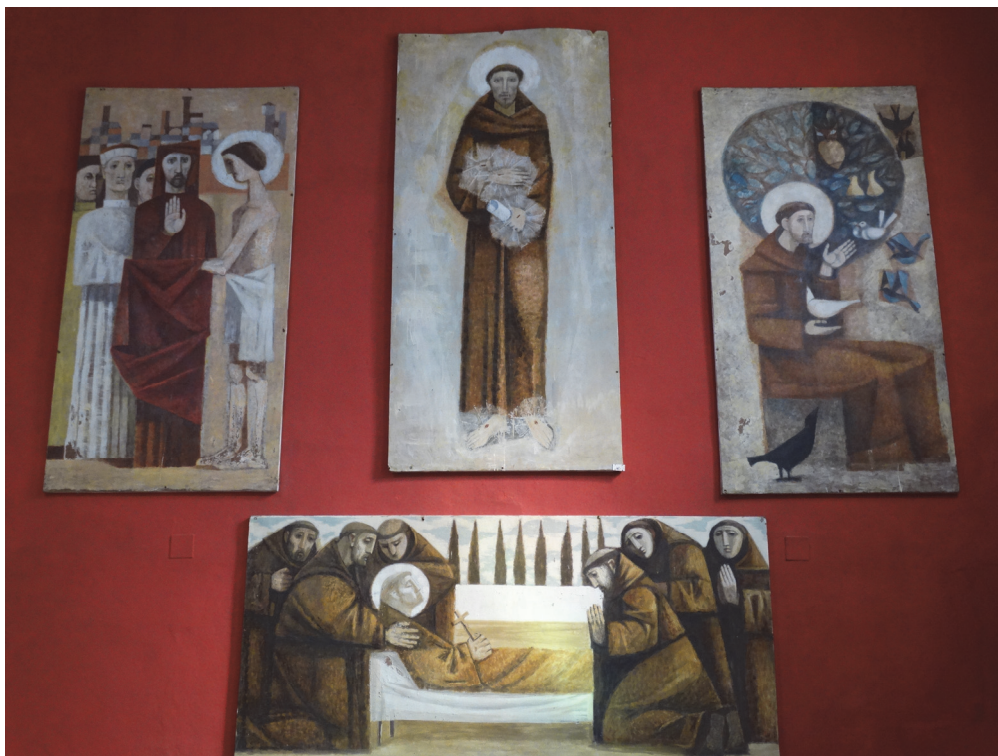
Fig. 12. Iglesia de San Francisco de Olivenza (Badajoz).

gen central del santo. En la tabla vertical San Francisco aparece como Alter Christus , mostrando los estigmas grabados en manos, pies y costado. Viste el hábito franciscano, luce tonsura y nimbo, y sujeta los Evangelios o el Libro de Reglas en forma de rollo. Su peculiaridad es que las llagas se presentan aureoladas con rayos de luz, en una fórmula muy poco usual.