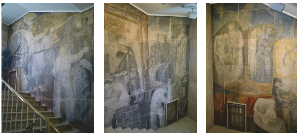
Fig. 7. Mural en la escalera de la sede del INC en Madrid.

Empecé las pinturas con una gran alegría y vitalidad; eran cuatro grandes paramentos en la escalera y no tuve tropiezos; técnicamente no hubo problemas y, como concepto, correspondía a lo que entonces hacía yo en el campo figurativo. Naturalmente no me dejaron hacer una obra de más problemas, pero yo estaba contento y apenas me sentí atado. La obra era importante y yo también empecé a sentirme importante, de otro lado el contrato era por un total de unas 100.000 pesetas, entonces mucho dinero para mí. La obra se acabó, quedé contento y se creó un buen clima en torno a mí (Rivera, 2007: 82-83). (Fig. 7)