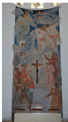
Figs. 3 y 4. Iglesias de Cilanco (Albacete) y Benagéber (Valencia).