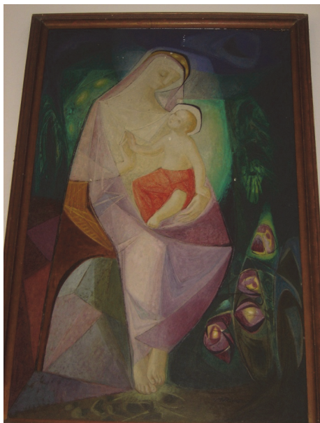
Fig. 6. Iglesia de Doñana, Cártama (Málaga)

La geometría domina de nuevo la composición, dividida por planos lineales y de color. El asiento se dispone inclinado e inestable sobre un suelo fragmentado, de manera que la Virgen apoya tan solo la punta de sus pies. El resto parece aludir a elementos vegetales, apenas sugeridos y que adquieren un tinte casi surrealista en su cualidad fluorescente. Hay que destacar la valentía