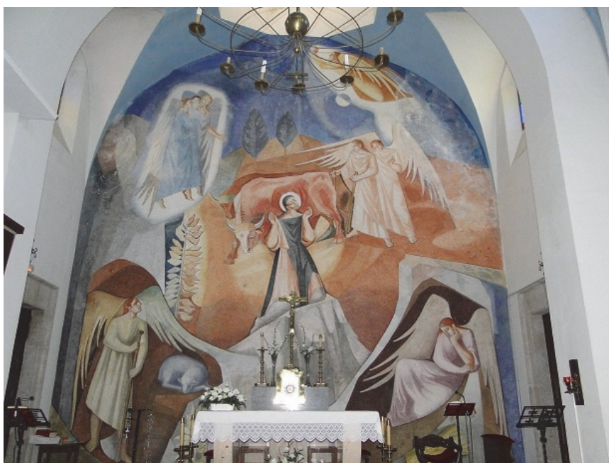
Fig. 2. Iglesia de Águeda del Caudillo (Ciudad Rodrigo, Salamanca).