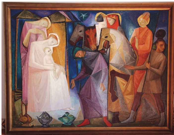
Fig. 5. Capilla de Santa Cruz de Mudela (Ciudad Real).

hace más evidente en los pliegues de las vestiduras y los aperos del caballo. Peculiares son las fisonomías de la Virgen y San José, de cierto recuerdo picassiano en su tez lánguida, con hombros rectos, cuello horizontal y cabeza inclinada, en diálogo formal con el paje oferente que centra la composición. La frialdad del azul nocturno contrasta con las gamas cromáticas del primer término y el resultado es muy colorista, más que en otros ejemplos de la época 14 (Fig. 5).