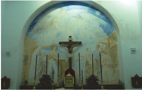
Fig. 9. Iglesia de Majarromaque-José Antonio, Jerez de la Frontera (Cádiz).

lo no cuadra dentro de la trayectoria mucho más realista y tradicional de Pagés, y un análisis detenido refleja notas de estilo propias de Rivera en el tratamiento y punteado de las alas, los rostros de perfil y los nimbos; además se cita en la entrevista de Enriqueta Antolín, confirmándolo el escultor José Luis Sánchez; y el mismo Rivera incluye en su autobiografía un mural para la provincia de Toledo, recogiendo también en su catálogo razonado.