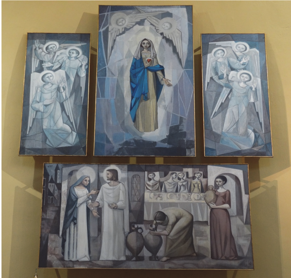
Fig. 11. Iglesia de Ruecas (Badajoz).

nunca estuvieron dichos cuadros ni se ha tenido noticia de algo similar. Pero sí consta la intervención de Rivera, quien pintó con acrílico para la misma un retablo con cuatro grandes lienzos (el inferior de 1,5 x 3 m.), que tocan dos temas principales. (Fig. 11).