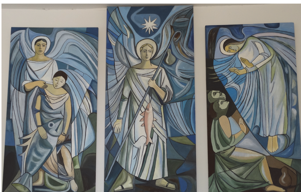
Fig. 13. Iglesia de San Rafael de Olivenza (Badajoz).

Para la pequeña iglesia de San Rafael de Olivenza , Manuel Rivera concibió tres grandes cuadros verticales sobre aglomerado 23 (Fig. 13). Domina el centro del tríptico el arcángel San Rafael, portando el bastón de peregrino y la calabaza, además del pez con el que suele asociarse su iconografía, debido a su intermediación en el conocido episodio de Tobías. Precisamente esta referencia es la que se completa en las escenas laterales. En un lado Tobías aparece junto al pez que quiso tragarle y que finalmente fue sometido, utilizando su hiel para curar la ceguera de su padre. Este momento es el que se sugiere en el panel opuesto, con las figuras unidas de padre e hijo nuevamente bajo la presencia y protección del arcángel. La factura del retablo, en una gama de colores fríos, está dominada por la linealidad y una patente segmentación de las túnicas y sobre todo las alas, en este caso con un especial dinamismo de curvas y contracurvas.