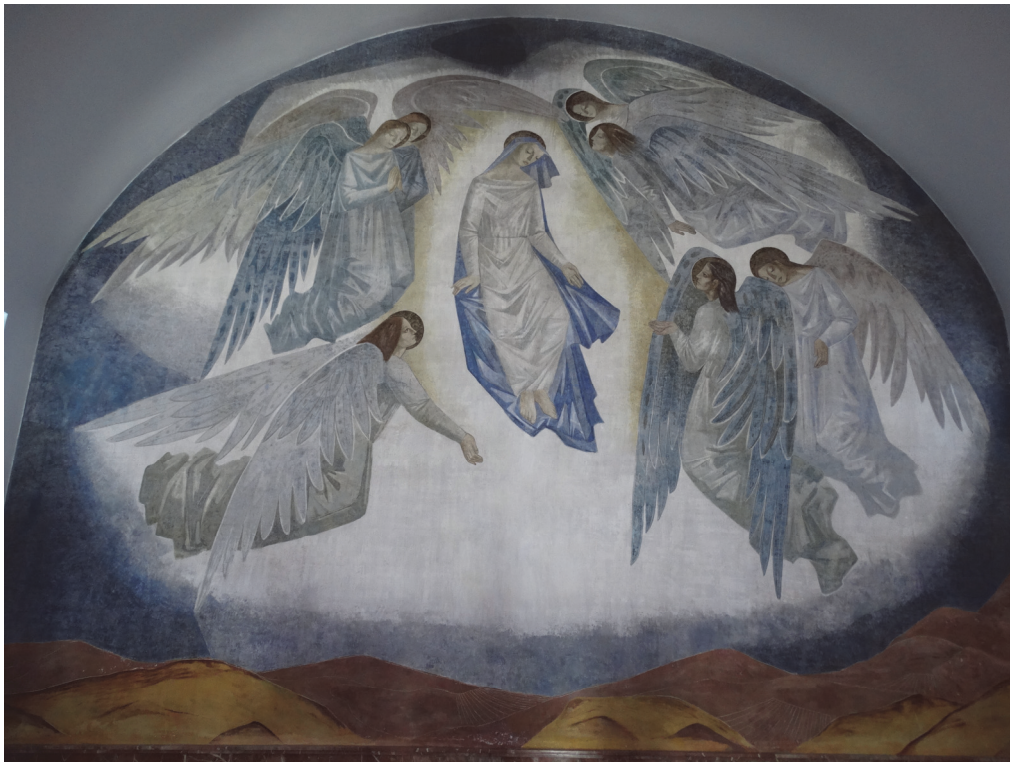
Fig. 14. Iglesia de Pueblonuevo del Guadiana (Badajoz).

azul, grisácea y fría, aunque con muchos matices, y delimitándose la zona de tierra en una franja inferior horizontal y estrecha, dominada en este caso por colores cálidos.