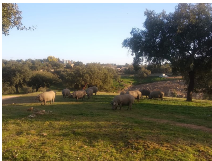
Imagen 5. Ganado porcino pastando en la dehesa