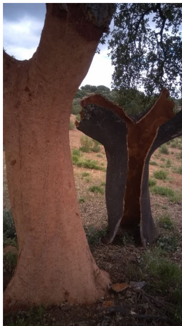
Imagen 4. Corcha extraída del alcornoque en la dehesa

En primer lugar nos vamos a remitir al aprovechamiento forestal, y es que la dehesa se caracteriza por la arboleda que tiene en su interior, que son básicamente la encina ( Quercus ilex ) y el alcornoque ( Quercus suber ). En este punto debemos hacer referencia a que el principal aprovechamiento económico desde el punto de vista forestal es el aprovechamiento del corcho, es decir, de la corteza del alcornocal, como puede verse en la imagen 4 el alcornoque nos proporciona la materia prima de la industria corcho-taponera