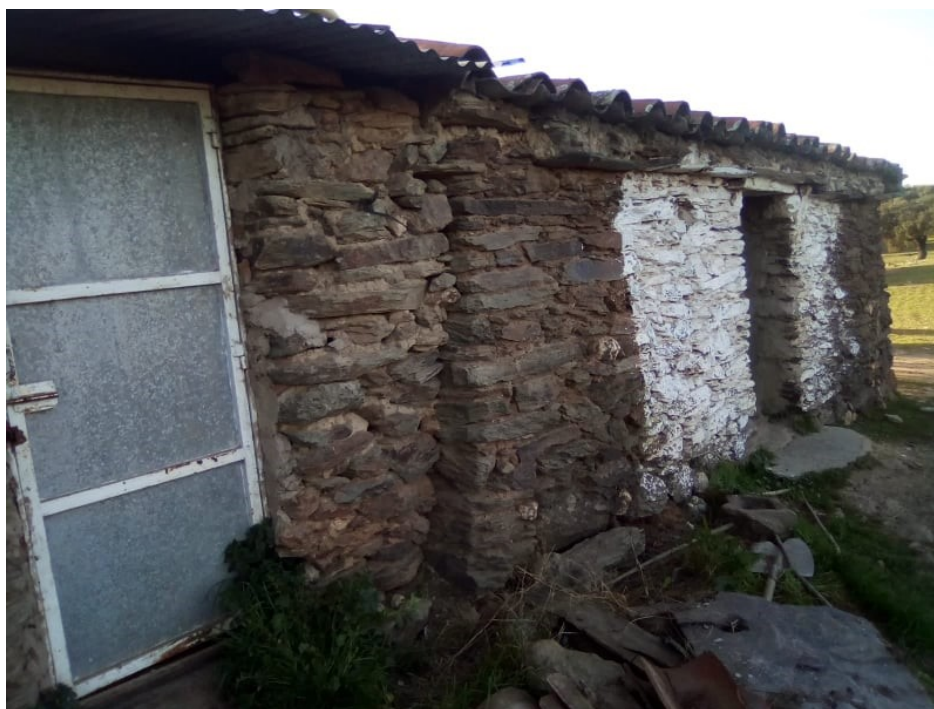
Imagen 3. Choza remodelada y aprovechada para uso actual