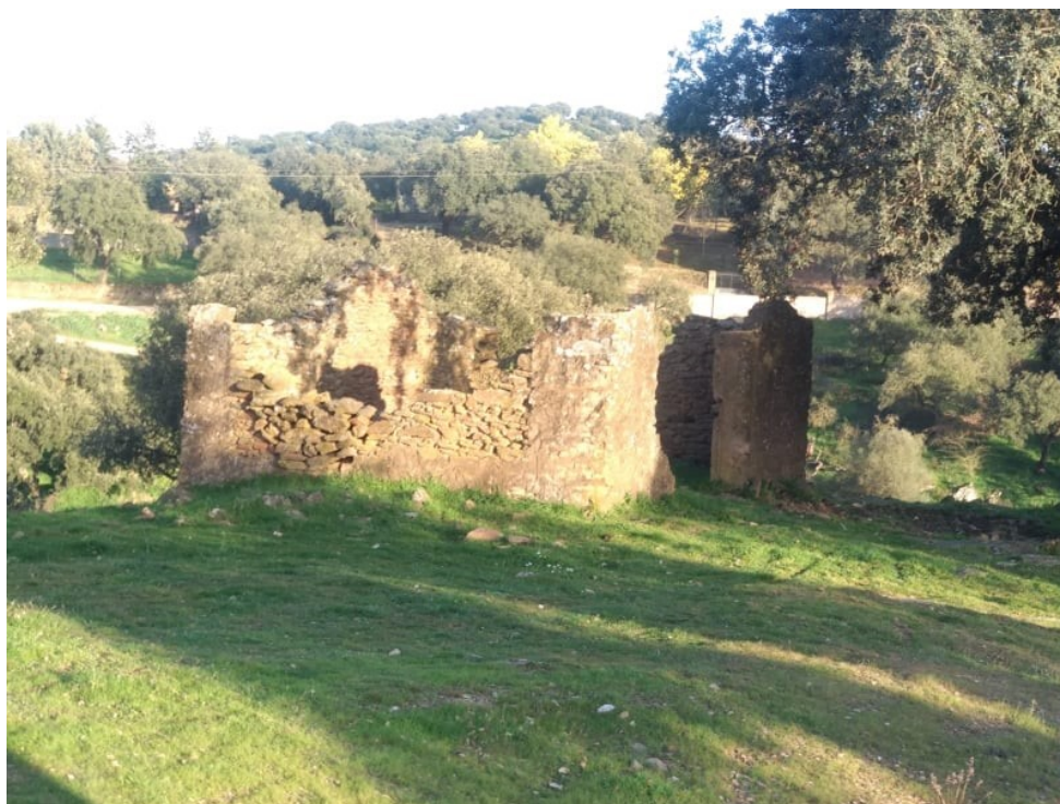
Imagen 2. Pedrizo de antigua choza