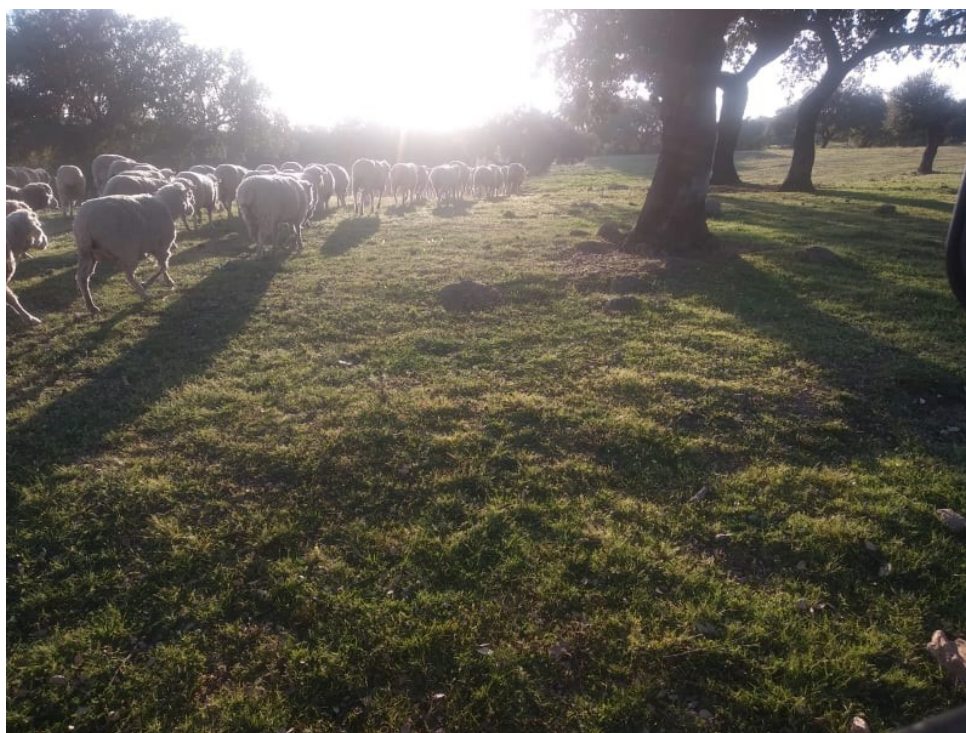
Imagen 6. Ganado ovino pastando en la dehesa