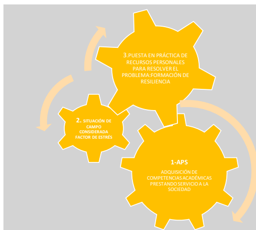
Figura 2 Aprendizaje-Servicio promotor de resiliencia Elaboración propia. Aprendizaje-Servicio: características que promueven la Resiliencia.

Me respeto a mí mismo y a los demás al tener la oportunidad de ver la realidad de otras personas y grupos sintiendo empatía y preocupación.