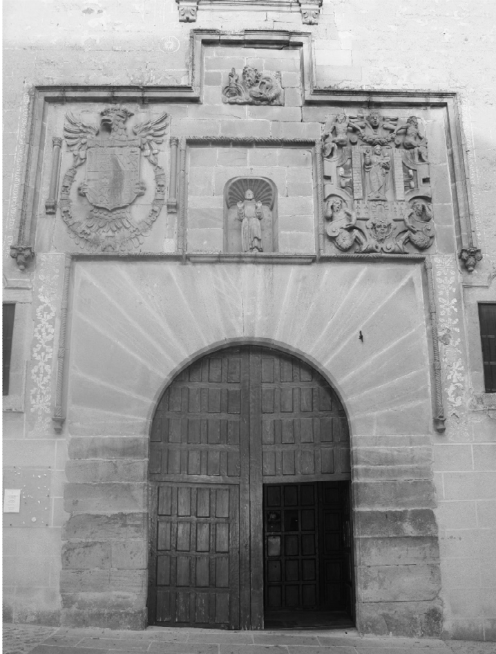
Imagen 5. Portada de la Iglesia conventual de San Francisco (Trujillo, Cáceres).

Ya hemos aludido a que los vítores se pintaban, generalmente, en lugares vistosos. El deseo de ser contemplados en público refuerza su significado propagandístico, máxime cuando se ubican en la portada de edificios religiosos relevantes para una ciudad. Era el caso de los franciscanos en Trujillo, cuya iglesia, tal y como fue descrita en el momento de ser construida, posee una “fachada de la puerta, que es hermosa y grave, [y] tiene las armas Reales, y las de la