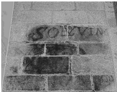
Imágenes 10 y 11. Vítor en el lado de la epístola. Iglesia de la Preciosa Sangre (Trujillo, Cáceres).