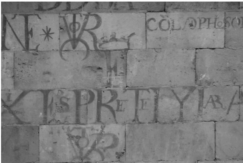
Imagen 4. Vítores en el patio de Escuelas Mayores de la Universidad de Salamanca. Nótese la simbología del vitor, con la superposición de las letras y la media luna invertida, así como la “E” coronada de la nación de Extremadura.

estudiantil 45 . Además, contaban con un símbolo propio, el vitor con una E coronada (Imagen 4).