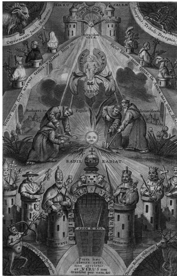
Imagen 2. Alegoría de la concepción sin mancha de la Virgen María como sol radiante en la obra Radii Solis de Pedro de Alva y Astorga (1666).

En la misma línea hay que mencionar también la obra del agustino Joannes de Leenheer, titulada “ Virgo Maria Mystica ” (1681) y enteramente dedicada a la imagen de María y su relación con el sol, cuyos emblemas se adornaban con el anagrama mariano en el centro de un sol y las palabras de San Bernardo 27 (Imagen 3).