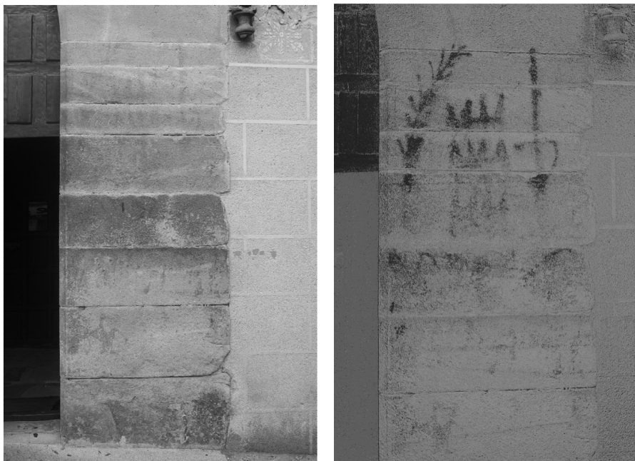
Imágenes 8 y 9. Continuación del vítor en el estribo derecho de la portada (lado de la epístola). Iglesia conventual de San Francisco (Trujillo, Cáceres).

La aparición de los símbolos del convento franciscano en sendos estribos del arco de entrada al templo no indica que se traten de elementos inconexos; más bien todo lo contrario. Ejemplos salmantinos constatan que los vítores podían repartirse por varios espacios, normalmente siguiendo la misma línea, pero sin tener en cuenta vanos u otros elementos arquitectónicos 61 . Estos rasgos lo conectarían con la tradición universitaria salmantina del vítor como elemento laudatorio.