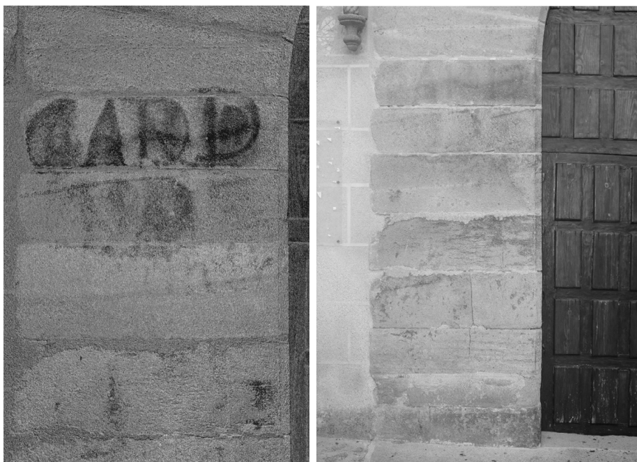
Imágenes 6 y 7. Ubicación de la primera parte del vítor en el estribo izquierdo de la portada (lado del evangelio). Iglesia conventual de San Francisco (Trujillo, Cáceres).

Ciudad” 57 . La ubicación del vítor, por tanto, no puede considerarse casual, ya que se pinta en el lugar más visible del prominente edificio 58 . Los símbolos, pintados en rojo, se sitúan en los sillares que forman los estribos del arco de acceso al templo en su fachada principal, tanto en el lado izquierdo como en el derecho. Comenzando por el lado izquierdo, se observa la primera línea del texto en el sillar inmediatamente por debajo de la línea de imposta, mientras que hay un segundo grafismo situado en el centro del siguiente sillar debajo del mencionado (Imágenes 6 y 7).