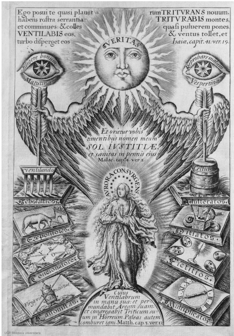
Imagen 1. Inmaculada como Sol iustitiae según la obra de Pedro de Alva y Astorga titulada Sol Veritatis (1660). Universidad de Granada ( http://digi.ugr.es/handle/10481/5181 ).