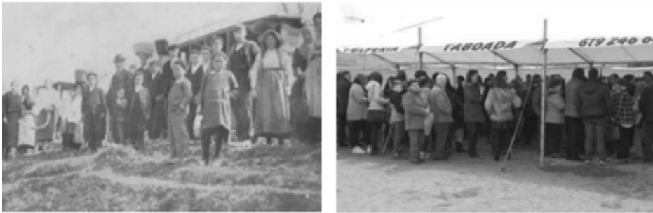
Imagen 3. Romeros de Fray Pedro en los años 1925 36 y 2016 37 .

Aunque el número de romeros no iba a alcanzar ni por asomo las cantidades de épocas anteriores (Imagen 3), considerando Manuel Fiaño y Aurora Santos que este espectáculo alcanzó su cénit durante el longevo gobierno de D. Germán Castelos (1925-1986) 34 al imprimirle éste un toque especial y una sobresaliente atención y dedicación; la romería seguía teniendo sus fieles (cada vez de mayor edad) y la revista mantenía testimonio de ello; siendo también la asistencia de personas a este acontecimiento una justificación más para una antigua petición de la asociación de vecinos ante el arzobispado: la cesión de terrenos eclesiásticos para la construcción de un aparcamiento público al lado de la iglesia 35 , demanda que fue finalmente atendida.