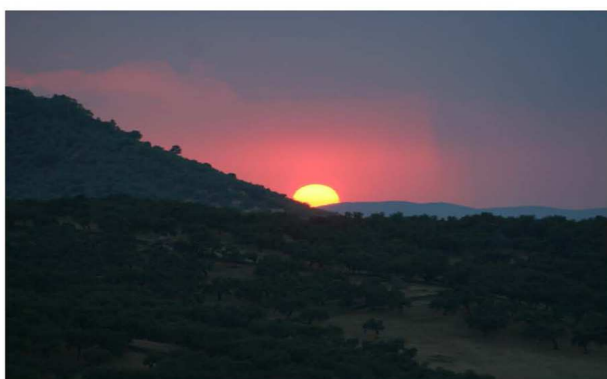
FIG. 1: Atardecer en el monumento natural Cuevas de Fuentes de León

Fuentes de León es uno de esos escasos lugares donde se aúnan paisaje e historia en íntima comunión. El visitante que recale por estas tierras se encontrará con un bello entorno natural prácticamente inalterado de indudable valor ecológico y medioambiental que sirve de contexto a un patrimonio histórico, artístico y arqueológico que recorre todos los períodos de nuestro pasado, desde las más antiguas ocupaciones paleolíticas hasta las arquitecturas militares de época medieval. Un conjunto patrimonial imprescindible que está situando a Fuentes de León como uno de los principales destinos para el turismo cultural y medioambiental de Extremadura.