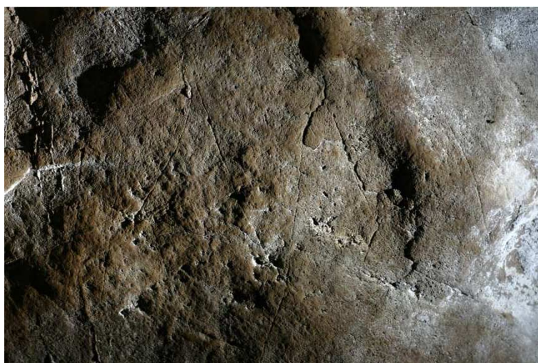
FIG. 2. Grabados incisos de la Cueva del Agua.

Por tanto, inicialmente fue prospectado el territorio para localizar cuevas. Gracias a estos trabajos fueron estudiadas cinco cuevas (Cueva del Agua, Cueva de los Postes, Cueva de los Caballos, Cueva de la Lamparilla y Cueva Masero) y dos simas (Sima I y Sima Cochinos). Tras su localización fueron topografiadas y revisadas detenidamente para tratar de constatar la existencia de representaciones de arte rupestre sobre sus paredes o de restos arqueológicos que indicaran la presencia de ocupaciones humanas prehistóricas en el interior de las mismas. Como resultado únicamente se pudo constatar la presencia de un panel con grabados rupestres en forma de zigzag a la entrada de la Cueva del Agua y restos arqueológicos en la Cueva de los Postes, en la Cueva de los Caballos y en la Cueva del Agua.