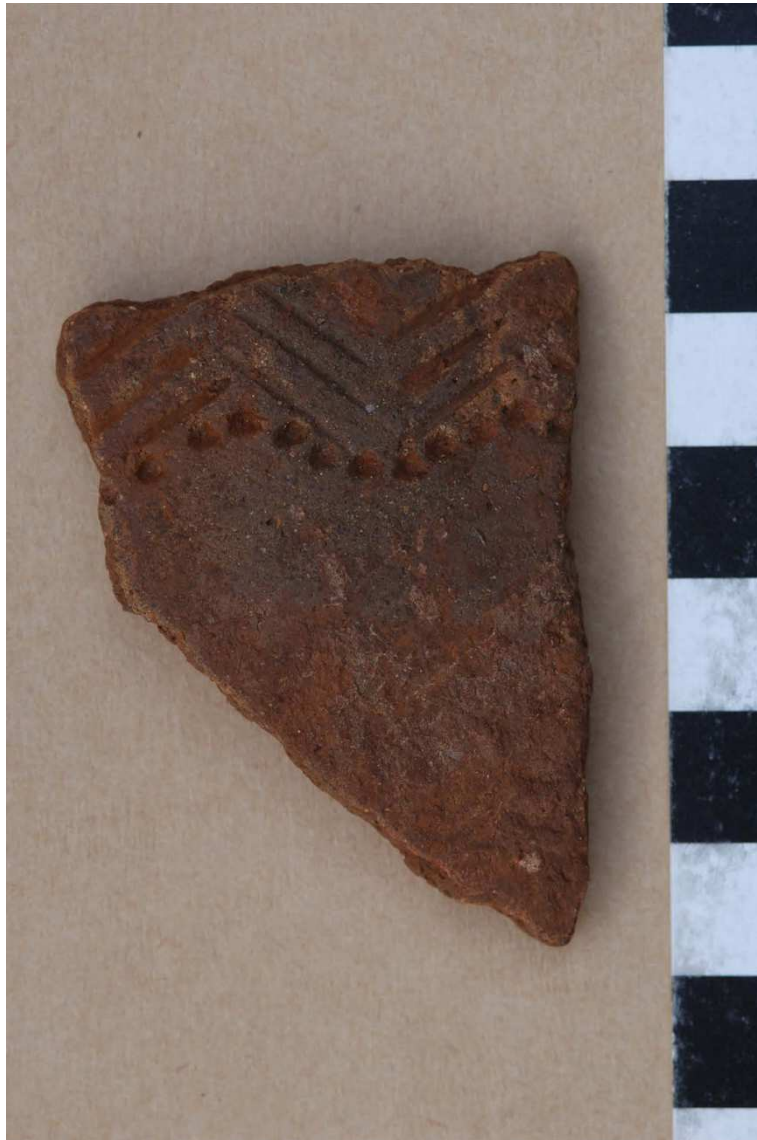
FIG. 7. Cerámica decorada. Neolítico medio-final