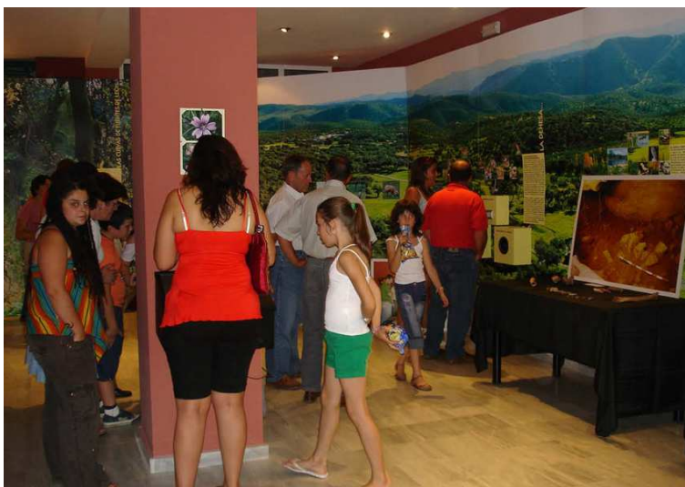
FIG. 12. Centro de interpretación de la Naturaleza. Fuentes de León.

La segunda de las estrategias, coordinada fundamentalmente por la Dirección General de Patrimonio Cultural de la Consejería de Educación y Cultura del Gobierno de Extremadura en colaboración con el Ayuntamiento de Fuentes de León, ha priorizado la difusión de la investigación científica que se realiza en las cavidades hacia la sociedad en general, con una especial insistencia en la población local. Para ello se han organizado sistemáticamente jornadas explicativas y de puertas abiertas durante los periodos en los que se realizaban las campañas de excavación arqueológica. Se han potenciado igualmente los talleres didácticos sobre la vida y las costumbres de las sociedades prehistóricas destinados fundamentalmente a grupos familiares y a visitas escolares. Se han diseñado y exhibido varias exposiciones temáticas centradas sobre los resultados de la investigación en las cuevas de Fuentes de León y se han organizado en la propia localidad varias jornadas, congresos y reuniones científicas en donde los diversos investigadores implicados en el estudio de las cuevas de Fuentes de León han ofrecido sus conocimientos y resultados a la población local, además de colaborar sistemáticamente y facilitar contenidos a los medios de comunicación y redes sociales locales y comarcales.