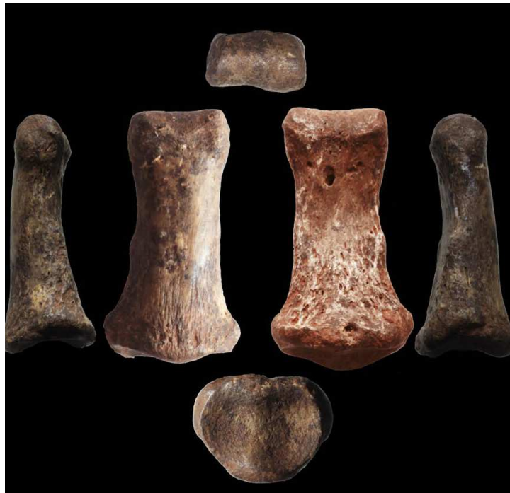
FIG. 10. Falange humana de contexto pleistocénico.