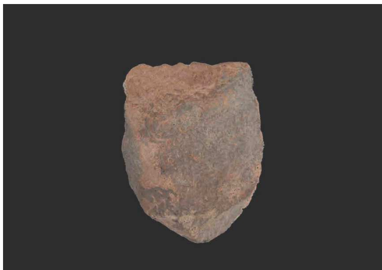
FIG. 9. Instrumento lítico. Fase 3 Cueva de los Postes