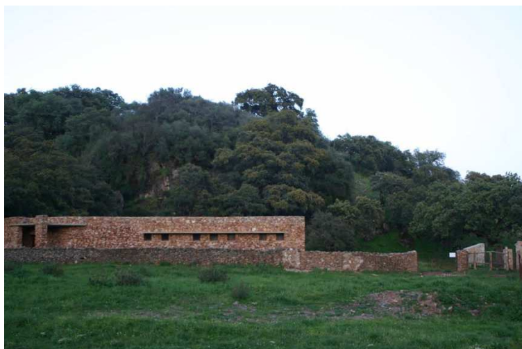
FIG. 11. Centro de recepción de visitantes en el monumento natural Cuevas de Fuentes de León.

En relación con este espacio natural fue creado en la misma población de Fuentes de León el Centro de Interpretación de la Naturaleza, que integra una exposición museográfica permanente en la que el visitante toma conciencia de la riqueza y biodiversidad del entorno natural que le rodea además de servir de antesala y preparación para la visita a las cavidades y un albergue de investigadores donde se alojan temporalmente todos los científicos y alumnos que realizan trabajos de investigación relacionados con el conjunto de cavidades. Además junto a la entrada de las cavidades acondicionadas para la visita, se han construido el Centro de Recepción desde donde parten las visitas guiadas a las diferentes cuevas y se ofrece información arqueológica, ambiental y geológica mediante maquetas y paneles explicativos.