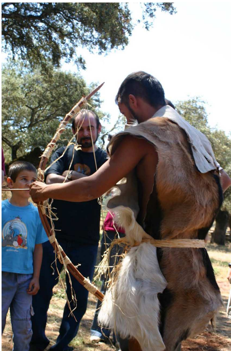
Fig. 13. Jornadas didácticas para niños con recreaciones en el monumento natural Cuevas de Fuentes de León.