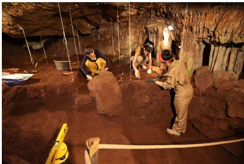
FIG. 5. Excavación en la Cueva de los Postes

Etapa 1: Abarca las cuatro primeras unidades estratigráficas con una potencia sedimentaria de unos 40 cm, muy afectadas por todo tipo de remociones, tanto de origen antrópico (excavaciones clandestinas, regularizaciones de la superficie para uso ganadero), como animal (madrigueras). Ello ha provocado una mezcla de los contextos y consecuentemente del material arqueológico en el que se ha reconocido la presencia de cerámicas bizcochadas y vidriadas de cronología moderno contemporáneas que nos remiten a ocupaciones esporádicas de la cueva como refugio y estabulación de ganado. Destaca en este primer paquete una notable presencia de material de cronología romana (lucernas, vasos de sigilata, terracotas, monedas), junto con objetos de tradición indígena (vasos calados, fusayolas, ollas globulares de borde vuelto con decoración pintada a base de bandas rojas, vasitos y copas a mano con decoración incisa) que nos remiten de forma muy directa a los conjuntos artefactuales documentados en las excavaciones del cercano castro de Capote en Higuera la Real (Badajoz) (Berrocal, 1992; 1994; 1998) y que señalan una ocupación efec-