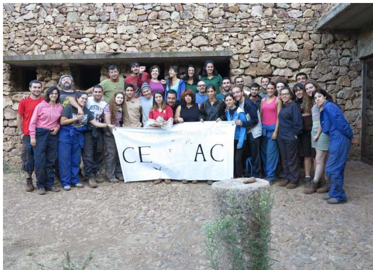
FIG. 15. Participantes en el Campo Internacional de Arqueología Cuevas de Fuentes de León 2014.

Finalmente debemos destacar también el apartado formativo que desarrolla este proyecto, dando lugar a que numerosos trabajos de investigación de grado o posgrado de alumnos de diversas universidades españolas o extranjeras hayan abordado aspectos relativos a la investigación arqueológica o paleoambiental desarrollada en las cuevas de Fuentes de León o hayan recibido formación en metodología de excavación arqueológica de cavidades gracias fundamentalmente a la colaboración con el Instituto de la Juventud de Extremadura que ha hecho posible la celebración de Campos de Trabajo Internacionales en el Monumento Natural “Cuevas de Fuentes de León”.