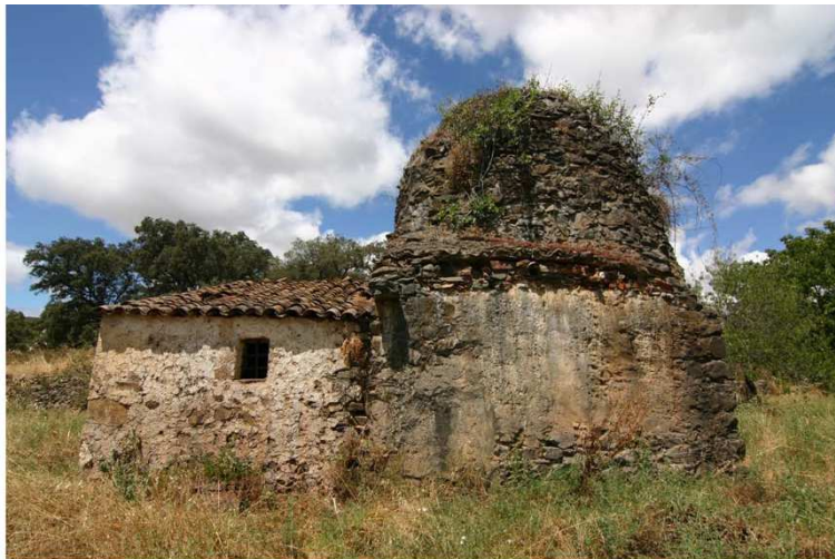
FIG. 3. Molino harinero en la rivera de Santa Cruz. Fuentes de León

La etapa musulmana y medieval también tiene una magnífica representación en los restos conservados del Castillo del Cuerno que pueden conocerse en el marco de las visitas ofertadas dentro del Monumento Natural, junto a la arquitectura religiosa de la villa y el magnífico conjunto de fuentes y molinos medievales conservados en los alrededores de Fuentes de León.