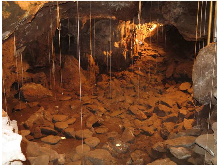
FIG. 4. Excavación en la Cueva de los Caballos

Los Postes es una pequeña cavidad de unos 180 m 2 de superficie, estructurada en dos salas principales separadas por una alineación de estalactitas y columnas. Esta peculiar distribución ha marcado el proceso de excavación en la que se han establecido dos zonas de intervención. La primera en la sala de acceso, a la derecha del corredor de entrada donde se ha excavado una superficie de aproximadamente 20 m 2 , y la segunda, en la sala del fondo, donde se está excavando una superficie aproximada de 6 m 2 .