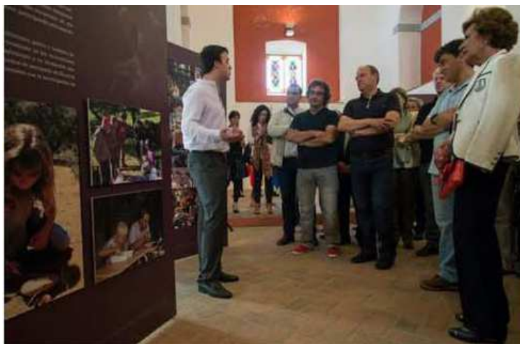
FIG. 14. Inauguración exposición “14 años de Arqueología en las Cuevas de Fuentes de León”.

Pero sin lugar a dudas, ha sido la integración directa en los trabajos de investigación de los jóvenes de la propia localidad y de los responsables de la vigilancia y las visitas guiadas a las cuevas una de las acciones cuyos resultados han sido más provechosos. En primer lugar porque de este modo los visitantes a las cuevas reciben sistemáticamente una información actualizada y veraz sobre los resultados de la investigación que en ellas se llevan a cabo, ya que tanto los guías, como los responsables turísticos se incorporan activamente a todas las campañas de excavación y forman parte fundamental de las mismas. De igual modo, jóvenes de la propia localidad de Fuentes de León, han crecido colaborando año tras año en los trabajos de excavación desde su etapa formativa en los institutos de enseñanza secundaria. Pasados los años, algunos de ellos se encuentran realizando sus carreras vinculadas directamente con aspectos relacionados con la arqueología y/o el medioambiente y realizan trabajos de master, posgrado o doctorado especializados en algunas materias específicas relativas a la investigación desarrollada en el marco del proyecto de investigación “ORÍGENES” y por su juventud y formación, suponen una garantía de continuidad para el futuro de este proyecto de investigación.