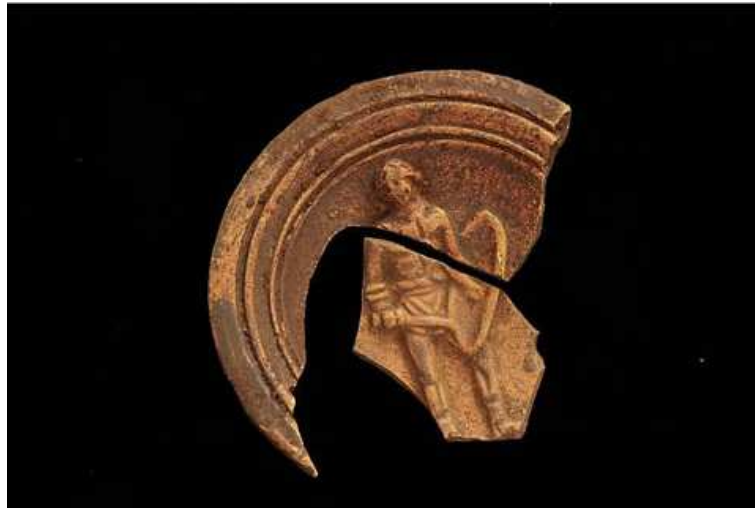
FIG. 6. Lucerna romana decorada con figura de gladiador.

tiva de la Cueva de los Postes 1 en época romana, en torno al cambio de era, con posibles ocupaciones previas de carácter indígena. Una ocupación claramente vinculada a aspectos rituales de origen indígena, sincretizados tras la ocupación romana, donde las cuevas se utilizarían como espacios culturales en donde eran depositadas ofrendas materializadas en los objetos recopilados en el proceso de excavación.