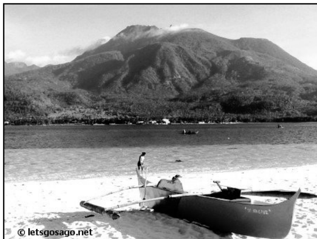
IMAGEN 5. ISLA DE CAMIGUIN, EN DONDE ENCONTRÓ LA MUERTE EL PADRE FRAY FRANCISCO DE SANTA TEODORA