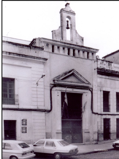
IMAGEN 1. CAPILLA DEL ANTIGUO CONVENTO DE NUESTRA SEÑORA DE GRACIA DE DON BENITO