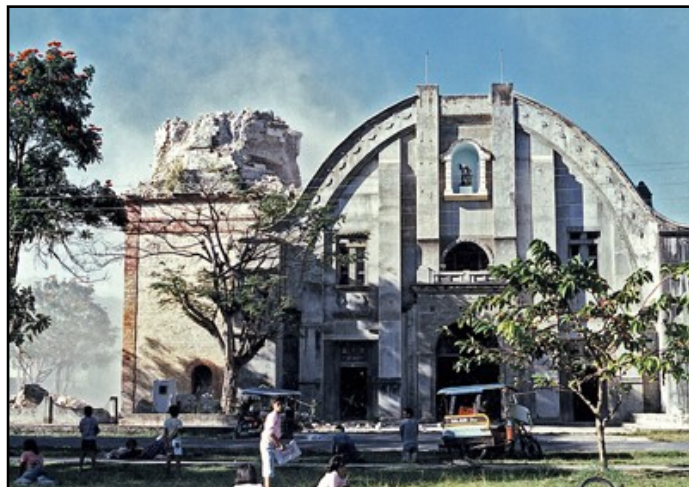
IMAGEN 3. IMAGEN DE LA IGLESIA DE JAGNA, QUE MANTIENE LA ESTRUCTURA CONSTRUIDA POR FRAY BLAS DE LAS MERCEDES Y EN CUYO CAMPANARIO PUEDEN APRECIARSE LOS EFECTOS DEL TERREMOTO DE 1990