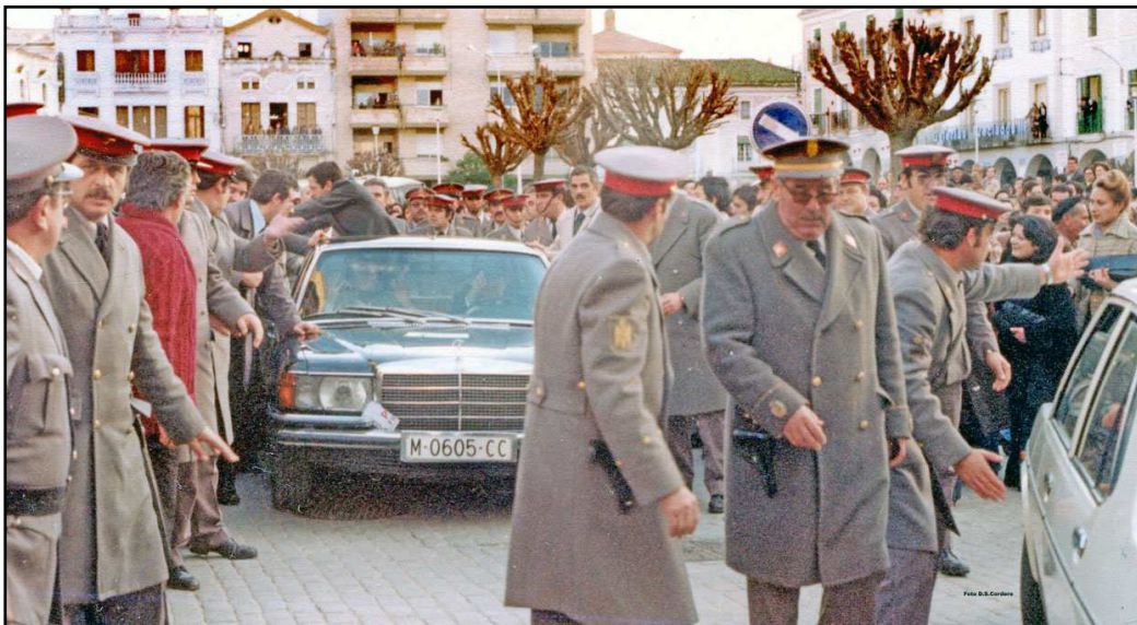
IMAGEN 1. MOMENTO DE LA VISITA DE ADOLFO SUAREZ A DON BENITO EN EL AÑO 1978