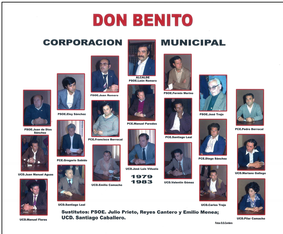
IMAGEN 9. CORPORACION MUNICIPAL FORMADA POR CONCEJALES DEL PSOE, PCE Y UCD. CORPORACIÓN ELEGIDA EN LAS PRIMERAS ELECCIONES DEMOCRÁTICAS MUNICIPALES DE DON BENITO DEL 12 DE MARZO DE 1979.