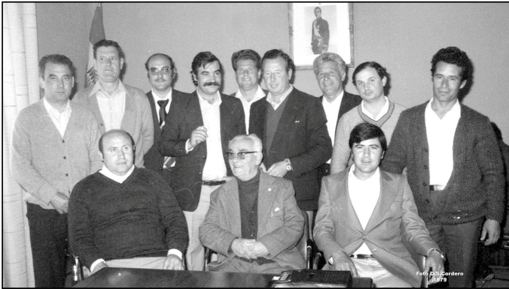
IMAGEN 2. CONCEJALES DEL PCE Y PSOE SALIDOS EN LAS ELECCIONES MUNICIPALES DEMOCRATICAS DEL AÑO 1979