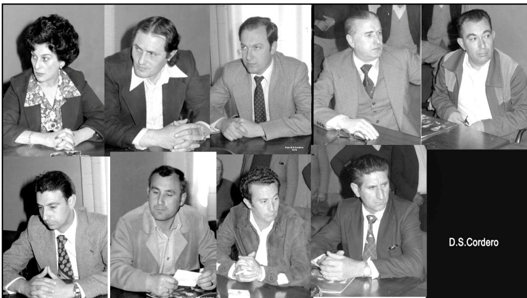
IMAGEN 3. CONCEJALES DE UCD SALIDOS EN LAS ELECCIONES MUNICIPALES DEMOCRATICAS DEL AÑO 1979