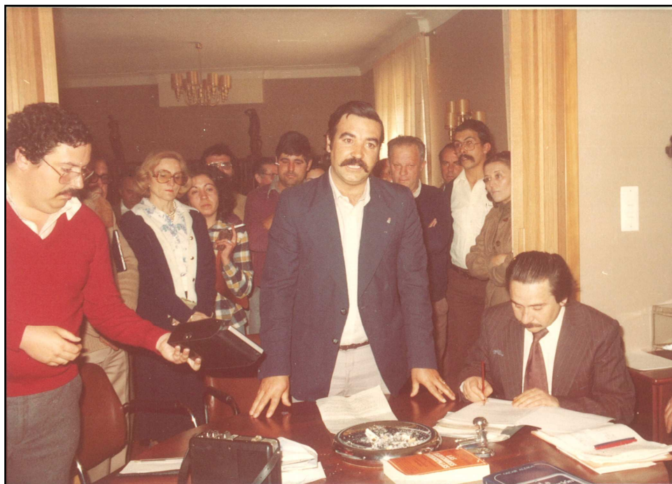
IMAGEN 6. MOMENTO DEL DIA DE LA TOMA DE POSESION COMO ALCALDE DE DON BENITO (I)