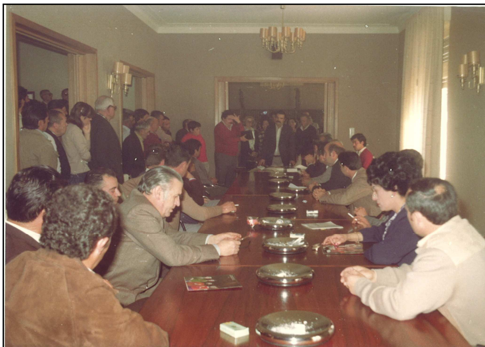
IMAGEN 7. MOMENTO DEL DIA DE LA TOMA DE POSESION COMO ALCALDE DE DON BENITO (II)