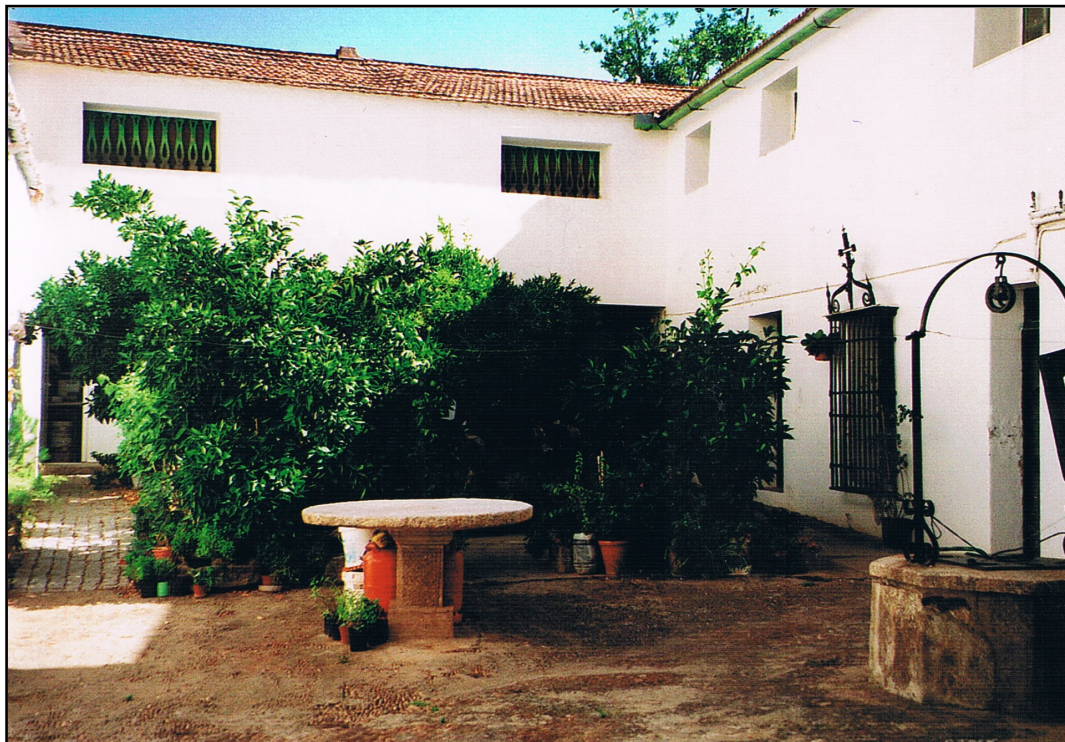
IMAGEN 8. PATIO DE UNA CASA DOMBENITENSE CON POZO PARTICULAR

hará en la forma que acuerde el Ayuntamiento, estableciéndose un fondo suficiente para su subsistencia y formándose con ese objeto un padrón de los que sean realmente mendigos».