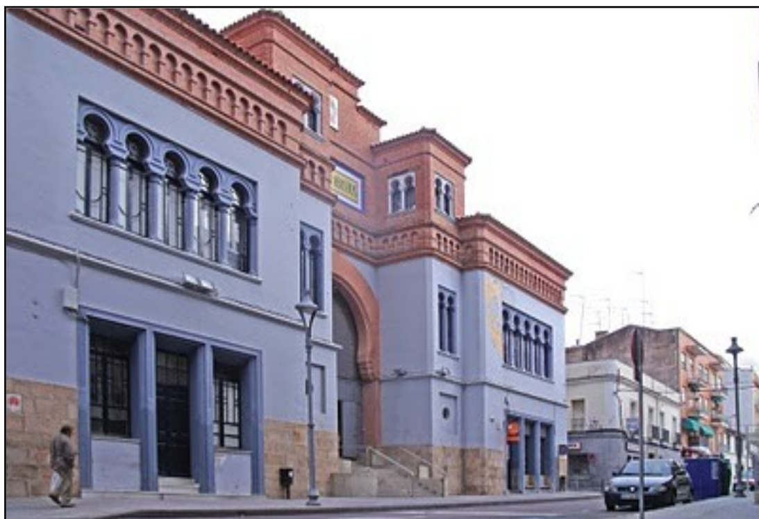
IMAGEN 9. FACHADA ACTUAL DEL MERCADO DE ABASTOS DE DON BENITO, INAUGURADO EN 1930 Y UBICADO EN LA ACTUAL CALLE VILLANUEVA