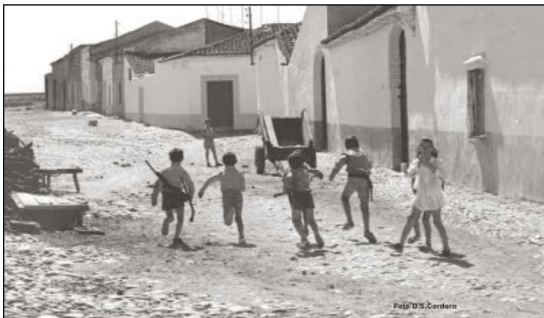
IMAGEN 10. NIÑOS JUGANDO EN LA CALLE ZALAMEA DE DON BENITO (DÉCADA DE 1970)