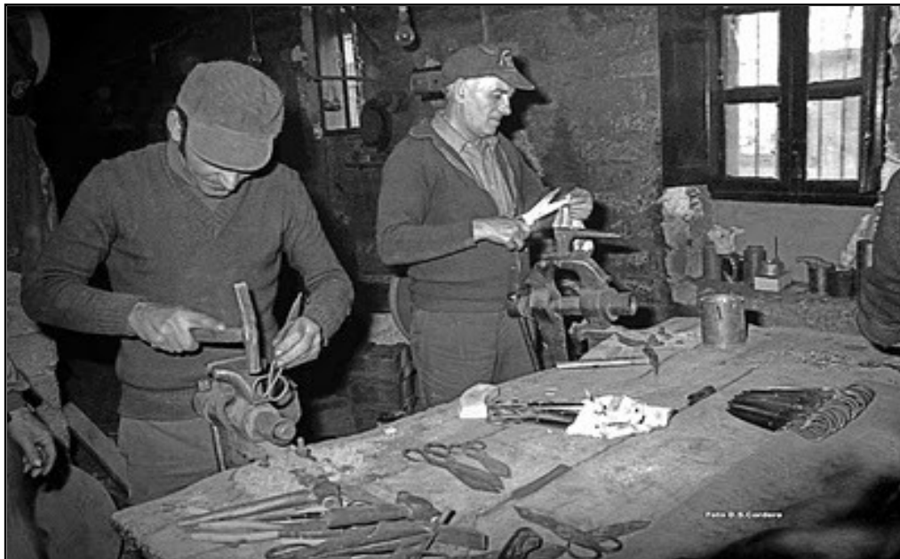
IMAGEN 6. TALLER DE CUCHILLERÍA CERRADO A FINALES DEL SIGLO XX (Situado en la actual Plaza de Extremadura de Don Benito)