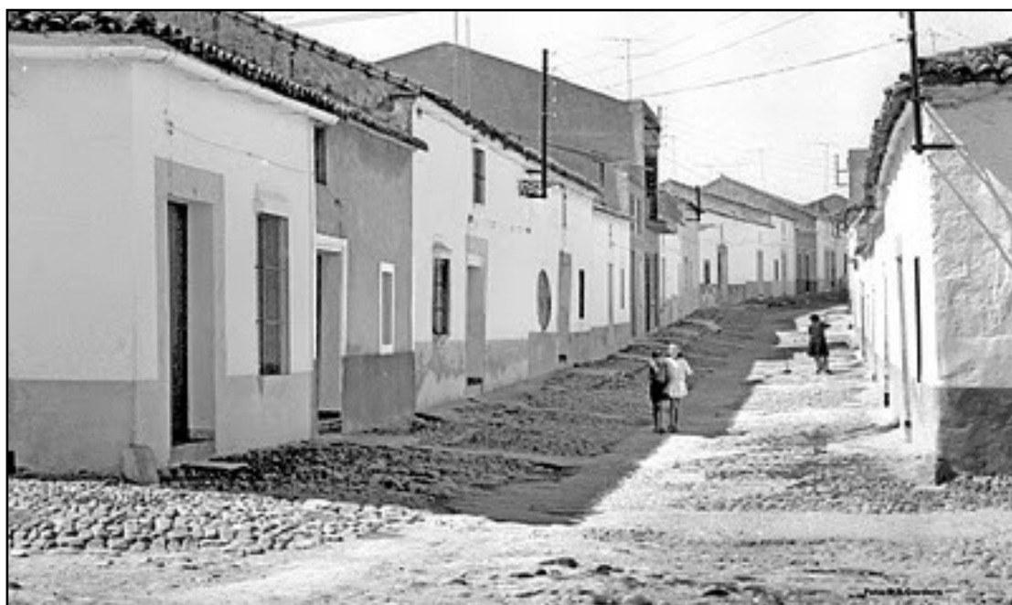
IMAGEN 3. CALLE PEDRERA EN LA SEGUNDA MITAD DEL SIGLO XX