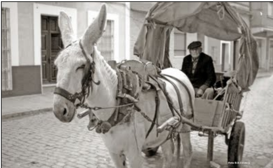
IMAGEN 7. CARRO TIRADO POR UN BURRO EN LA SEGUNDA MITAD DEL SIGLO XX