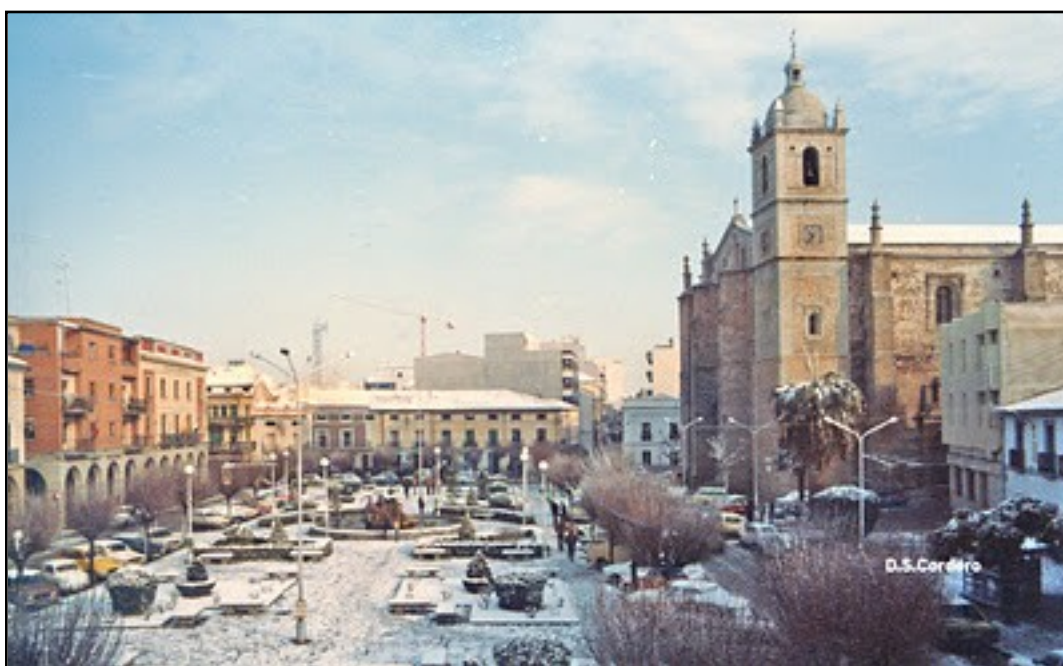
IMAGEN 4. VISTA DE LA PLAZA DE ESPAÑA DE DON BENITO