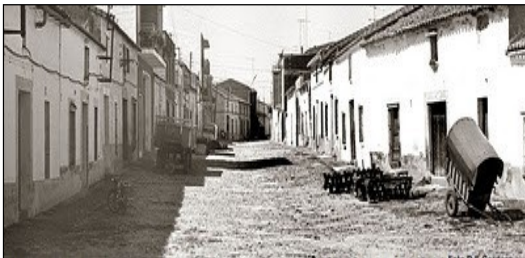
IMAGEN 5. VISTA DE LA CALLE PALOMAR EN LA SEGUNDA MITAD DEL SIGLO XX