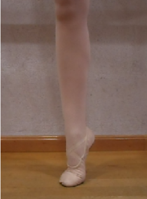
Figura 1. Correcta posición de relevé

Lo más frecuente, es que se produzca durante la reproducción de algún giro o pirouette , que deben hacerse en relevé (figura 1) ya sea a media punta o a punta, o en la recepción o caída de algún salto, donde se realiza una triple flexión de miembros inferiores. Ésta debe ser amortiguada y elástica, ya que si se cae de forma brusca, se provoca lesión (figura 2).