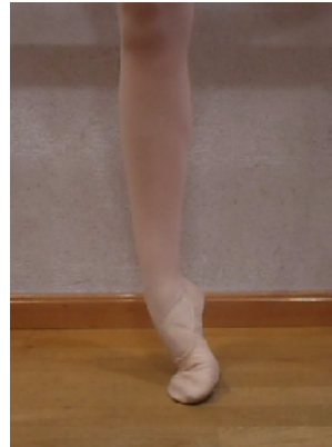
Figura 2. Posible esguince de tobillo

El motivo más común de lesión, suele ser una debilidad de los músculos del tobillo (Tixa, 2006). Para prevenir esta lesión, es necesario concienciar al docente y al bailarín en usar la técnica correctamente, y si no fuera suficiente, se elaborará una tabla de ejercicios para que fortalezcan los músculos que más se afectan, intentando evitar estas lesiones.