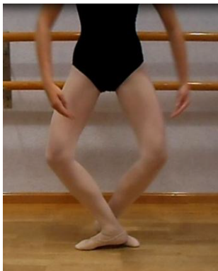
Figura 3. Despegue