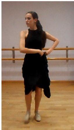
Figura 7. Fase del zapateado