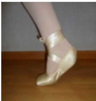
Figura 6. Trabajo de los tres cuartos de pointé

También puede ser causada por una falta de trabajo de los tres cuartos de pointé (figura 6), e incluso por el uso de una zapatilla no adecuada.