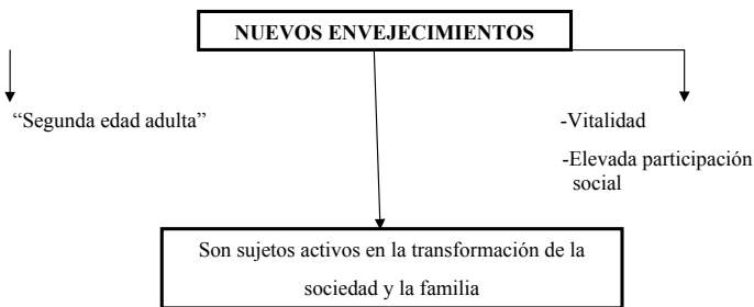
Fig.4.Nuevos envejecimientos. A partir de Bateson, M.C. (2011)

Tema: La longevidad es un triunfo histórico, porque nos ofrece: Ponente: Aportación teórica sobre el “Envejecimiento activo”