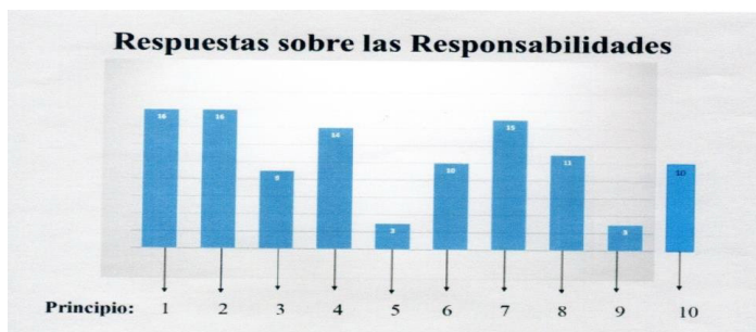
Fig.4. Respuestas positivas a cada principio.

El resto, cuando la pandemia nos lo permita lo pondremos en práctica y podremos observar estudiar el proceso siguiendo el método DAFO en qué momento estamos y hacia dónde dirigir nuestras actividades.