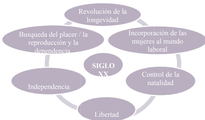
Fig.2. Aportaciones del siglo XX. Elaborado a partir de Freixas (2006)

Pero estos logros no han supuesto la desaparición de estereotipos y acepciones sociales con un carácter negativo sobre el progreso del S.XX, como por ejemplo la cosificación de la mujer observada desde su “yo físico” desde fuera o, el “edadismo” con aquello de “pero si...ya” también la pérdida del “ser femenino” por la menopausia y algo que a menudo nos encontramos, el desconocimiento del mundo sanitario sobre la vida de las mujeres que asocian sus problemas físicos a la “ansiedad + hipocondría”. Todo ello condiciona a cierto número de ellas, a “hacerse pasar” por más joven y no asumir que envejecer es una nueva oportunidad.