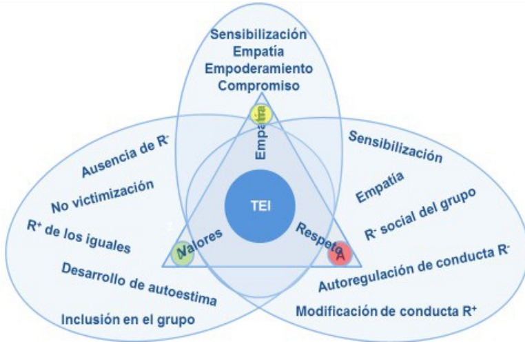
Ilustración: Esquema del autor 2002 – 2014

El Programa implica al 100% del alumnado de los cursos que lo tienen implantado, tanto en Primaria como en Secundaria. Este planteamiento hace que el Programa TEI sea actualmente el único, a nivel mundial, que en dos años implica a todo el alumnado de Secundaria, de Educación Infantil y de los dos últimos ciclos de Primaria. Todos los alumnos y alumnas participan, ayudan y son ayudados, que es uno de los objetivos básicos del TEI: la INCLUSIÓN.