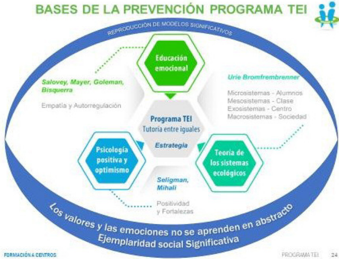
Ilustración: Esquema del autor 2002, 2014 y 2018