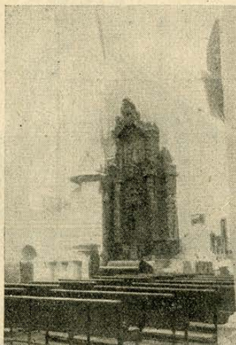
Altar del Sagrario en la iglesia del Colegio