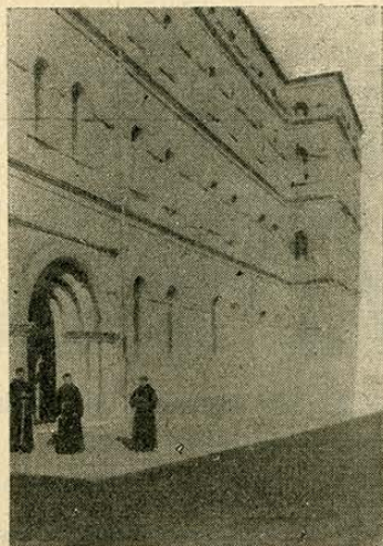
Fachada principal del Colegio