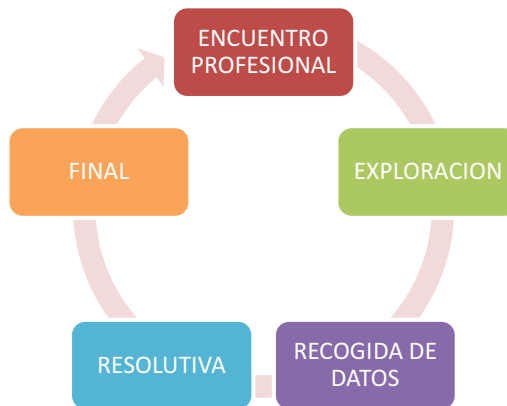
Figura 1. Elaboración propia

Una posible forma de estructura sería la así: