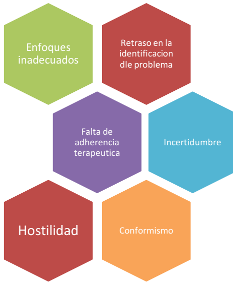
Fig .5 elaboración propia