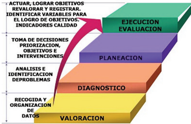
Figura 2. http://procesoenfermero-a216info.blogspot.com/2016/04/introduccion.html

A partir de aquí la enfermera establecer su propio plan de cuidados