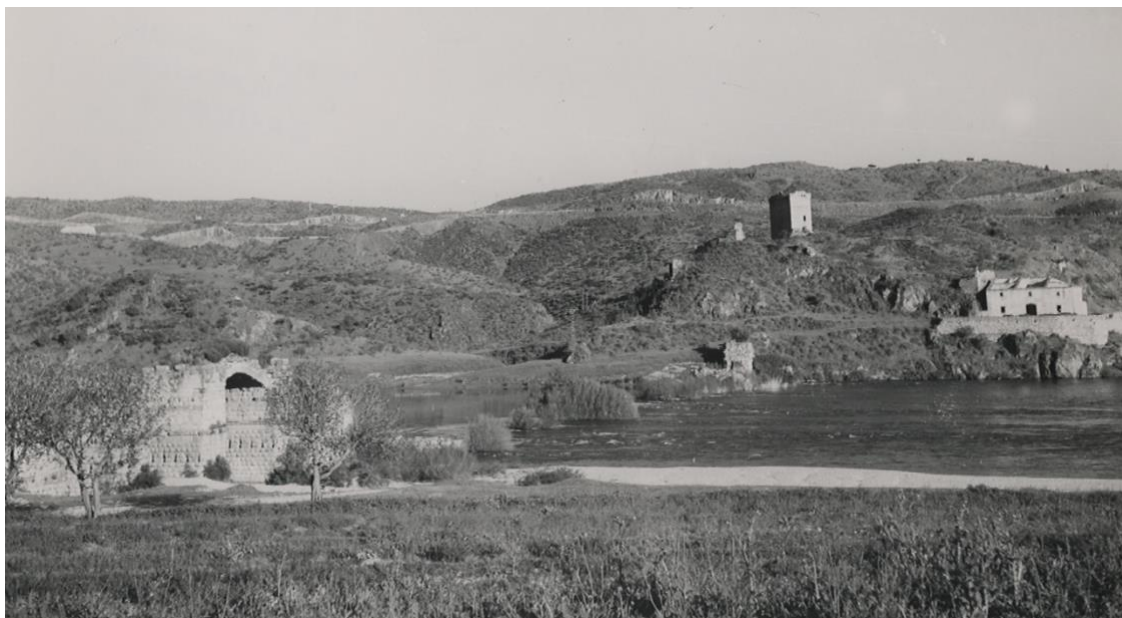
Imagen 2. Castillo de Alconétar, cabeza de la encomienda templaria del mismo nombre entre 1230 y 1310. Su posición estratégica controlaba el Camino de la Plata a su paso por el puente romano sobre el río Tajo.

Algunos autores han logrado identificar las domus Templi que jalonaban el Camino Francés, desde Roncesvalles a Santiago de Compostela (Lalanda, 2013), mientras que nuestra intención es destacar en el mapa los enclaves templarios situados en torno a las vías de comunicación de la Transierra (Imagen 2).