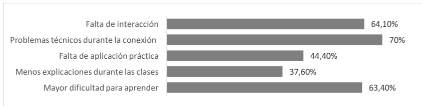
Figura 2. Desventajas del eLearning o enseñanza virtual frente a la enseñanza presencial.

Por otra parte, se ha estudiado la satisfacción del alumnado con respecto a los elementos clave de su formación universitaria. El cálculo de los principales estadísticos descriptivos nos informa de que todos los aspectos presentan una mediana de 3, en una escala Likert de 5 puntos, siendo la media más baja la relacionada con las clases (2,93) y la más alta la que hace referencia a la adecuación a las circunstancias (3,17). Por otra parte, la desviación estándar o típica de todos y cada uno de los ítems se sitúa en torno a 1, y las distribuciones son más aplanadas que la curva normal. Finalmente, encontramos un coeficiente de asimetría con valor positivo en los ítems de profesorado y clases, que son los peores valorados, mientras que presenta valor negativo en el resto de ítems. La comparación de variables se ha realizado mediante el coeficiente de variación y se ha constatado su baja variabilidad.