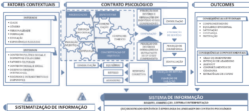
Figura 1: Modelo teórico do contrato psicológico

De acordo com Scotti (1994), “Noam Chomsky é um dos teóricos que mais claramente propôs as possíveis e prováveis relações entre o fenômeno da linguagem e correlatos processos mentais” (p.64). Já Vygotski considera que a linguagem tem uma estrutura funcional e instrumental na medida em que possibilita a interação entre si. Perspetiva que compreende a linguagem como elemento presente nas relações do pensamento.