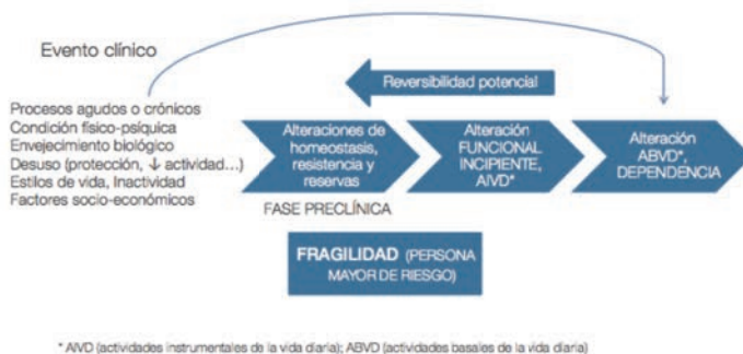
Figura 1. Evolución de la capacidad funcional y fragilidad en la persona mayor