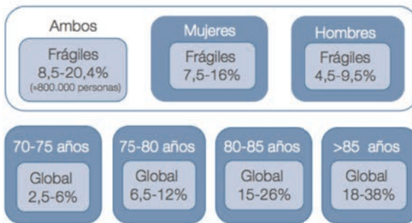
Figura 2. Prevalencia de fragilidad en la población mayor en España, por sexo y tramos de edad

*Elaboración a partir de los datos de cohortes longitudinales de envejecimiento en España; Estudio FRADEA (Albacete) 20,21,22 , Estudio de Envejecimiento Saludable de Toledo 22 , Estudio Peñagrande (Madrid) 7,23 , Leganés (Madrid) 24 , Estudio FRALLE (Lleida) 27,28 .