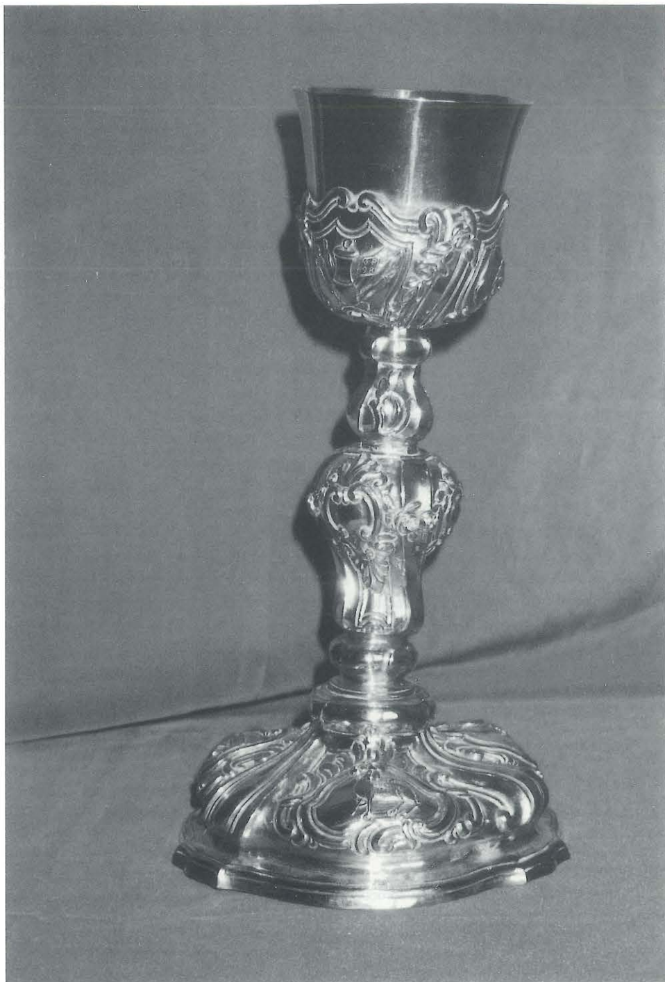
FIG. 1. Berlanga (Badajoz). Parroquia de Ntra. Sra. de Gracia. Cáliz (1782 o 1783-1793).