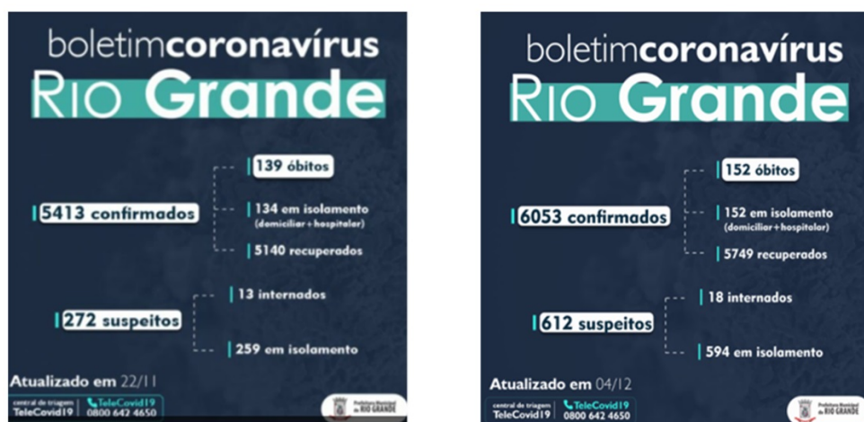
Figura 3. Boletim Coronavírus cidade Rio Grande/RS.