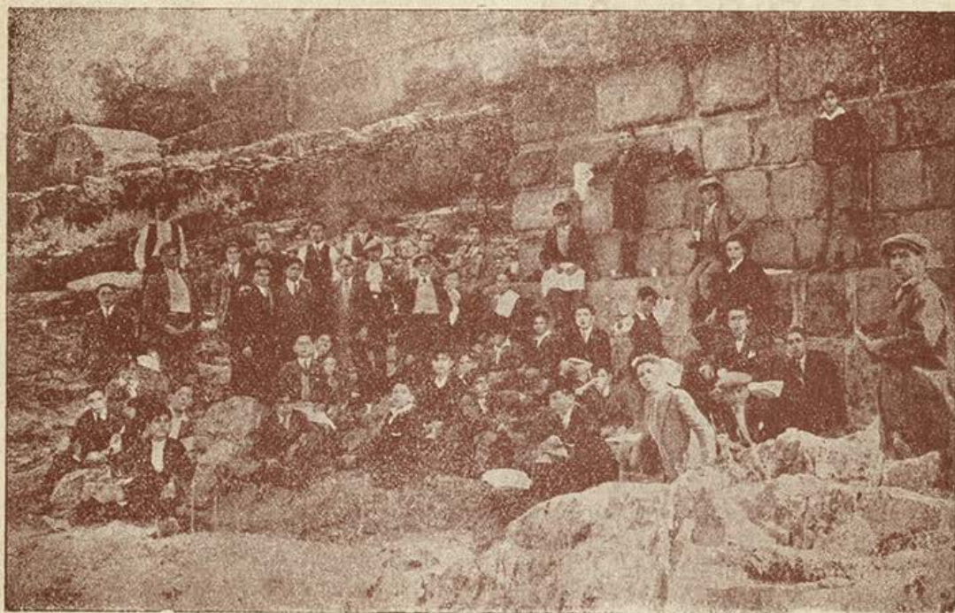
Los alumnos del Colegio descansan bajo un arco del puente romano de Alcántara. Excursión del año 1928.