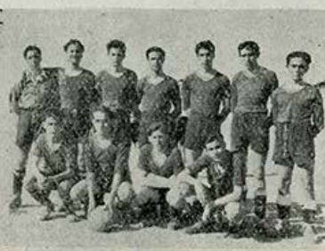
Equipo de Internos.