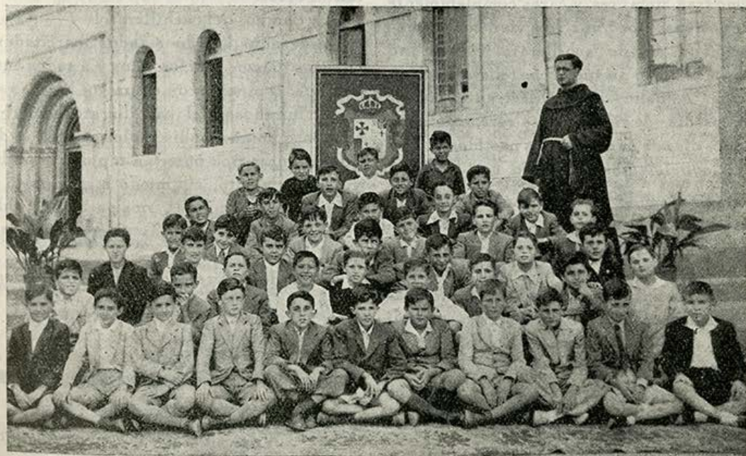
Alumnos que en la convocatoria de junio sufrieron las pruebas de Ingreso.

El señor Obispo, al ver tal milagro, por diversas partes mandó publicarlo.