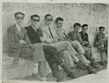
¡Perdemos, perdemos... ¡Mala suerte!

La clasificación general quedó de esta manera: Internos, 29 puntos; Externos, 18. Ganó la Copa «Padre Rector» el equipo Internos.— G. Campos.