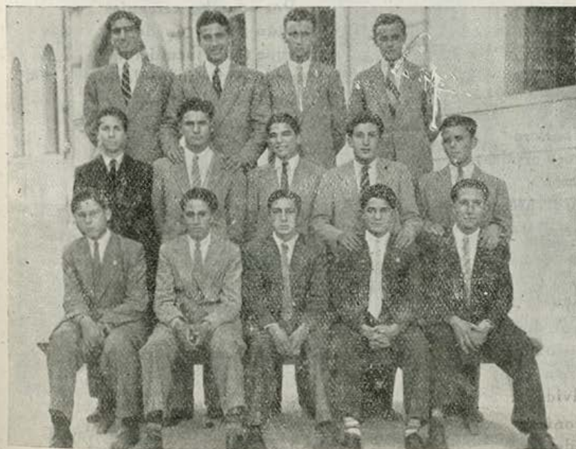
Alumnos de 7.º curso