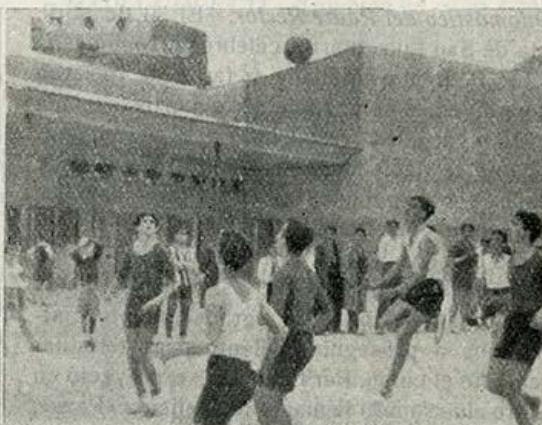
Un interesante partido de baloncesto.

En el partido de baloncesto, si bien estuvo