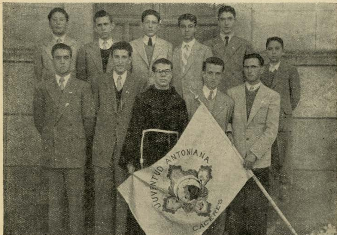
Junta Directiva de la Juventud Antoniana.