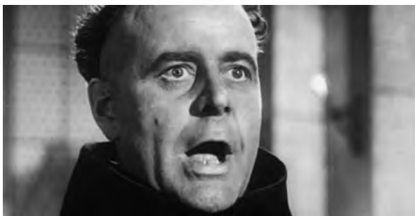
Niall MacGinnis en Martín Lutero ( Martin Luther , 1953), dirigida por Irving Pichel.

El cine desde sus albores ha utilizado las biografías de personas ilustres para intentar crear personajes eternos. Como todo en esta vida versa sobre acotar para conseguir cierto grado de excelencia, comencé mi búsqueda primero por Carlos V en el cine -del que creo que se han escrito muy pocos guiones, para la riqueza del personaje- y luego me centré en Lutero, que podría ser el nexo de unión e hilo conductor para mi estudio.