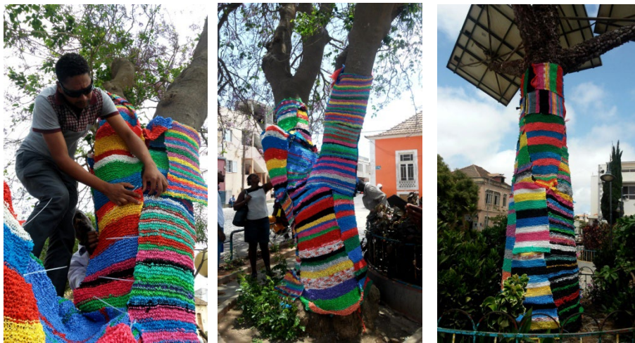
Figura 4. Instalación de los tejidos en los árboles

Con respecto al primer objetivo marcado, de realizar una intervención artística en la plaza de Assomada es importante mencionar que tuvimos todo el apoyo institucional para llevarla a cabo, tanto por parte del IUE como de la Câmara Municipal (Ayuntamiento) y así mismo del Ministério da Educação e Desporto y de la Direção do Ambiente, Saneamento e Protecção Civil de Santa Catarina, dándonos toda la ayuda necesaria para la organización, preparación, difusión y finalmente instalación del proyecto. Del mismo modo, aunque no estaba previsto realizar ninguna actividad más ese día, los delegados de la Câmara Municipal y representantes de la Direção do Ambiente, Saneamento e Protecção Civil nos pidieron llevar a cabo una exposición artística de productos y objetos realizados todos ellos con plástico reciclado, petición que lógicamente aceptamos con mucho agrado. La exposición se llevó a cabo el mismo día y se expusieron objetos de todo tipo: pendientes, papeleras, escobas, móviles con borlones, vasos, cestas, etc.