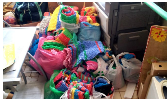
Figura 3. Metros de tejido terminado