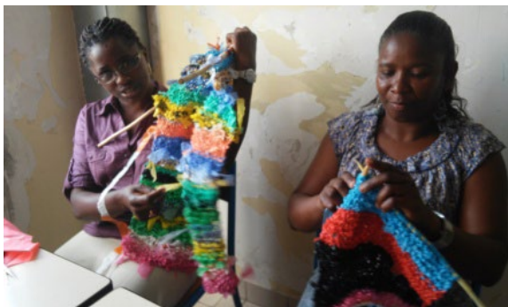
Figura 2. Alumnas del IUE tejiendo

Durante las dos sesiones a la semana que teníamos clase, durante un poco más de tres meses, tejimos unos 100 metros de paño en total de bolsas de plástico con las que además de envolver los troncos de los árboles del pueblo el día internacional del medio ambiente, fabricamos algunas mochilas y bolsos de diferentes tamaños y colores. Fue un trabajo especialmente gratificante, tanto por el hecho de realizar una actividad amable con el medio como por el de aprender una técnica (el punto) que no conocían en el país y que les resultó de lo más práctica y entretenida. Pero principalmente práctica, porque rápidamente se percataron de las infinitas posibilidades que tenía este tejido para aplicarlo en sus vidas cotidianas y sacarle provecho (hacer techados de sombra para los animales, fabricar mochilas y demás accesorios sin tener que gastar un dinero que no tienen y recoger agua de la niebla para sus necesidades diarias).