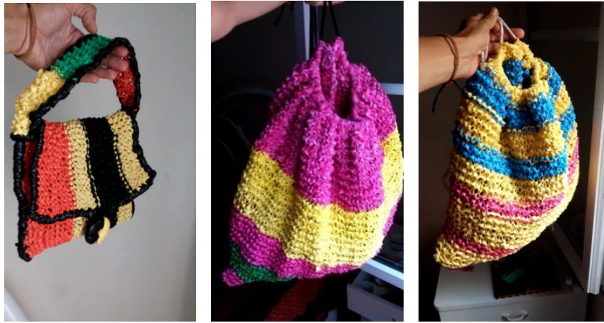
Figura 5. Bolsos y mochilas realizadas tejiendo plástico