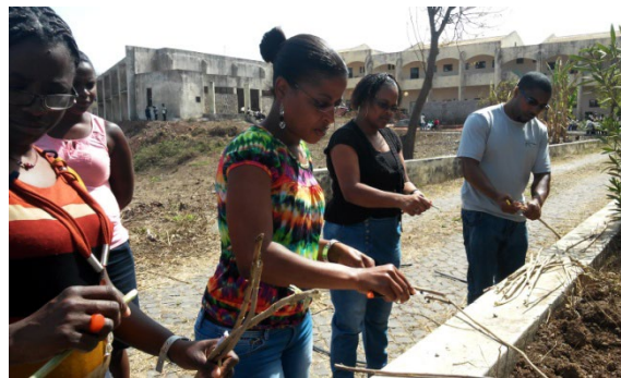
Figura 1. Alumnos fabricando las agujas de punto

La primera fase comenzó con una introducción teórico-práctica de la importancia del reciclaje y la visualización de trabajos artísticos relacionados con el reciclaje y el medio ambiente. A continuación nos desplazamos a una zona en las traseras del edificio de la Universidad donde se encontraba un árbol seco del que cogimos ramas para fabricar las agujas con las que tejeríamos nuestros metros de tejido; este fue el primer trabajo de reciclaje, las propias agujas, ya que allí no existían tiendas que las comercializaran y tampoco conocían la técnica del punto. Una vez que todos teníamos nuestras agujas les enseñé a tejer, trabajo que nos llevó un par de semanas, hasta que perfeccionaron la técnica.