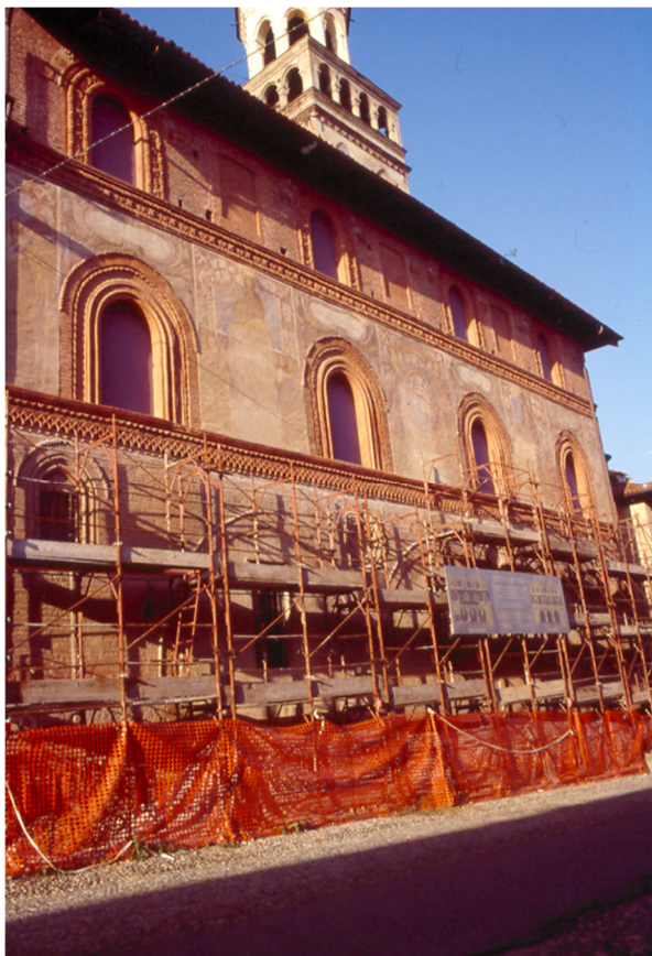
6. Fase final de las obras

del láser (tipo Nd Yag ) y los revestimientos con mampostería vista y otras partes decoradas fueron limpiados con medios manuales mediante escalpelos, cepillos y agua nebulizada.