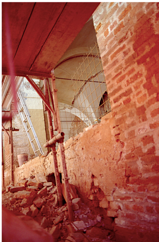
8. Eliminación del taponamiento de los arcos del pórtico

siempre en el mismo lado, de una puerta que conduce a la sala de calderas y la consolidación de la esquina del Palazzo por medio de una operación de scucicuci ; la restauración del paramento, la reintegración de las jambas de la ventana y la reapertura de una gran puerta que conducía al sótano en vía San Giovanni; la colocación de tirantes, la restauración de la mampostería con operaciones de scuci-cuci en el cuerpo hacia Piazza San Giovanni , así como la consolidación de las bóvedas del sótano y la realización de micropilotes en la cimentación.