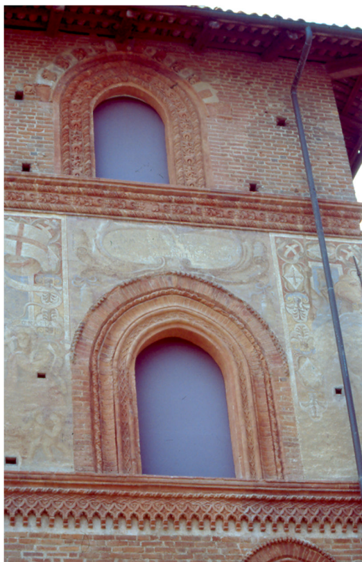
7. Reconstrucción de la decoración en terracota y redefinición de los frescos del siglo XVII.

poder abrir después el pórtico), se procedió a la apertura de la última ojiva hacia el Castillo, a la reconstrucción de los muros de las aperturas modificadas para la apertura de las nuevas ventanas con la reintegración, también en este caso, de las jambas de las ojivas y de la franja horizontal de la que quedaba, en realidad, un tercio del total. En el caso de la primera franja, así como para todas las piezas cerámicas añadidas en todas las jambas, se trabajó mediante el calco de las todavía existentes. Siempre en lo que respecta al primer piso, se consolidó el enlucido mediante inyecciones de cal hidráulica, puzolana y fluidificante, integrando las partes faltantes, especialmente donde las ventanas estaban cegadas, y redefiniendo y reintegrando las pinturas realizadas por Cesare Arbasia en 1601 mediante colores al acuarela aplicados en veladuras y punteados sobre la base de las sinopias, donde todavía son perceptibles, basándose teóricamente en las imágenes fotográficas de principios del siglo XX donde sin embargo no eran legibles.