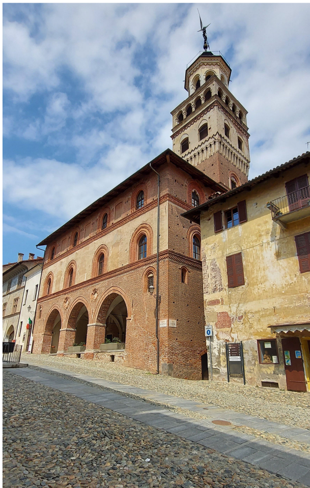
10. Salita al Castello : estado actual del Antiguo Palazzo Comunale y de la Torre

bre el proyecto que se está realizando, en el que se deben conocer bien las consecuencias inevitables, esa continuidad y discontinuidad, así como la multiplicidad y parcialidad que pretendemos leer aquí como bases esenciales para el conocimiento, también constituyen y condicionan el presente 36 .