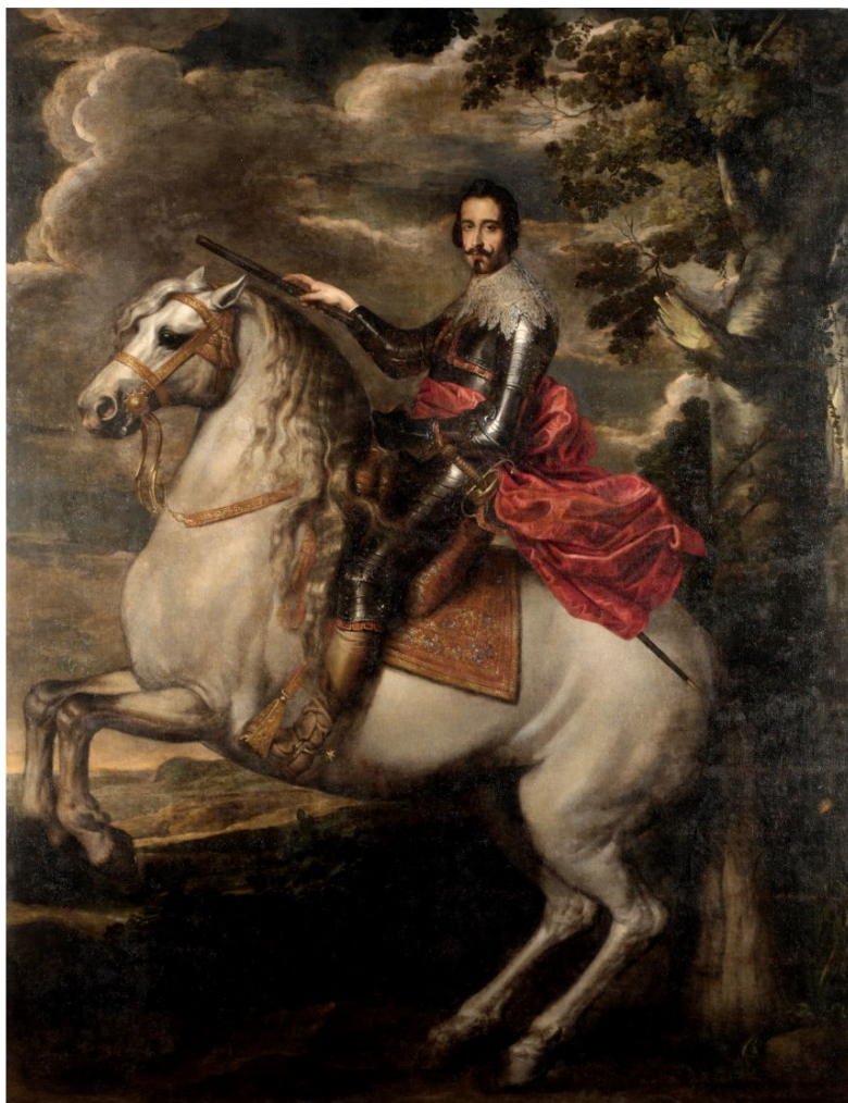
Figura 1. Retrato de Felipe de Spínola, II marqués de los Balbases (?). Copia antigua, Juan de Alfaro (?) lienzo 300 x 210 cm. Toledo, Hospital Tavera. Fundación Casa Ducal de Medinaceli.

Como vemos se trata de un retrato ecuestre en un paisaje en el que se introduce a la mano derecha unos árboles. El caballo se dispone en corbeta con unas largas crines que caen sobre el lomo y la pierna del retratado. El personaje se retrata con armadura, un gran lazo carmín atado a la cintura, una valona de encaje sobre los hombros, el collar con el toisón de oro y el bastón de mando