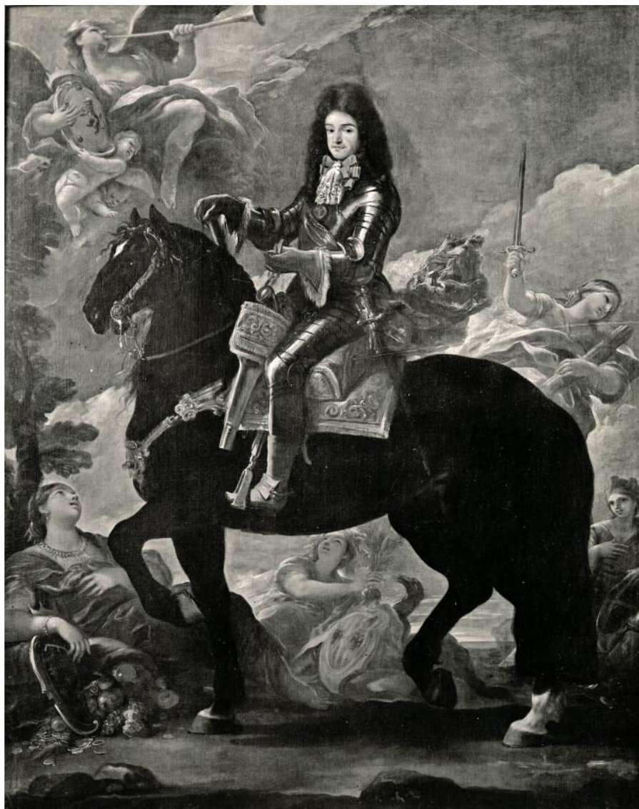
Figura 2. Retrato Ecuestre de Francisco de Benavides, IX conde de Santisteban del Puerto. Luca Giordano, 273 x 210 cm. Colección ducado de Almazán, Madrid.