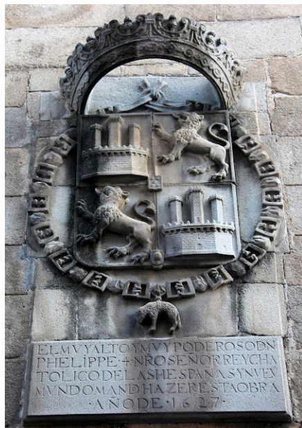
Imagen 2. Facha de la antigua prisión de la ciudad de Plasencia