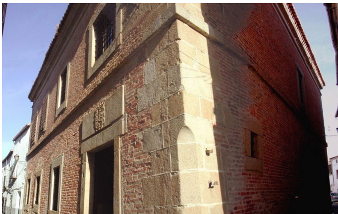
Imagen 1. Cárcel Real de la localidad de Coria