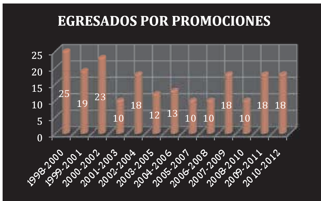
Gráfico 1: Egresados por cada una de las 13 promociones estudiadas

Podemos comprobar en esta gráfica como el nº de egresados de la primera promoción 1998-2000, primera a nivel nacional es el más alto. Seguida de la tercera promoción, 2000-2002. Ambas se sitúan por encima de la veintena, mientras que el resto de promociones se suele posicionar fluctuando entre 18 y 19 egresados (cinco promociones) pero seis promociones a lo largo de distintos periodos (2003, 2005, 2006, 2007, 2008 o 2010) arrojan entre 13 y 10 egresados por curso académico.