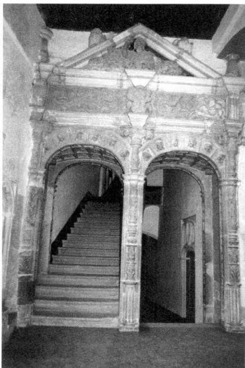
1. Guadalupe (Cáceres). Monasterio. Puerta del claustro mudéjar.

Vicente de Alcántara (Badajoz), el llamativo perfil conopial conseguido con ces en una de las portadas del templo parroquial de Malpartida de Plasencia (Cáceres), la mezcla de soportes (columnas toscano-jónicas, baquetones y balaustres) en la parroquia de Almendral (Badajoz), o el alfiz cajeado en la puerta del convento de las Ildefonsas en Plasencia (Cáceres). En definitiva, simbiosis de motivos y formulaciones más o menos arbitrarias, siempre presentes en los momentos de indefinición estilística.