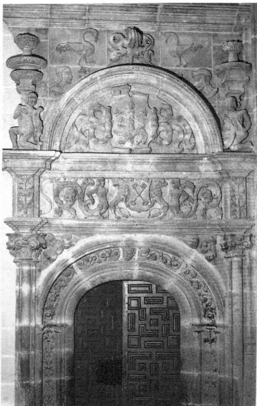
3. Fuente del Maestre (Badajoz). Iglesia parroquial de la Candelaria. Puerta de la sacristía.