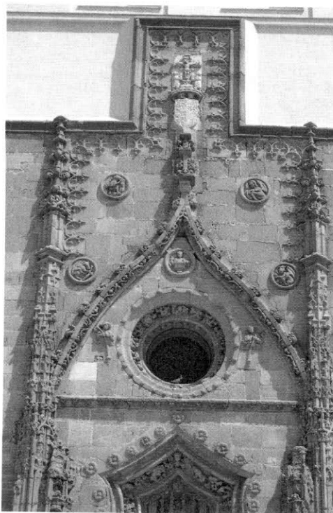
6. Villafranca de los Barros (Badajoz). Iglesia parroquial de N.ª Sra. del Valle. Detalle de la portada del Perdón.