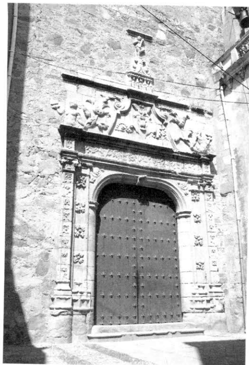
5. Almendralejo (Badajoz). Iglesia parroquial de la Purificación. Portada sur.