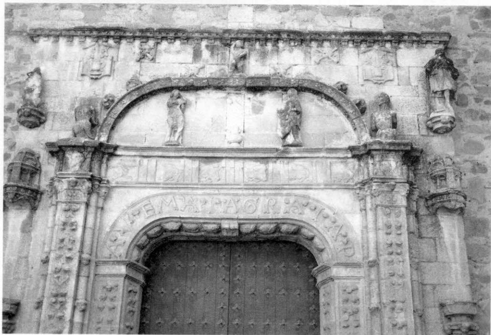
4. Almendralejo (Badajoz). Iglesia parroquial de la Purificación. Detalle de la portada norte.