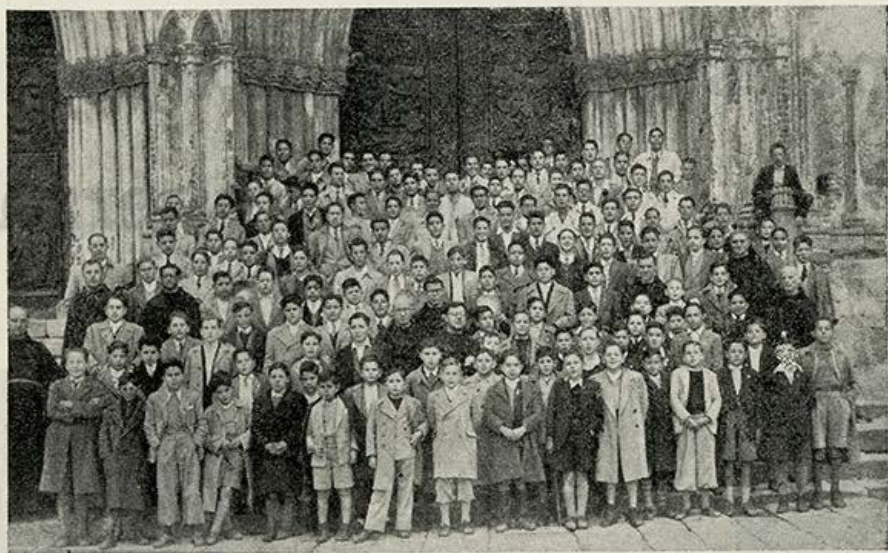
Colegiales que peregrinaron al Santuario de Nuestra Señora de Guadalupe en el pasado mes de mayo.