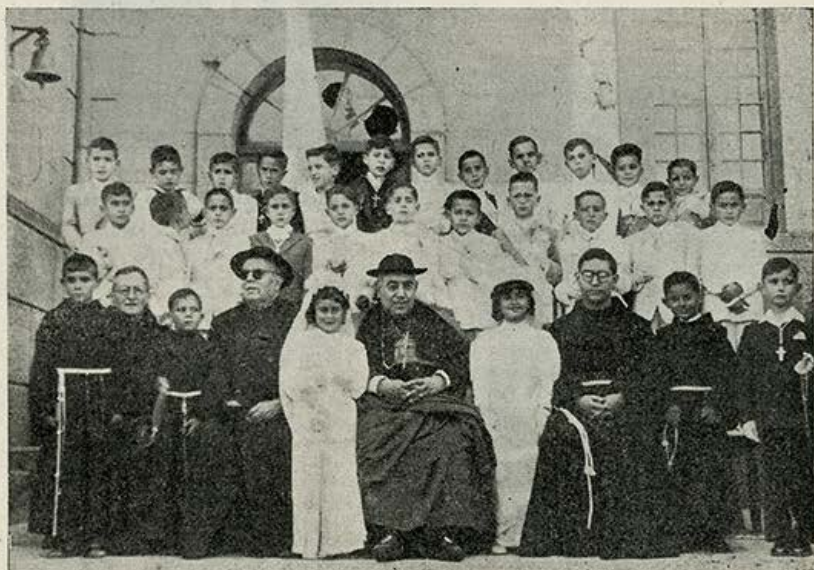
Alumnos de Primera Comunión