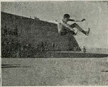
Deporte moderno.—Baloncesto, lanzamiento de peso y salto de altura.