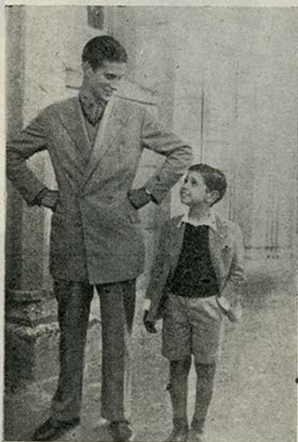
Las dos reválidas: la de ingreso al bachillerato y la universitaria.