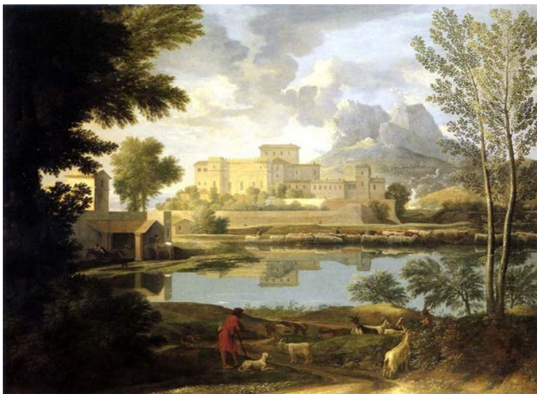
Figura 5. Nicolas Poussin, Paysage par temps calme , 1651 (Los Angeles, J. Paul Getty Museum).