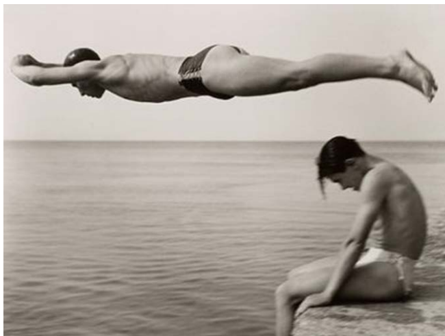
Figura 11. "Il tuffatore", 1951. ©Nino Migliori.