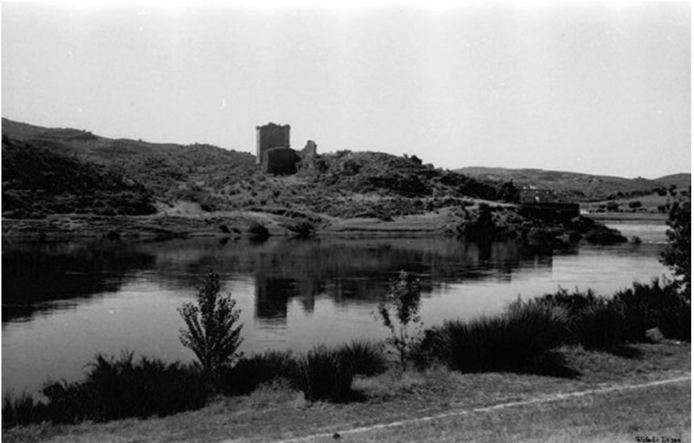
Figura 4. Wifredo López Vecino, año ante quem 1969.