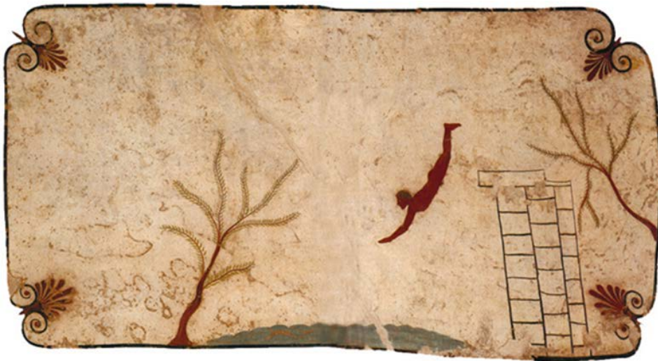
Figura 12. Fresco (circa 470 a.C.; Museo Archeologico Nazionale di Paestum).

A propósito del análisis efectuado cabría aún un nuevo tipo de aproximación, de índole comparada, dado que se rompe la idea de orden temporal, pues su contraste es, ahora sí, azaroso. En 1968 se descubrió en el sur de Italia, en una necrópolis de Paestum, en Campania, una tumba decorada con pinturas, entre las que se cuenta la que cubría la cara interior de la cubierta del sarcófago, que pasó a ser conocida como “Il tuffatore” (El saltador). En esta aparecía un hombre que se arrojaba a unas aguas desde una peana de sillares, escoltado por dos arbustos, en una escena que ha sido objeto de interpretaciones muy diversas (Pontrandolfo Greco, Rouveret y Cipriani, 1992). Desde una perspectiva histórica, la pieza responde a una losa decorada con pinturas rojas de estilo griego arcaizante y se suele fechar en la primera mitad del siglo V antes de Cristo; no obstante, el dibujo presenta una enorme modernidad conceptual: es enigmático y, al tiempo, cotidiano. Al cabo, la pintura capta un instante. Se trata de la pintura de un instante como metáfora de la vida. De ahí su potencia expresiva, su dinamismo. El carácter prácticamente monocromo de los motivos y la tonalidad terrosa del conjunto confiere una moldeabilidad propia de la arcilla, de un baro de alfarero, por así decir 3 .