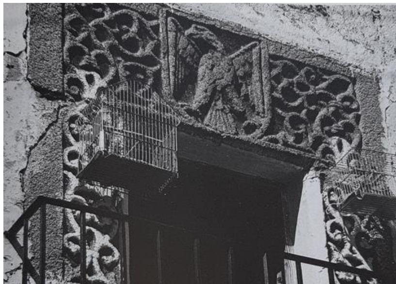
Figura 1. Remigio Mestre (Mestre, 2000, p. 45) Ventana en casa de la calle Piedad 3 (Alcántara, Cáceres), como Casa de los Grajera.

De acuerdo con lo expuesto en las líneas precedentes, al menos son tres los contextos en los que cabe destacar el interés de la imagen objeto de estudio: su ubicación en el conjunto de monumentos de la localidad de Alcántara así como su descripción artística; en segundo lugar, las características de la fotografía que hacen de esta una creación estética destacada; y, finalmente, las influencias de las que se hace eco la imagen, en concreto desde la pintura costumbrista y simbólica (carente de figuras humanas) y desde la tradición comercial de la tarjeta postal en que se inserta la propuesta (como documentan en la ciudad de Cáceres Fajardo y Gómez, 2002). En el capítulo conclusivo se propugna una lectura iconográfica de conjunto derivada de la suma de los tres contextos señalados.