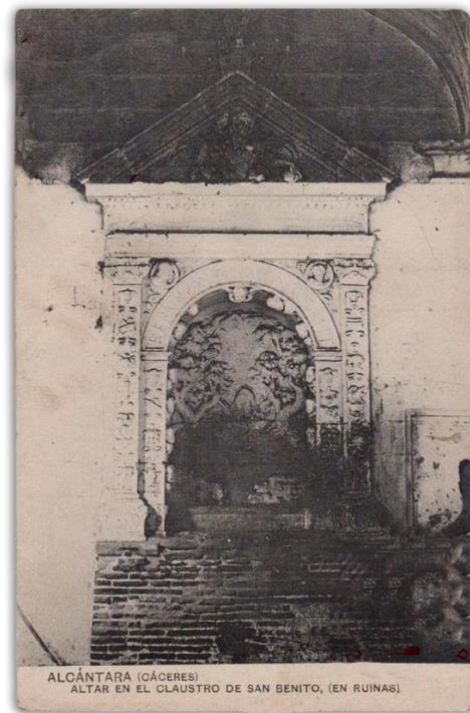
Figura 6. Alcántara-Altar en el claustro de San Benito (en ruinas) (c. 1920) [sin fotógrafo ni editor].

Con posterioridad, al margen de otras instantáneas circunstanciales y al margen también, según se señalará más adelante, de imágenes en repertorios de carácter institucional, ya en el siglo XX y en calidad de tarjetas postales existen dos series de fotografías en blanco y negro, editadas sin que conste su autor, que recogen de manera elaborada vistas tanto generales como detalles imágenes de motivos de la localidad, fundamentalmente relacionadas con el Conventual de San Benito y con el Puente de Alcántara. Se trata de una decena aproximada de postales que portan una breve y certera descripción impresa, sea al pie de imagen sobre una banda blanca o, en la serie más moderna, sobre la propia imagen. Su datación aproximada se sitúa en los años cuarenta, tras la Guerra Civil. Las fotografías se caracterizan por un marcado contraste, con juegos de luces y sombras y un importante interés por el encuadre y el skyline del entorno en las vistas de exteriores. Como ejemplo, puede apreciarse la descrita como “Altar en el Claustro de San Benito (en ruinas)”, en la que sombras, partes enlucidas y relieves marcados crean una fantasmal visión de una hornacina que, aunque abandonada, destila elegancia a pesar el incluso de la peana de ladrillos que indica su uso como una especie de chimenea.