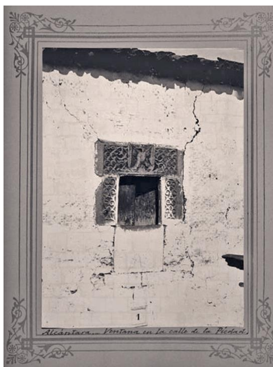
Figura 2. Julián Perate Barroeta (1903: Sáenz, Arbeláez y Maier, 2017, p. 113, nº 956) Alcántara-Antigua ventana en la calle de la Piedad.

En un orden de cosas diferente, en el Catálogo de Fotografías de Antigüedades y Monumentos de la Real Academia de la Historia (Sáenz, Arbeláez y Maier, 2017), de reciente edición, se muestra una de las primeras fotografías de la ventana conservada en el archivo de la Real Academia de la Historia.