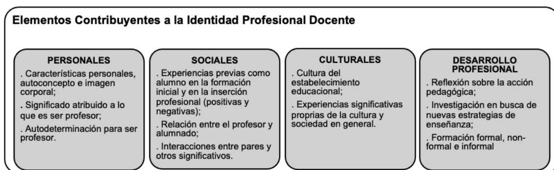
Figura 3. Elementos contribuyentes a la identidad profesional docente

En resumen, ante las contribuciones de los diferentes autores, la Figura 3 materializa la síntesis de los elementos que contribuyen para la construcción de la identidad profesional docente.