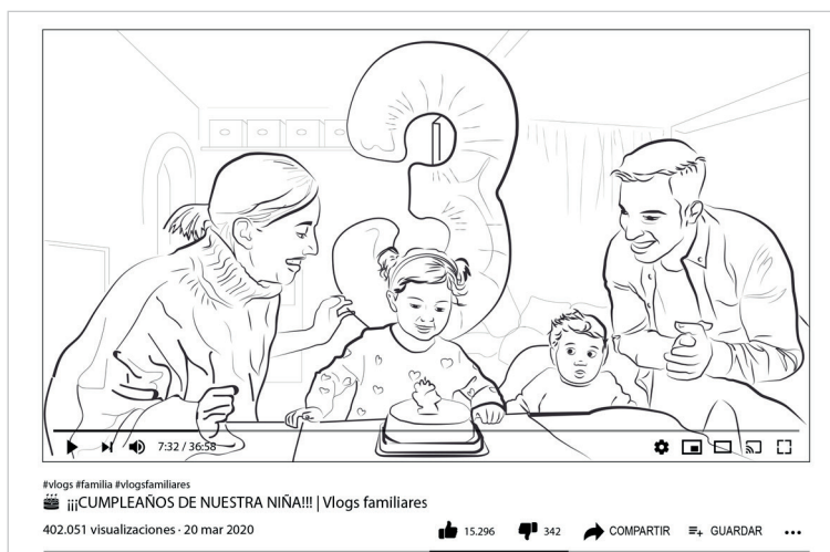
Figura 2. Representación de una captura de pantalla de un momento familiar

Para finalizar el análisis, se llevó a cabo una correlación entre las variables relacionadas con la performatividad y la intimidad para comprender esta práctica como un fenómeno que se asocia con el rendimiento familiar en YouTube. En primer lugar, se recurrió a la prueba de Kolmogorov-Smirnov para evaluar la normalidad de la distribución (relacionada