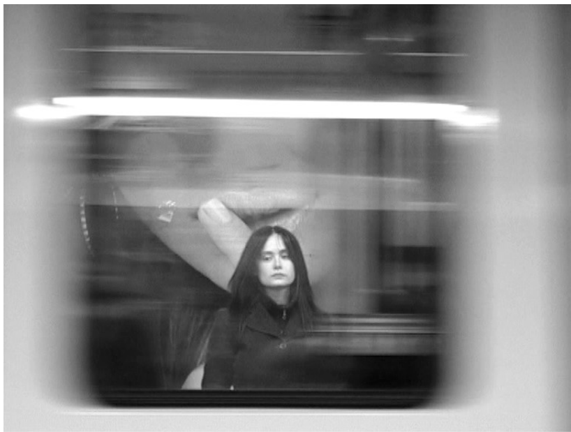
Fig 5. Unas fotos en la ciudad de Sylvia . José Luis Guerin. 2007. Nuria Esquerra.

...contra mi voluntad, el dispositivo automático enfocó el cristal en lugar del rostro deseado...”, para concluirse con un “...testimonio de una revelación [...] apenas una huella de luz [...] una fotografía es eso: la huella de una luz que pasó en algún momento frente a la cámara... 46 .