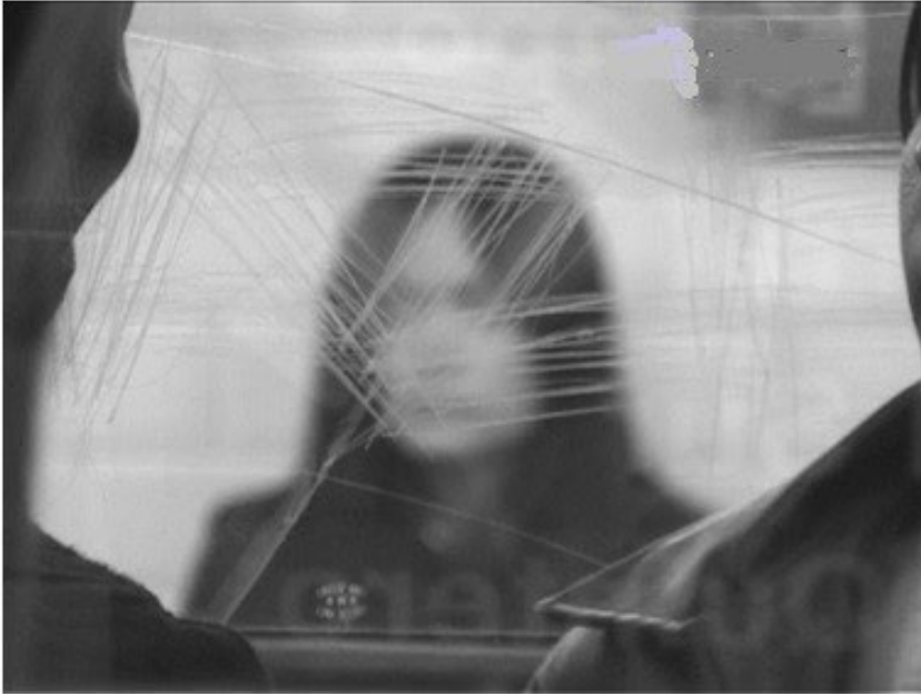
Fig. 6.. Unas fotos en la ciudad de Sylvia . José Luis Guerin. 2007. Nuria Esquerra.