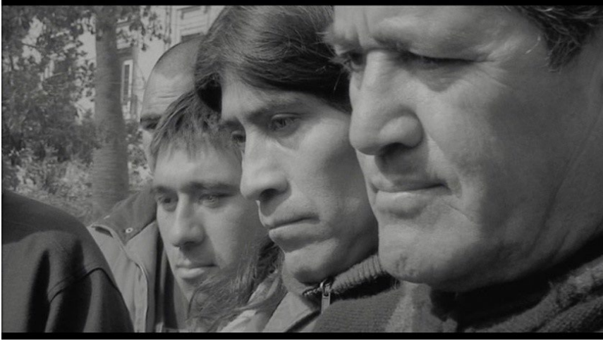
Fig 2. Guest. José Luis Guerin. 2010. Versus Entertainment-Roxbury Pictures.

No vamos a rastrear la historia del cine, ni su historiografía, en busca de evidencias de un posible retrato cinematográfico. Sí mencionaremos a teóricos y a algunos cineastas pero, principalmente, queremos acercarnos al cine de José Luis Guerin, alertados por sus propias declaraciones en cuanto al cine como disciplina posible para el desarrollo del retrato. Si entre los teóricos hemos puesto foco especial en Jacques Aumont es principalmente porque entre sus teorías y la práctica gueriniana (aunque este cineasta no deja de ser, igualmente, un teórico de la imagen aunque ejerza magisterio con su propia cámara), creemos, puede desarrollarse una dialéctica especial.