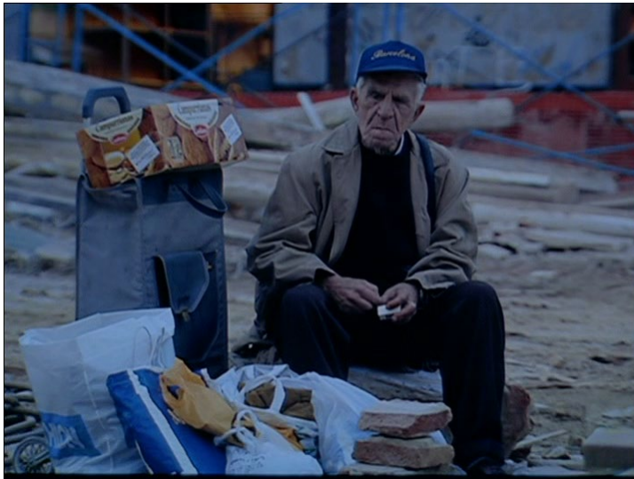
Fig. 3. En construcción . José Luis Guerin. 2001. Ovideo TV S.A., en coproducción con Arte France.

Pasaremos, en el caso del anciano (que figura en los créditos finales como Ex-Marino, Antonio Atar), de un repertorio de opiniones que van desde la exaltación de la cultura y de su “amor por el mar” a evocaciones a la antigua fotogenia del barrio del Raval pasando por la exultante confesión de haber vencido a un tifón o por el convencimiento tremendamente orgulloso de sentirse y saberse “un hombre distinto”.